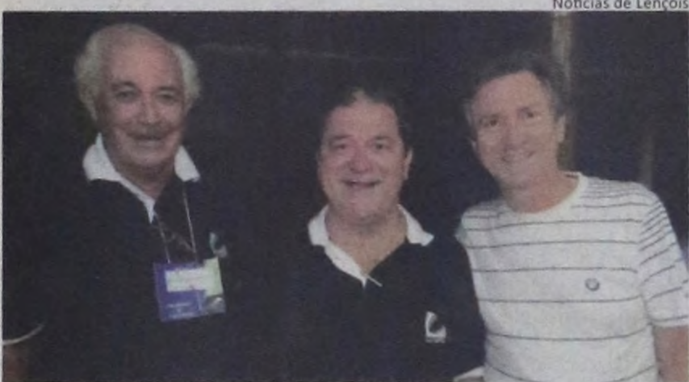
Notícias de Lençóis