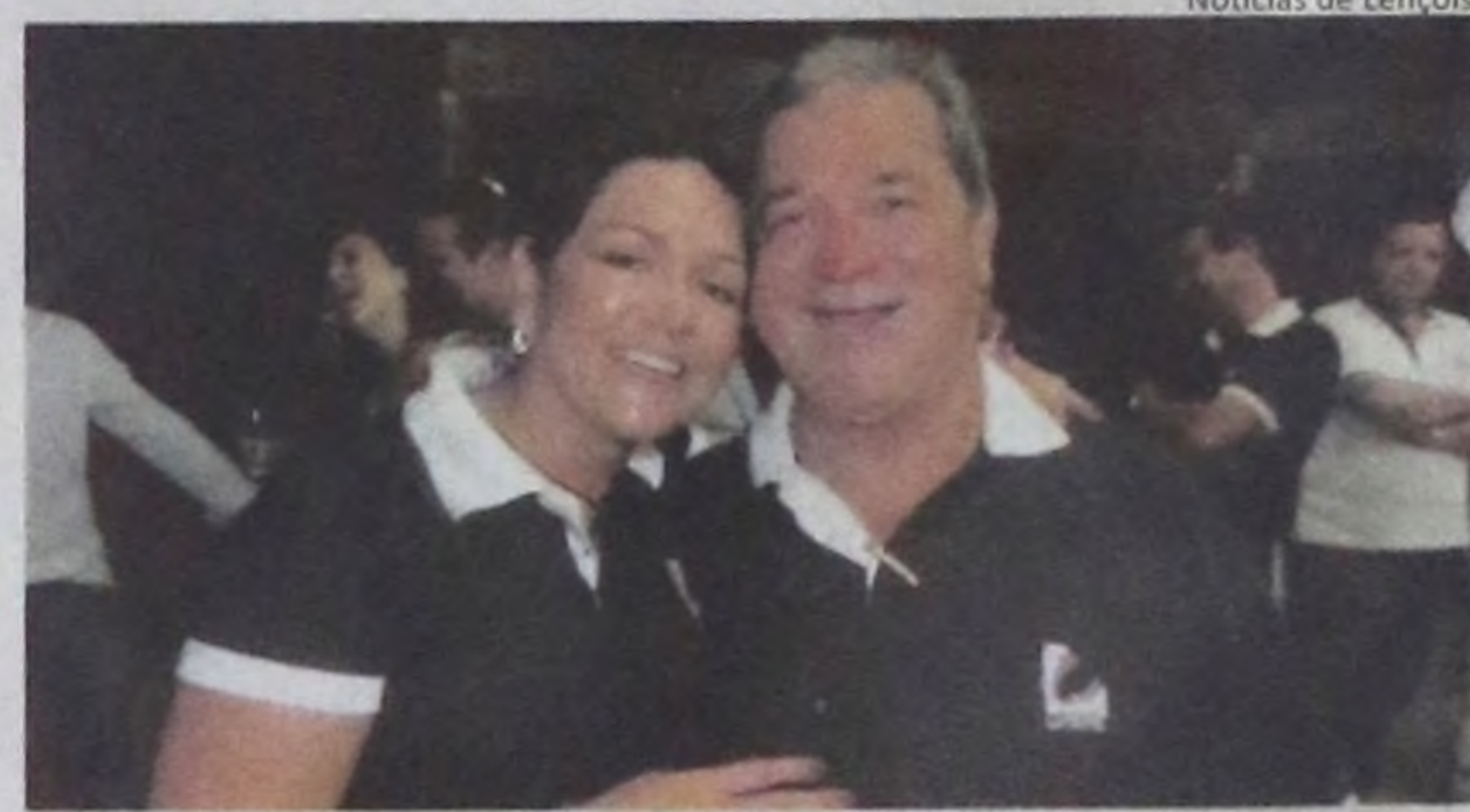
Notícias de Lençóis