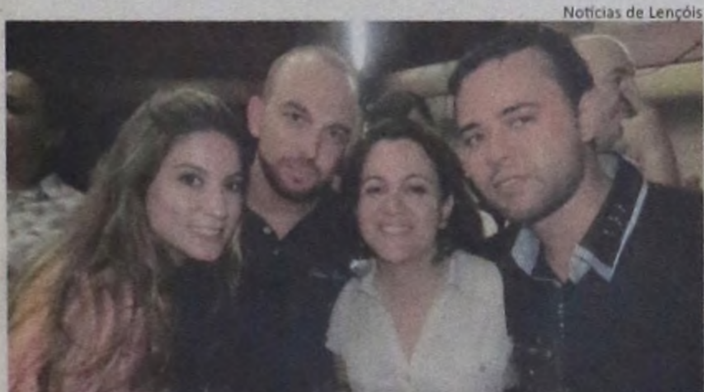
Notícias de Lençóis