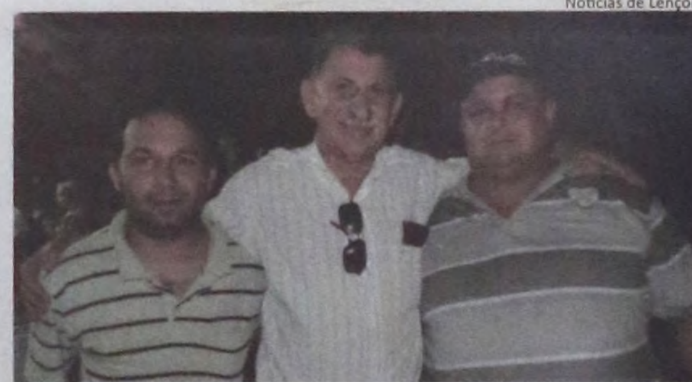
Notícias de Lençóis