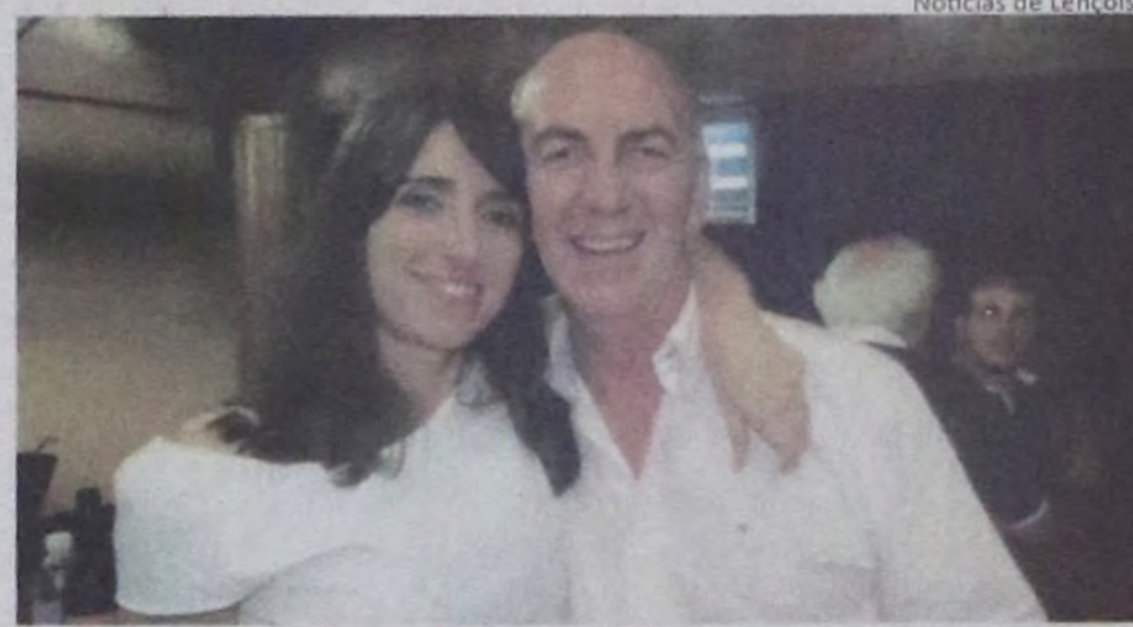
Notícias de Lençóis