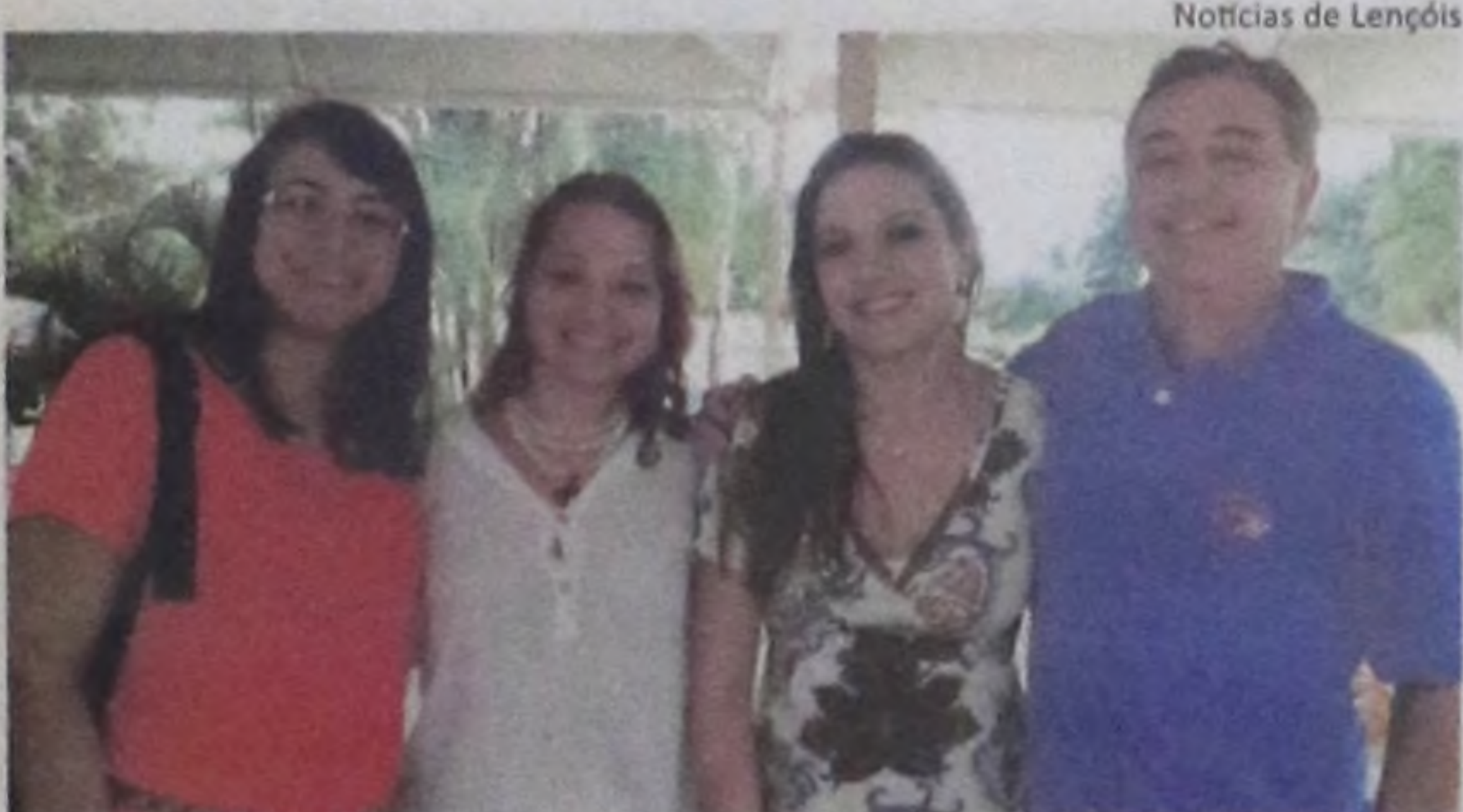
Notícias de Lençóis