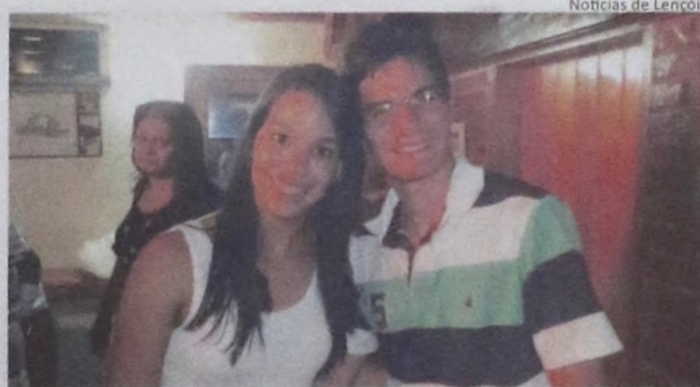
Notícias de Lençóis