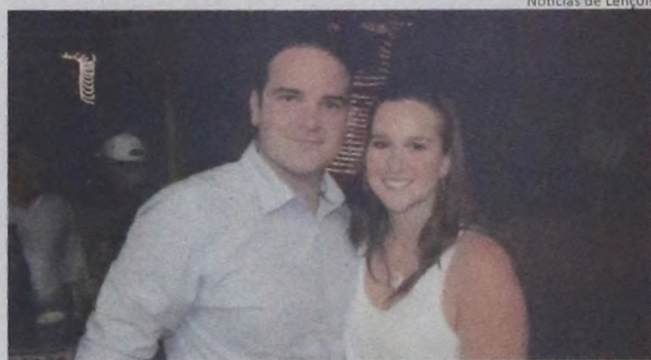
Notícias de Lençóis