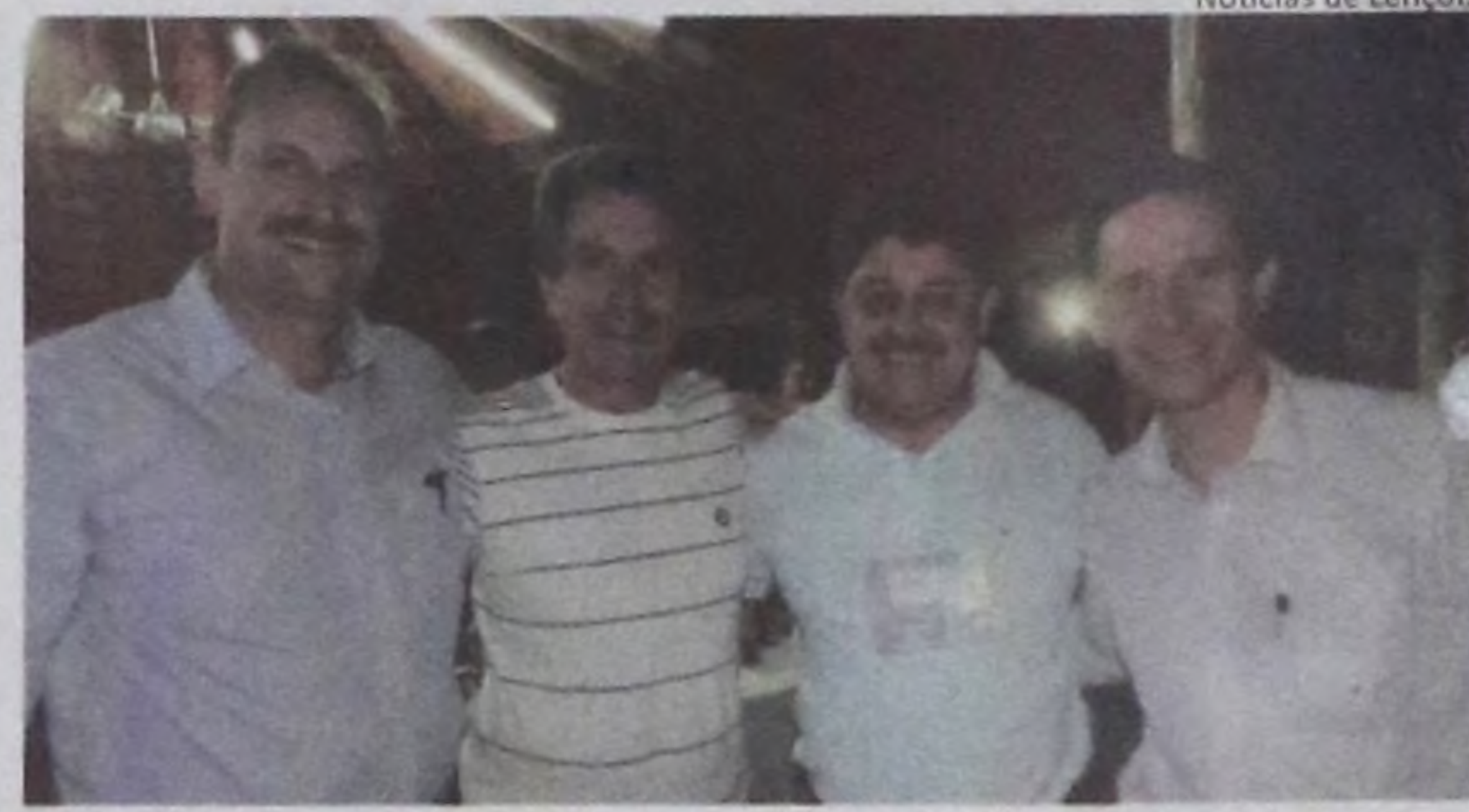
Notícias de Lençóis