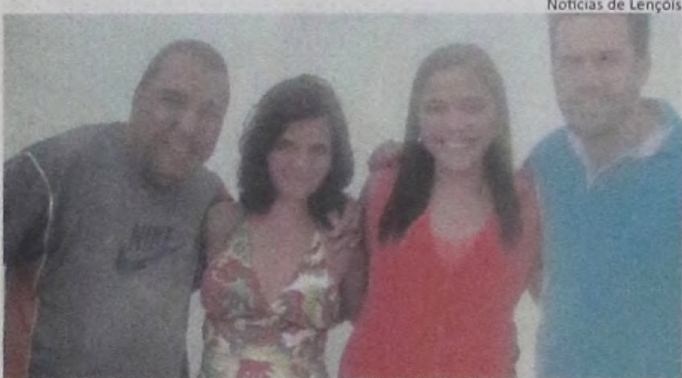
Notícias de Lençóis