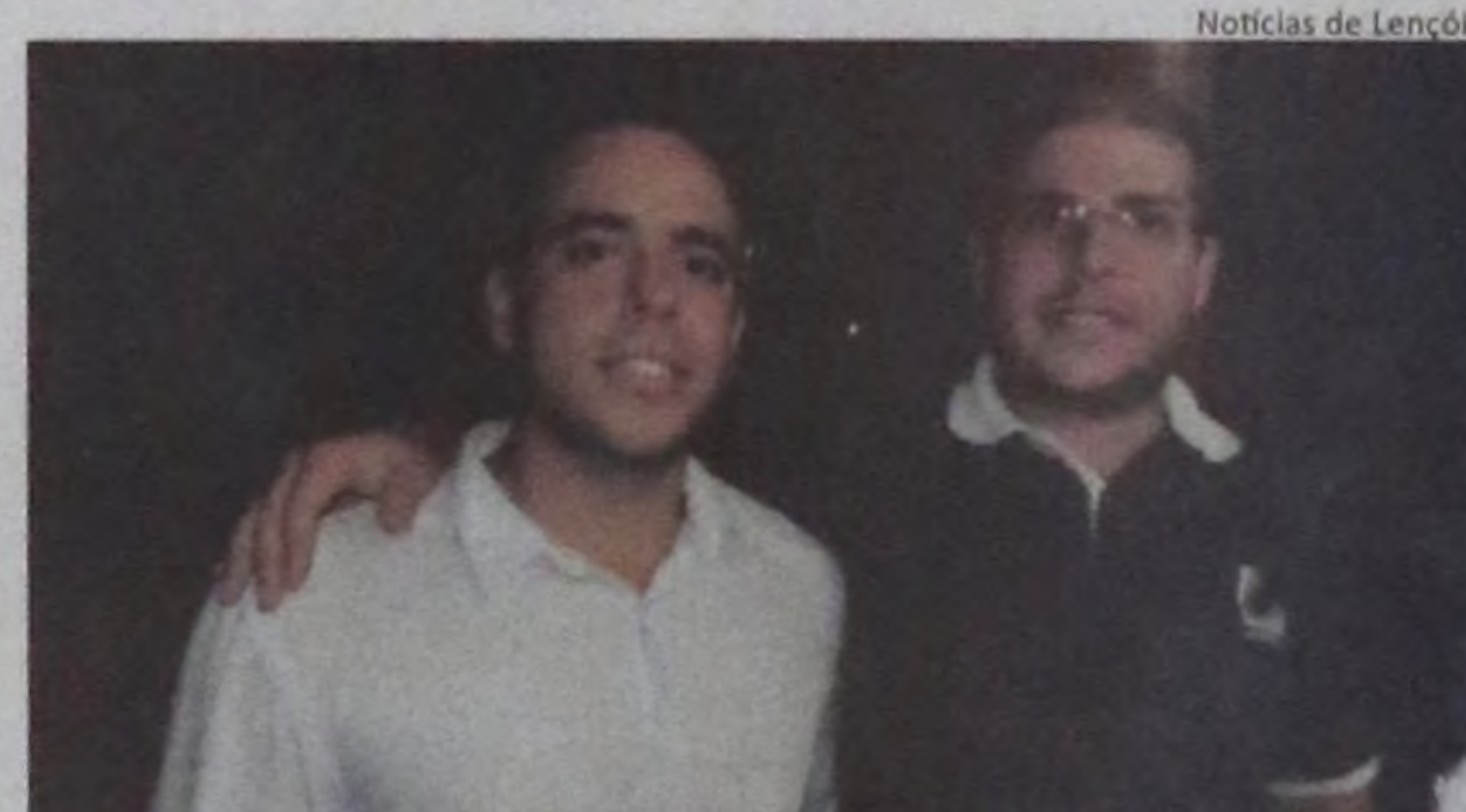
Notícias de Lençóis