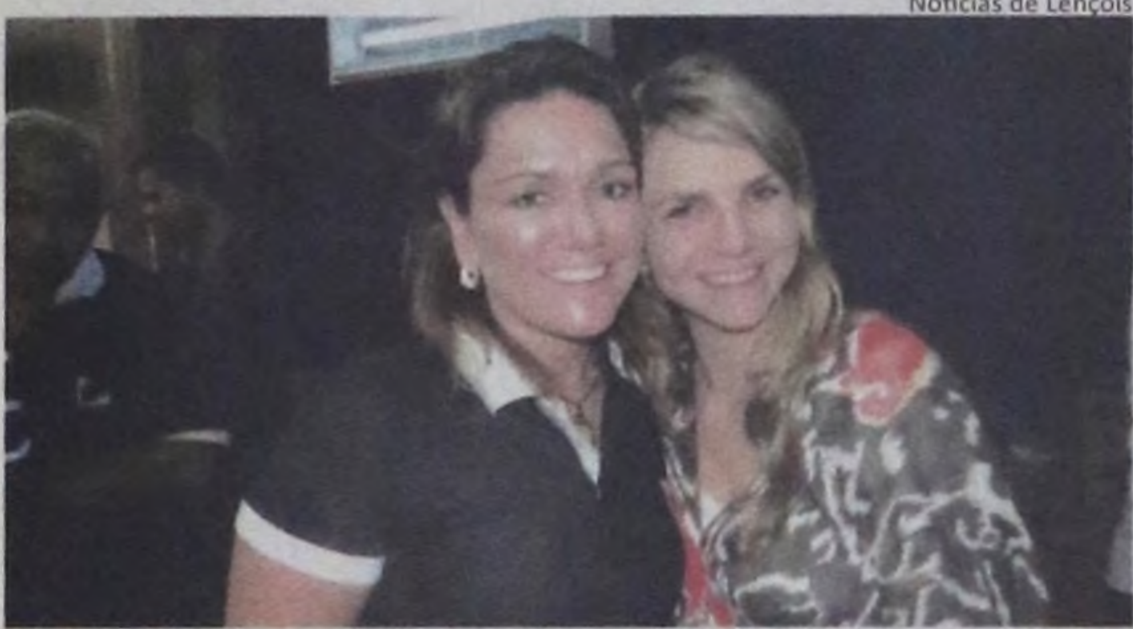
Notícias de Lençóis