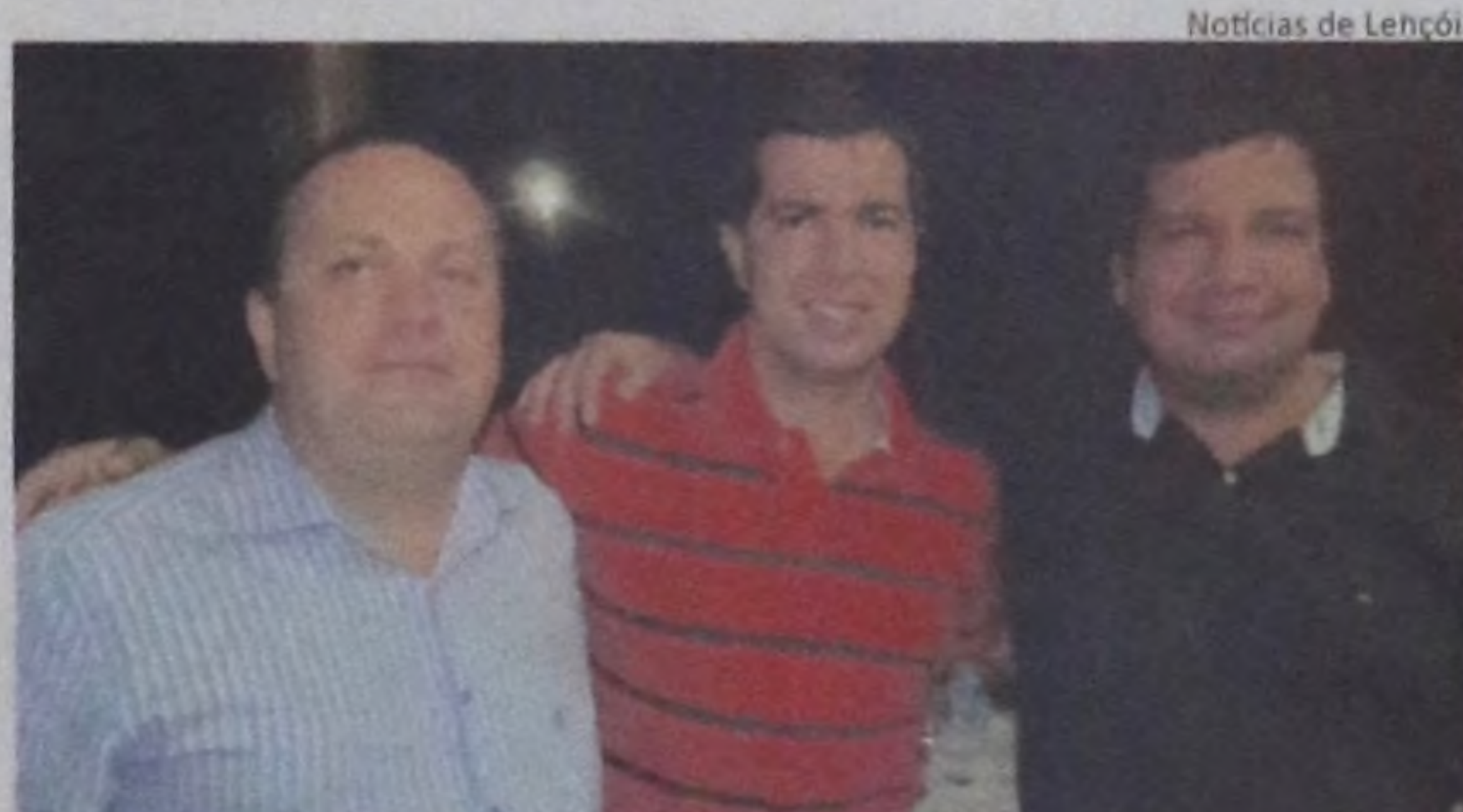
Notícias de Lençóis