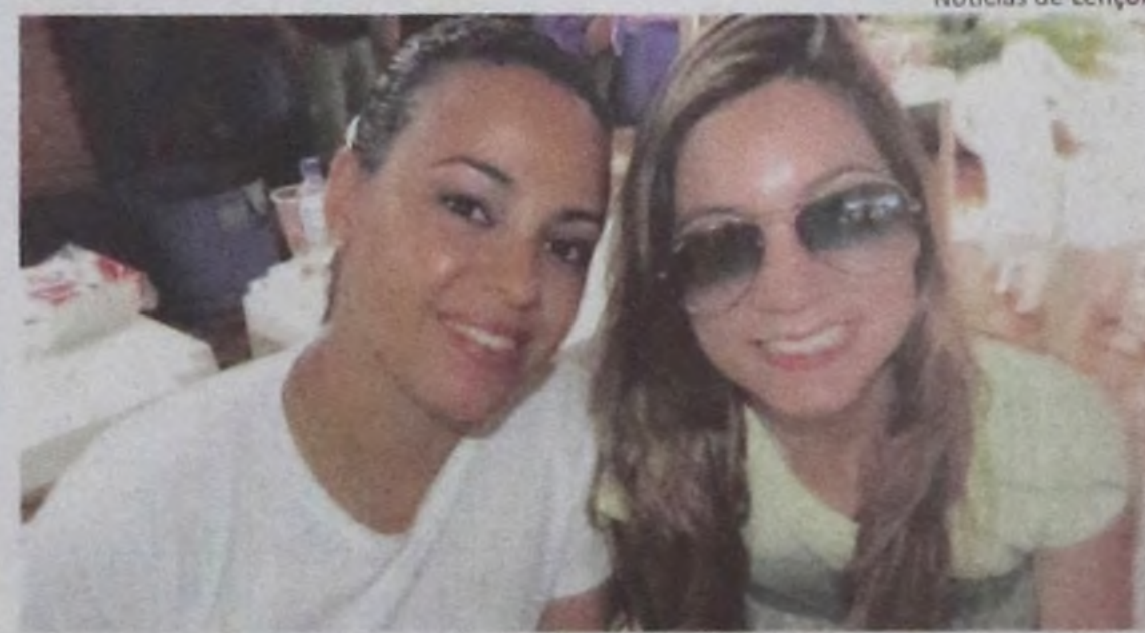
Notícias de Lençóis