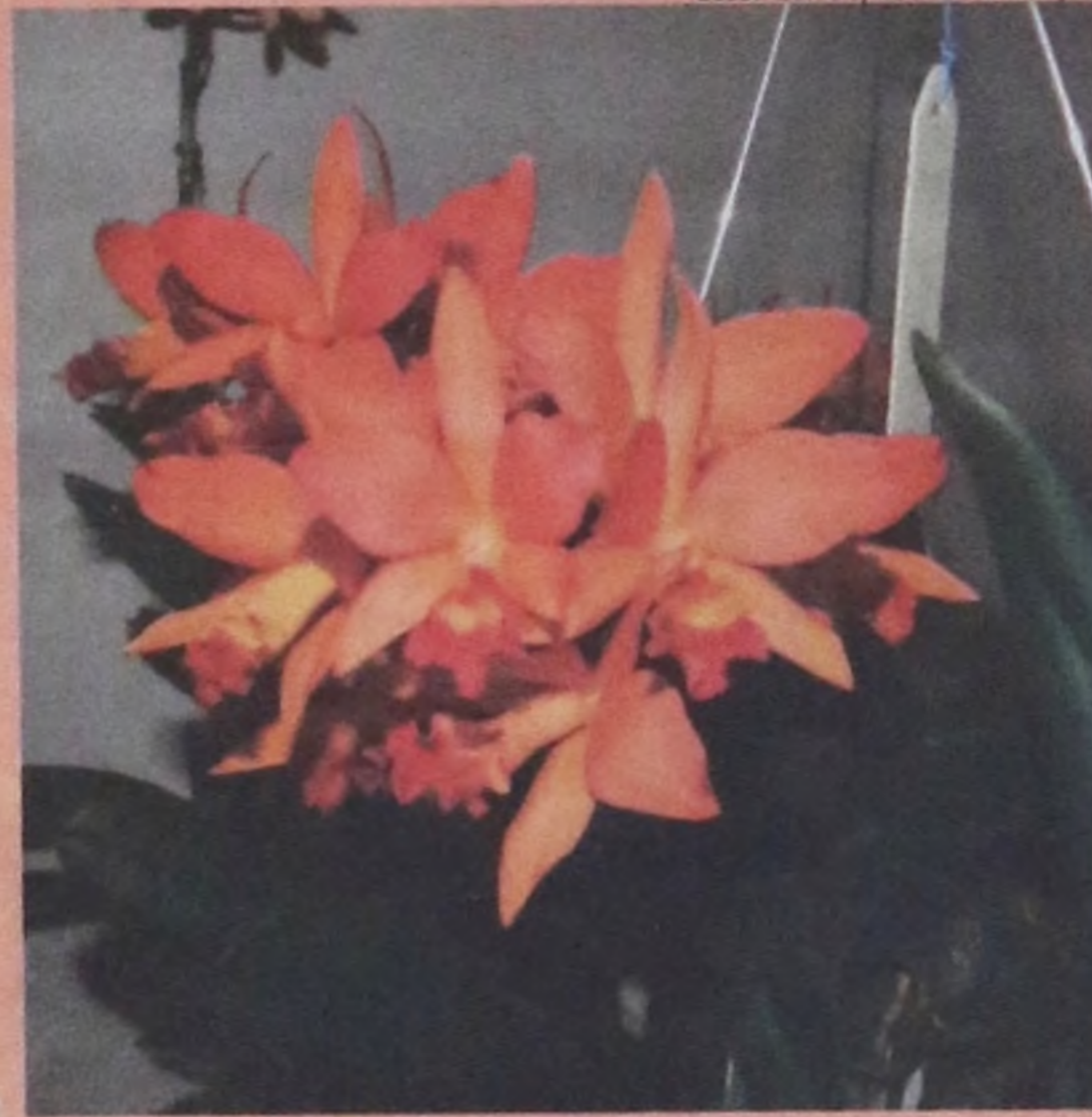
Edson Correia/Notícias de Lençóis

H á doze anos, Lençóis Paulista viu nascer seu Clube dos Amigos Orquidófilos. Reunindo mais de vinte sócios, a organização é responsável por levar o nome da cidade para os principais eventos do circuito nacional de exposições de orquídeas.