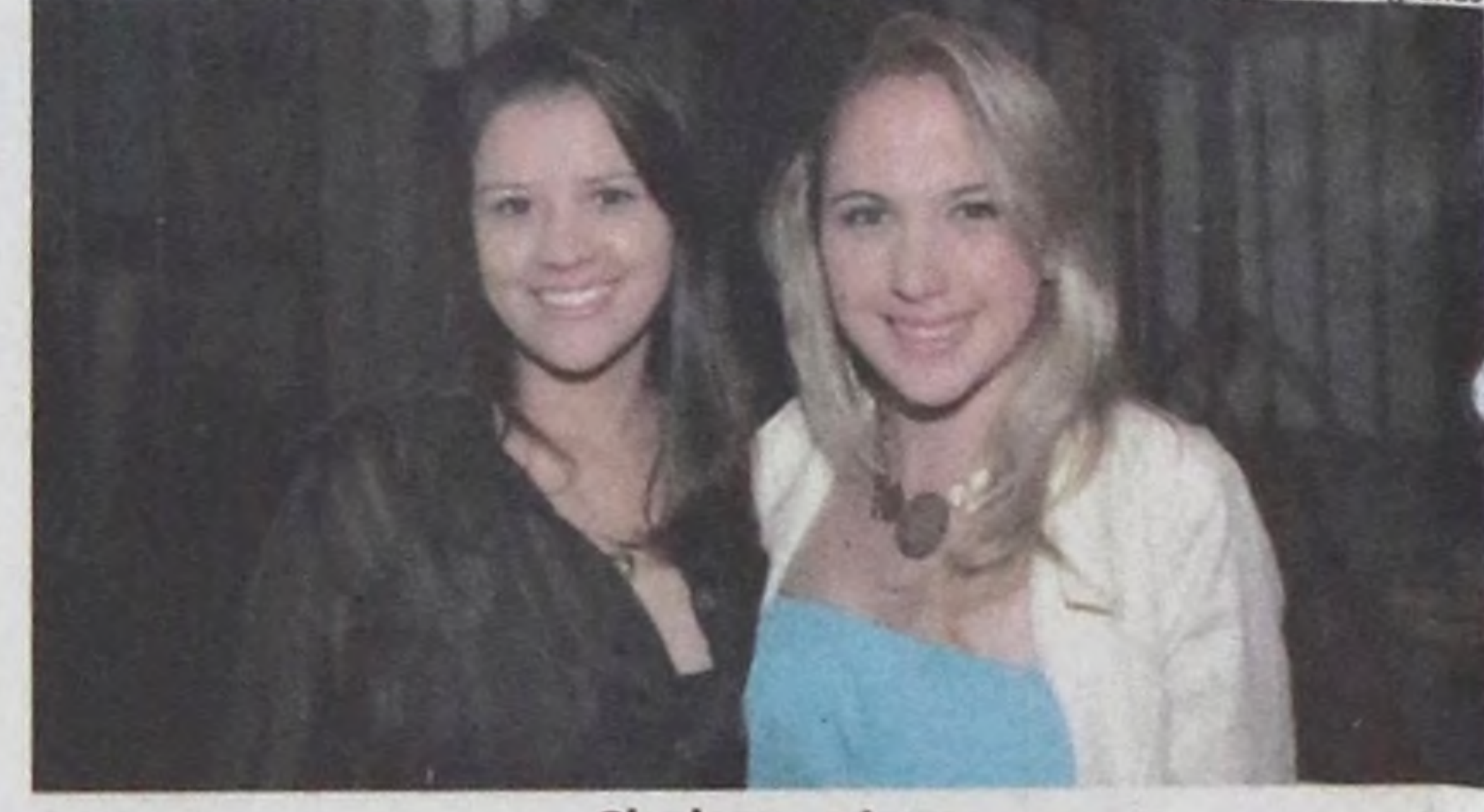
Chalana e Iasa