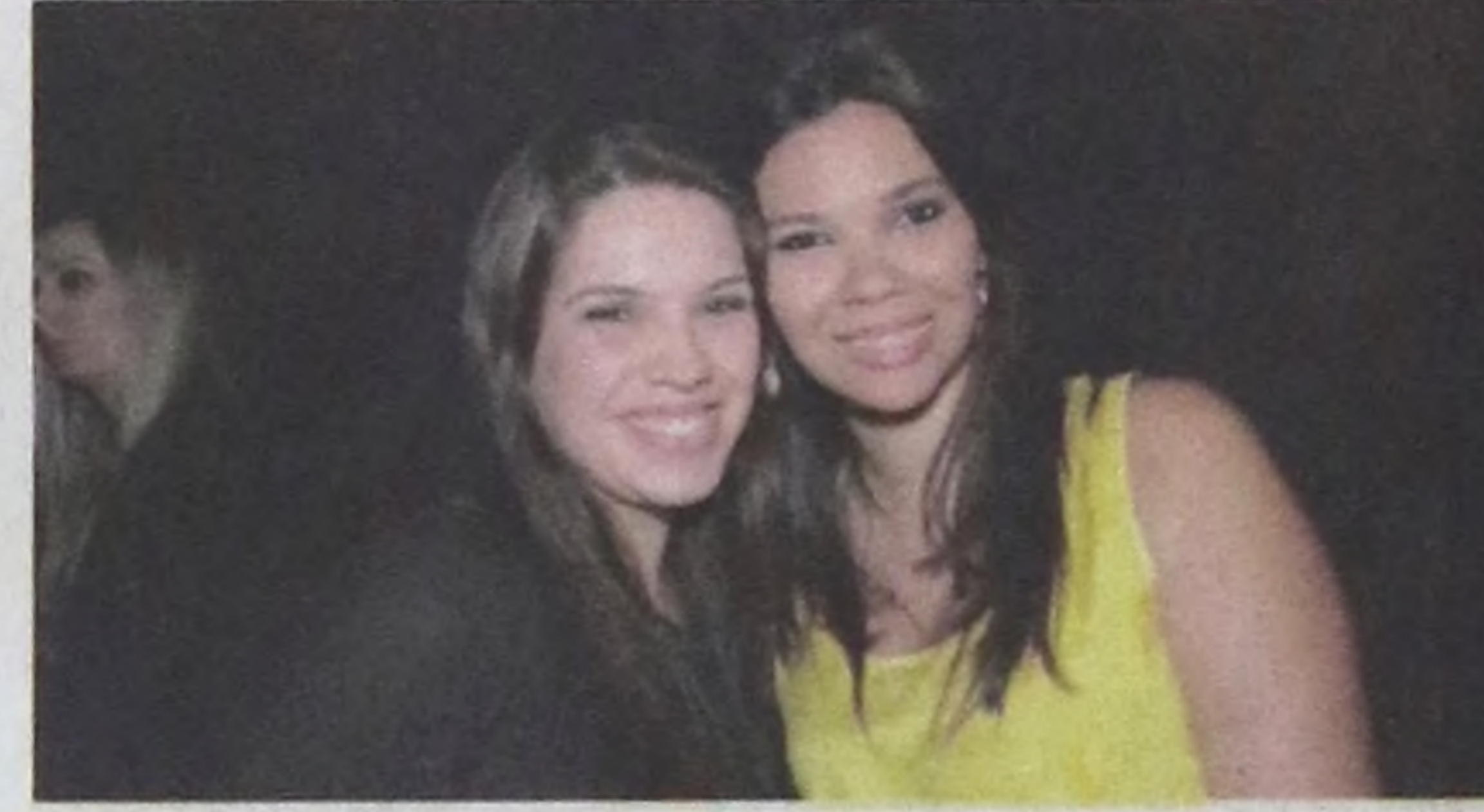
Gabi e Gra