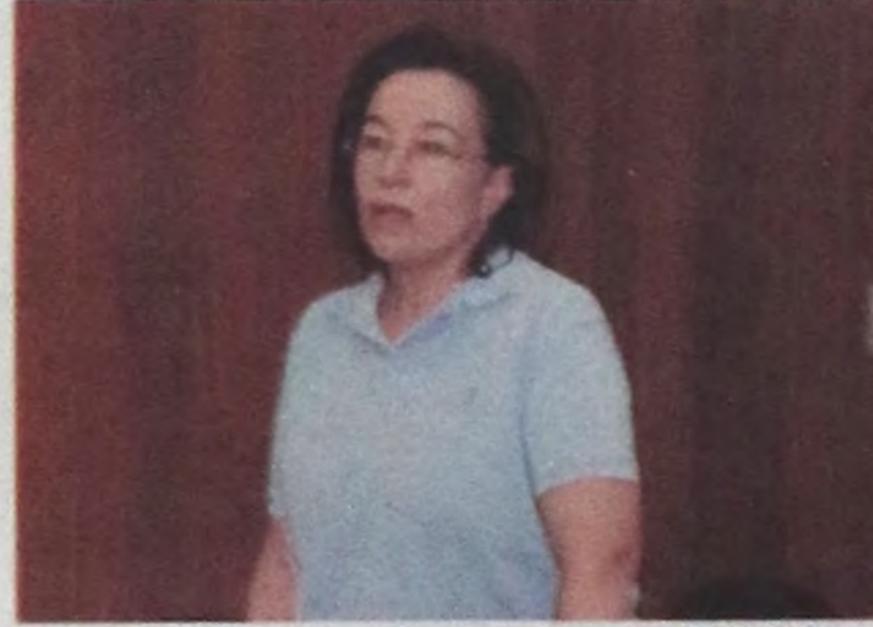
Izabel Cristina C. Lorenzetti (PSDB - Partido da Social Democracia Brasileira)