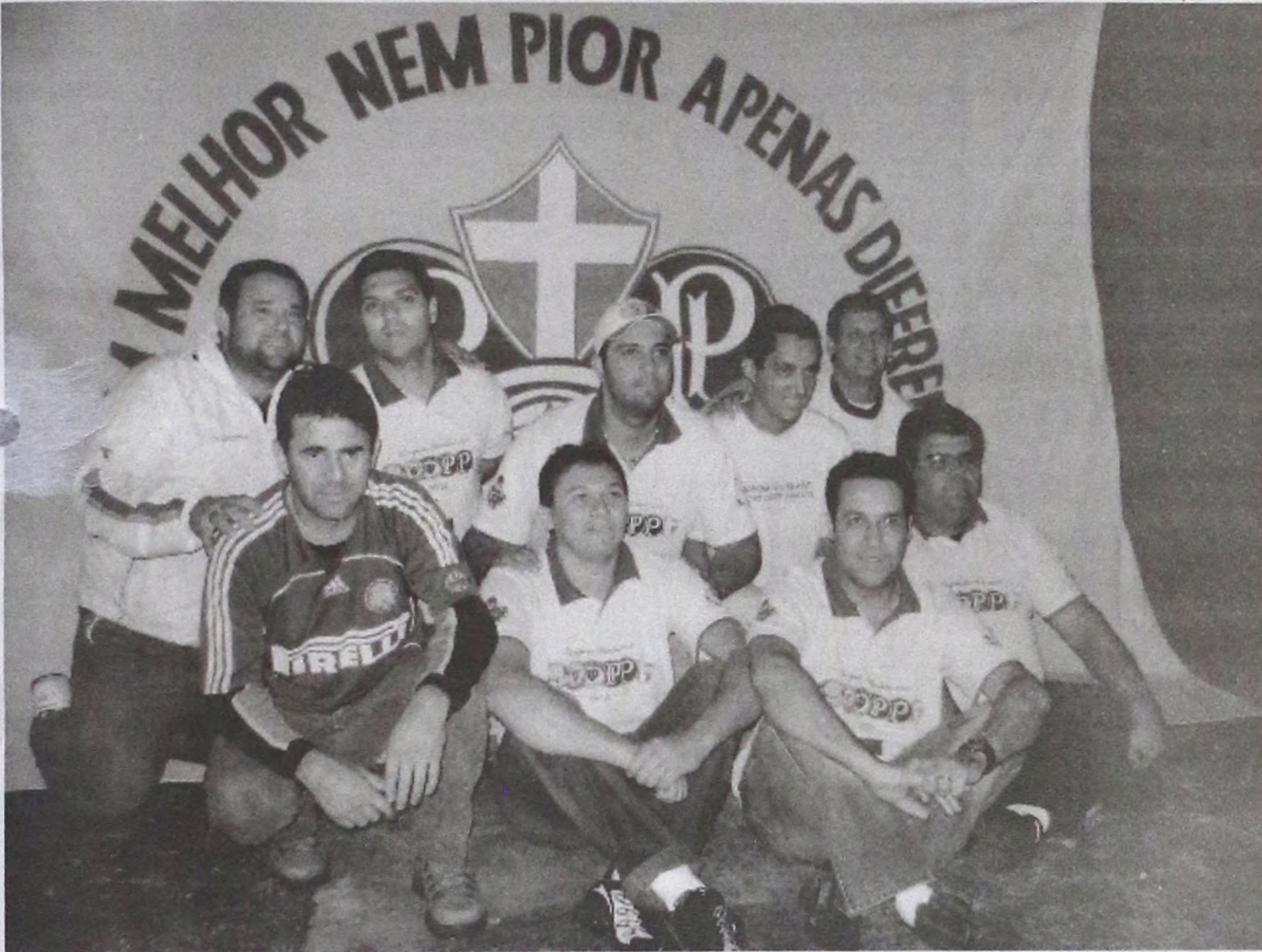
A comissão que organiza o tradicional almoço dos palmeirenses

Era começo dos anos 1970. Enquanto o Santos de Pelé deixava suas marcas na cena do futebol brasileiro e nossa seleção desfrutava da glória de seus primeiros títulos mundiais, a Sociedade Esportiva Palmeiras vivia alguns dos momentos mais importantes de sua história. História que Lençóis Paulista acompanha de perto.