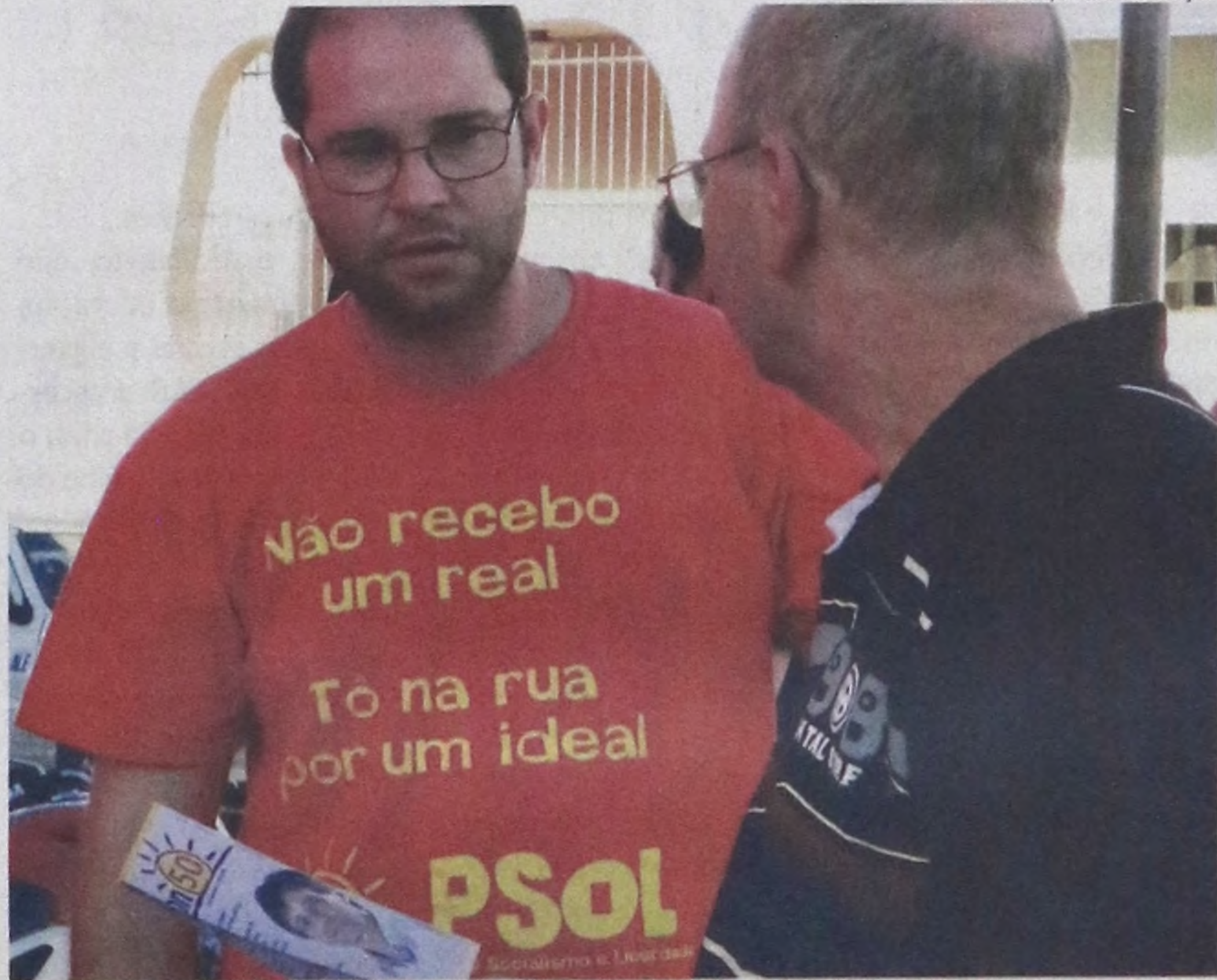
Edson Correia/Notícias de Lençóis