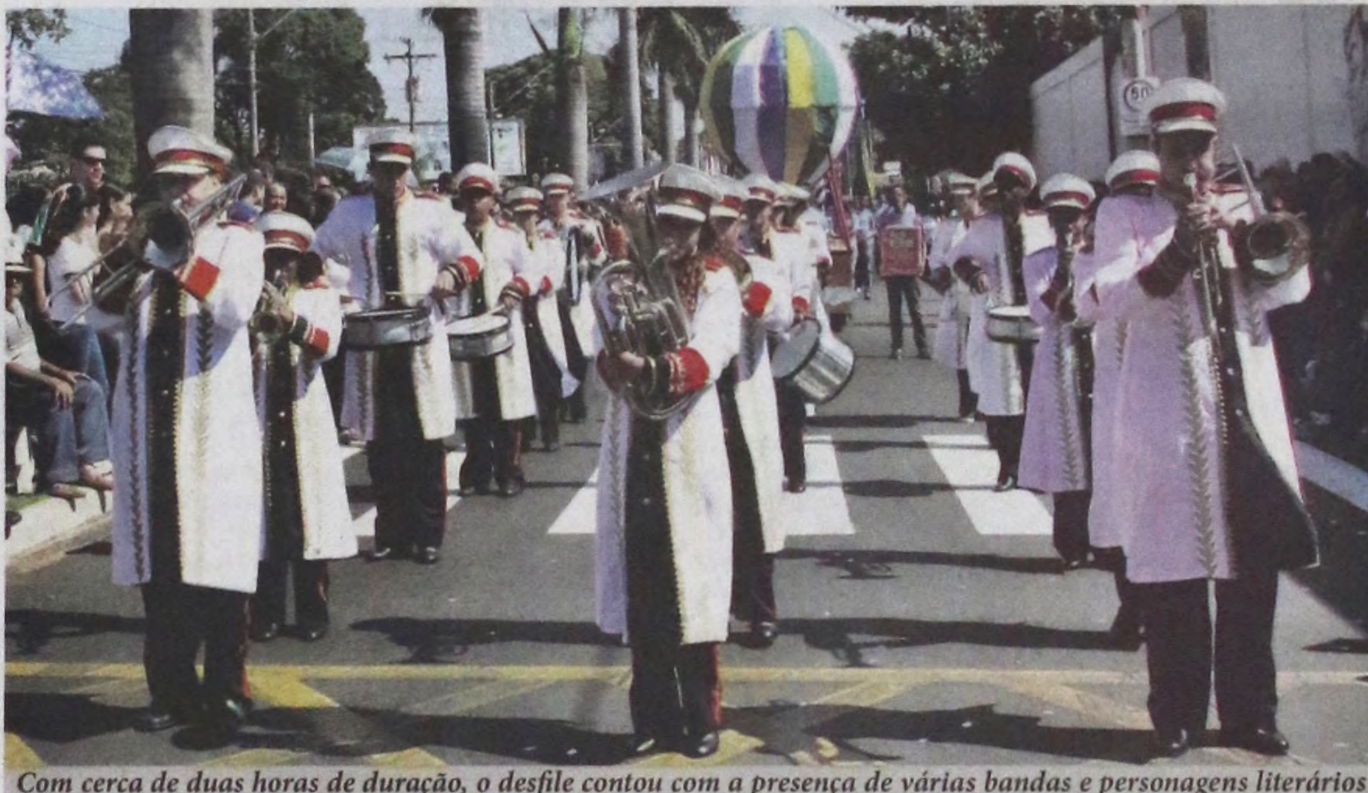
Com cerca de duas horas de duração, o desfile contou com a presença de várias bandas e personagens literários

O Notícias traz uma coluna especial com os flashes dessa comemoração. Pág. 04