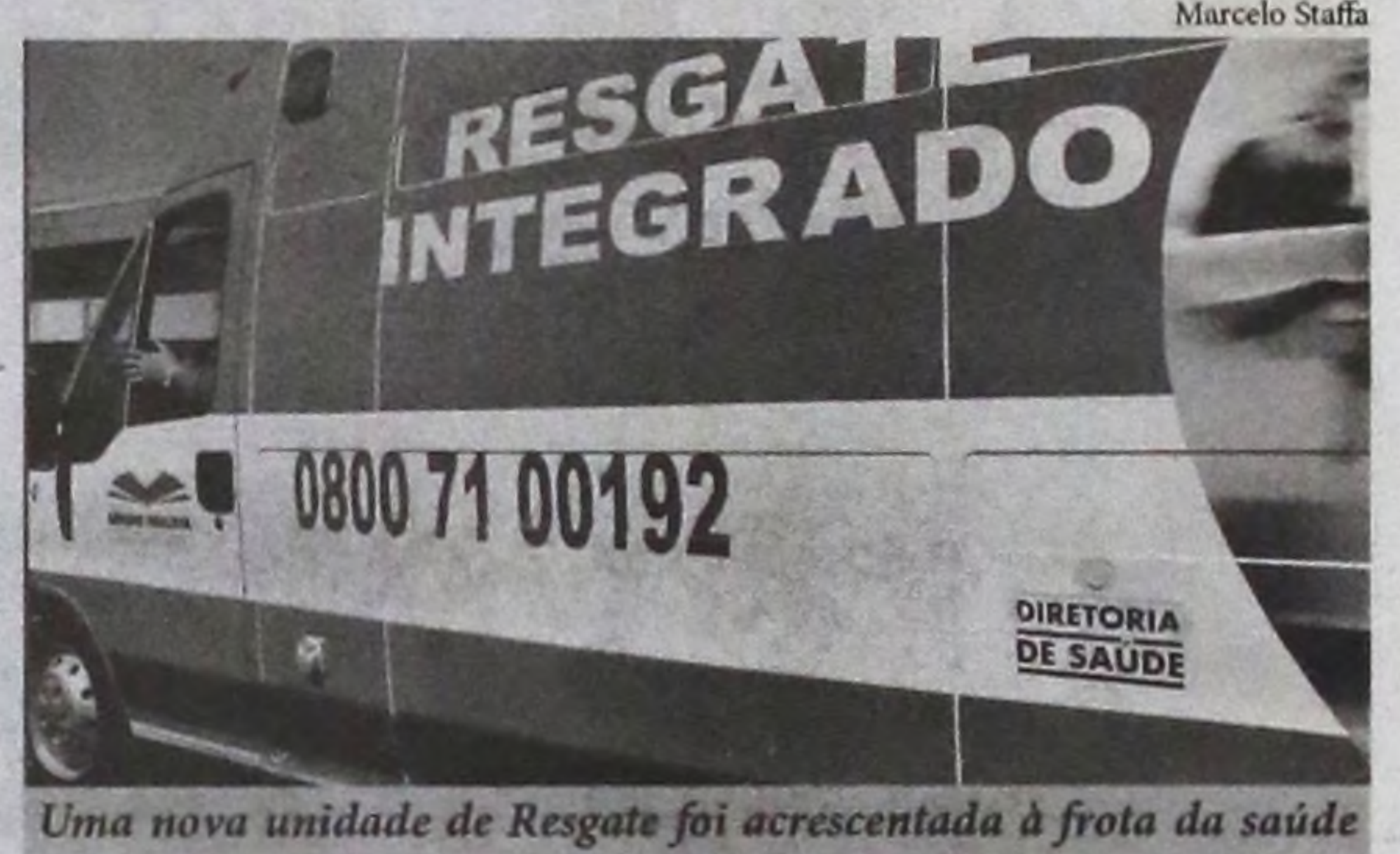
Uma nova unidade de Resgate foi acrescentada à frota da saúde