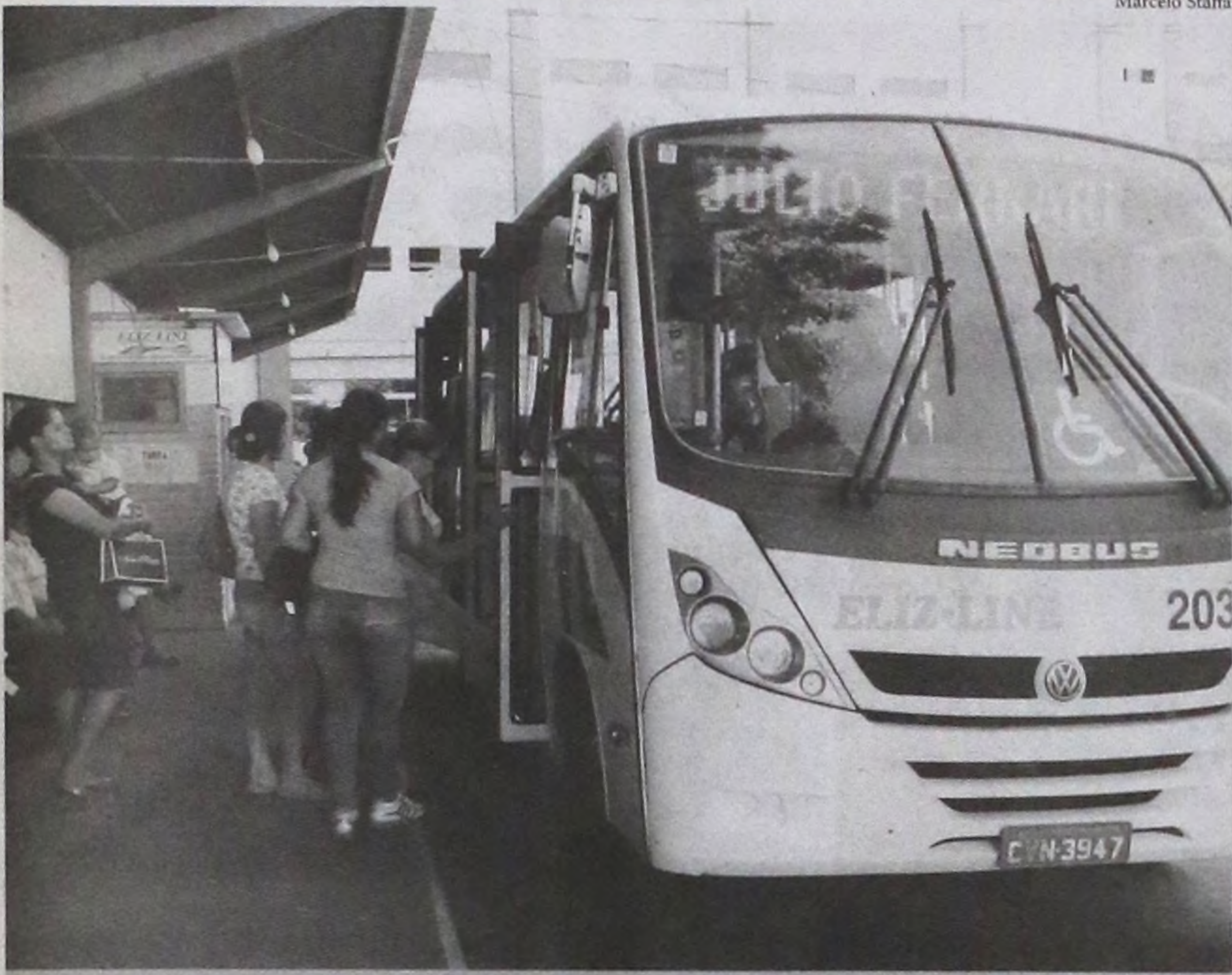
Usuários embarcam em circular que já tiveram os valores de passagens reajustados