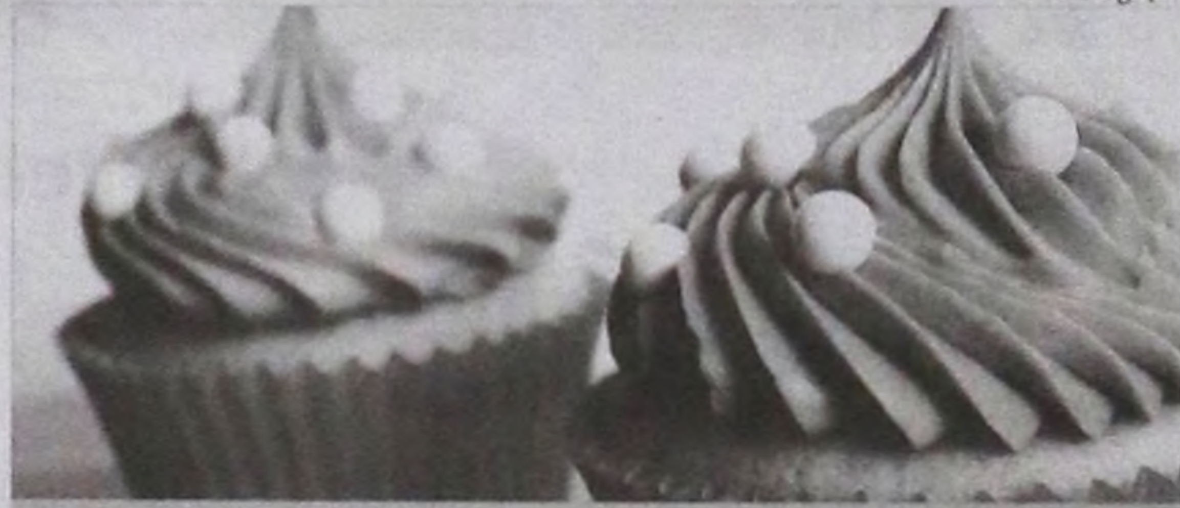
A guloseima que será produzida pela Casa Abrigo Amorada

Solidariedade em forma de doces. É com esta estratégia que a direção da Casa Abrigo Amorada - instituição voltada a atender adolescentes e mulheres vítimas de violência doméstica -, em Lençóis, pretende angariar fundos destinados à estruturação de duas novas unidades de atendimento. Para isso, a entidade, que participará dos dez dias de festas da Facilpa, solicita às pessoas e empresas, doações de ingredientes utilizados na produção de cupcakes, pães de mel e chocolates, que serão vendidos durante o evento. A confec-