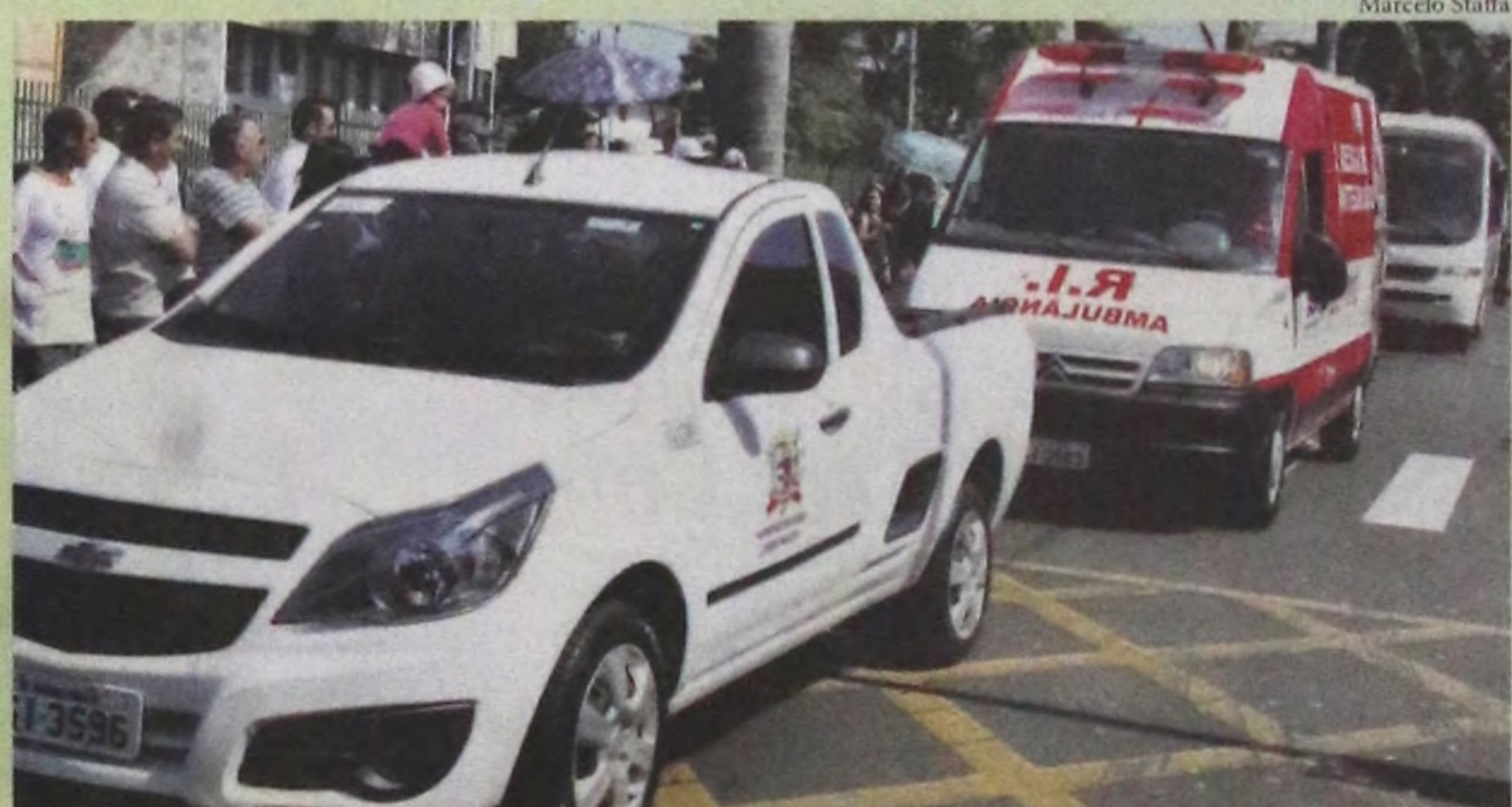
Seis novos veículos também foram apresentados durante o desfile de aniversário

A Prefeitura de Lençóis Paulista apresentou à cidade seus novos veículos que deverão atender de maneira exclusiva as necessidades do município. Os veículos foram exibidos no último dia 26 e são destinados às diretorias de Saúde e Meio Ambiente. A população de Lençóis Paulista contará com uma frota de seis novos veículos, sendo uma ambulância, um micro ônibus semi-novo, um utilitário, uma Van, um veículo adaptado para ambulância e um sedã compacto. Pág. 03