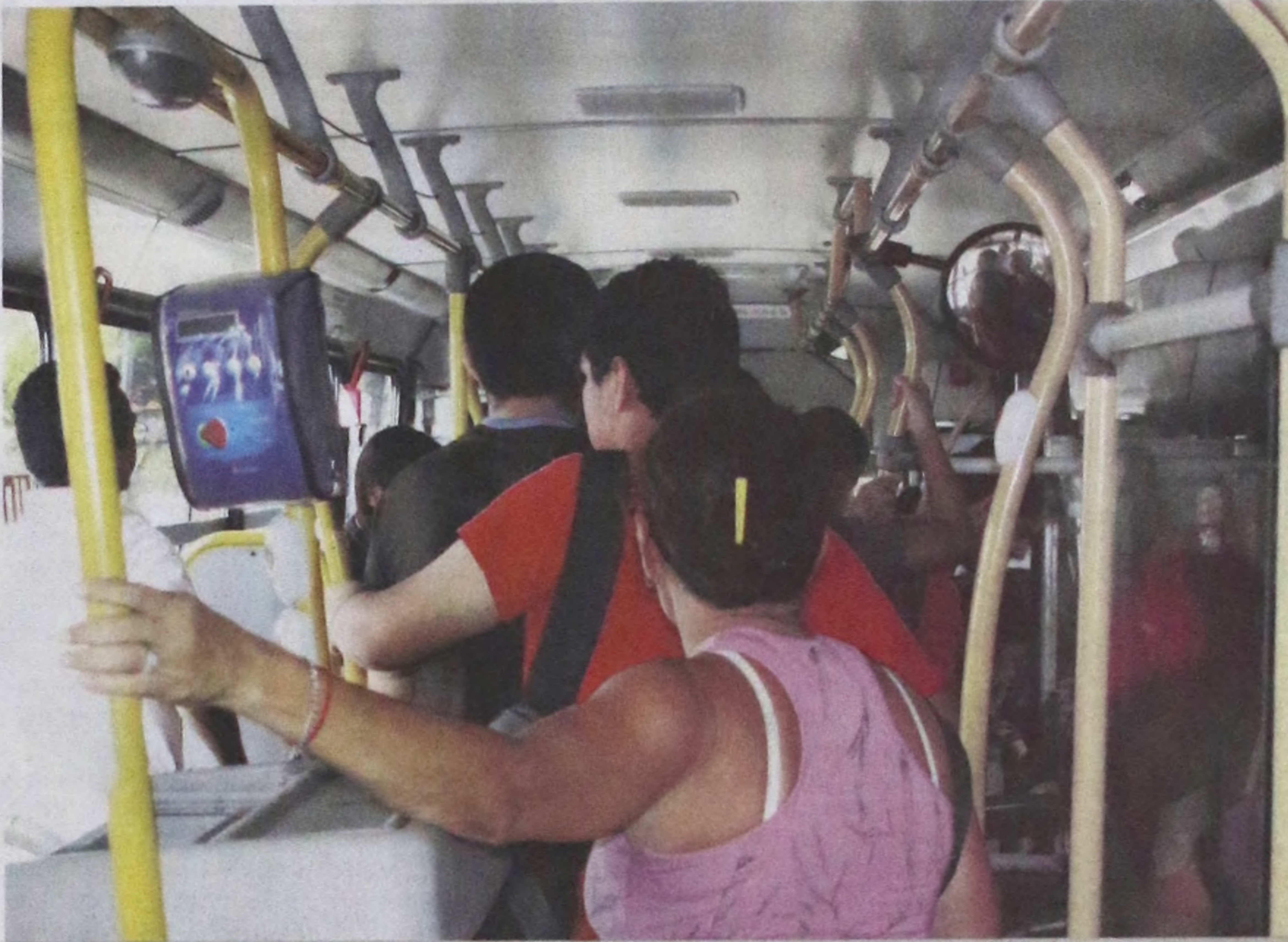
Usuários de transporte coletivo reclamam que aumento vai pesar de maneira considerável nos gastos mensais