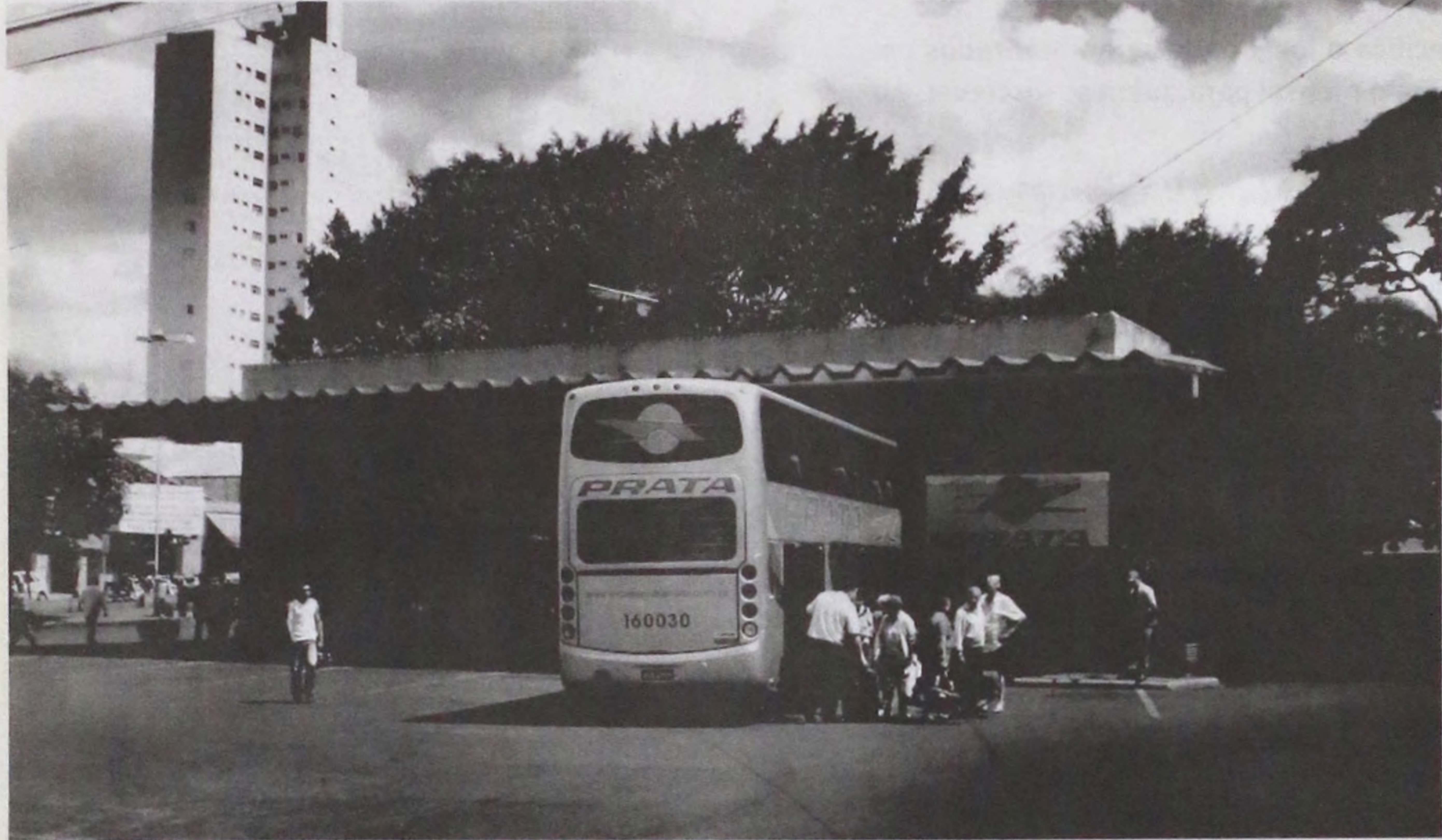
A exigência é de que todos os municípios brasileiros com mais de 20 mil habitantes elaborem seus planos de mobilidade urbana

A lei, que entra em vigor dentro de três meses, exige que todos os municípios do país com mais de 20 mil habitantes criem planos de mobilidade com metas de curto, médio e longo prazo. Um dos objetivos