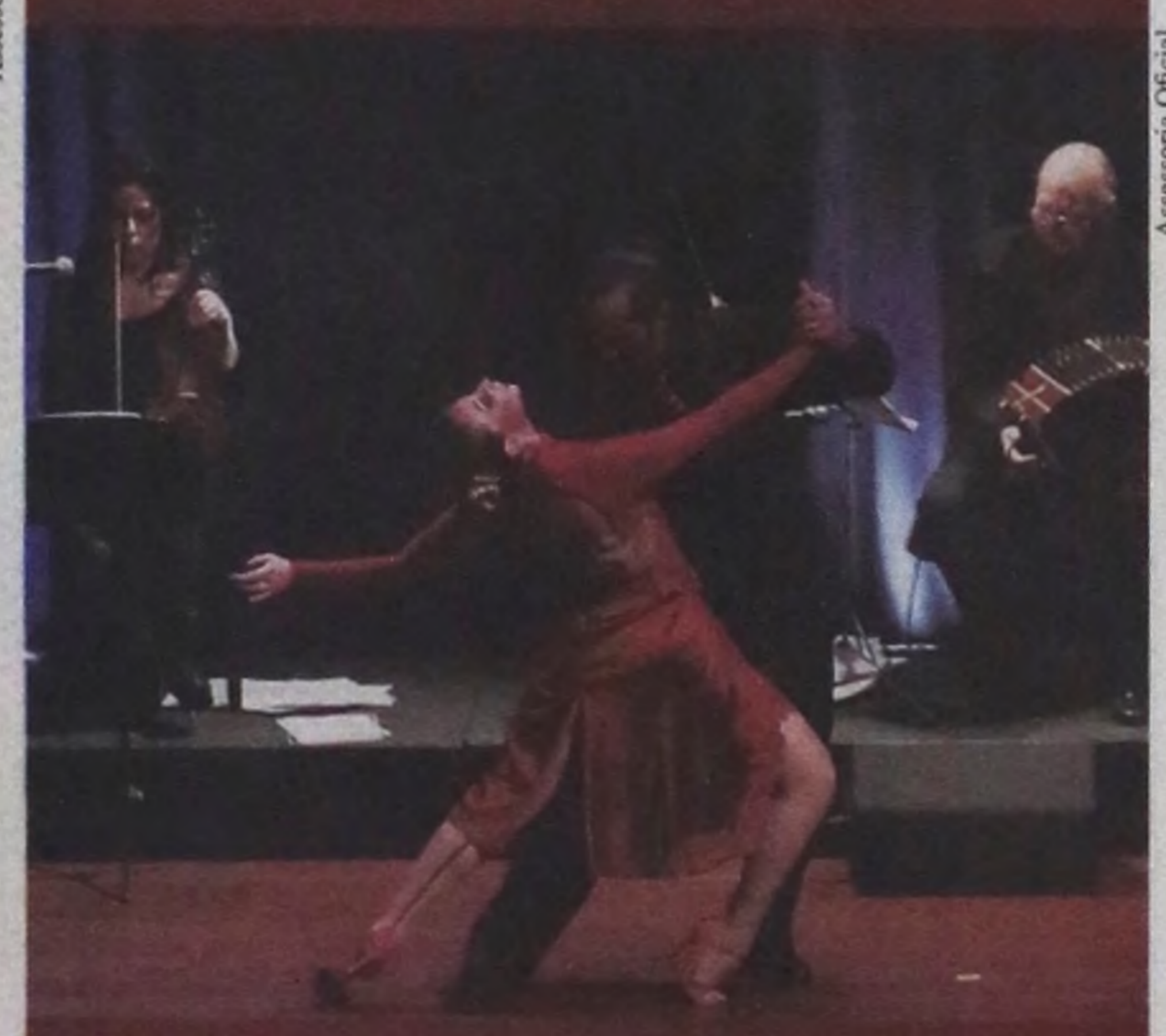
Espectáculo traz o melhor do tango para Botucatu e região Pág. 05