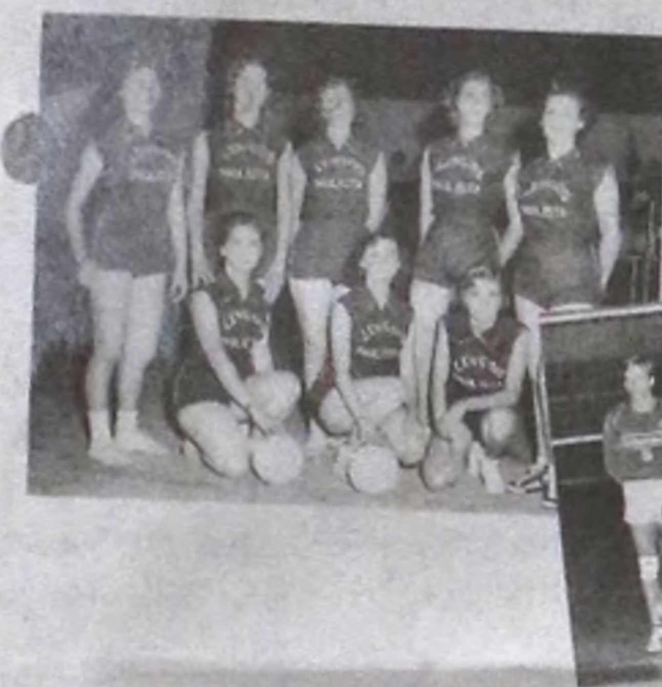
Grandes equipes de voleibol já foram formadas na cidade

"Podemos afirmar que mesmo com todos os avanços tecnológicos e transformações da sociedade moderna, o voleibol sempre teve, tem e terá fundamental papel na vida dos lençoenses, principalmente dos atletas, nascidos ou não aqui, que como no passado foram atraídos para a prática da modalidade, com mais de 75 anos de existência na comunidade, revelando talentos e, se dúvidas, melhorando a qualidade de vida de todos os integrantes da família do voleibol de Lençóis Paulista", finaliza Dodô.