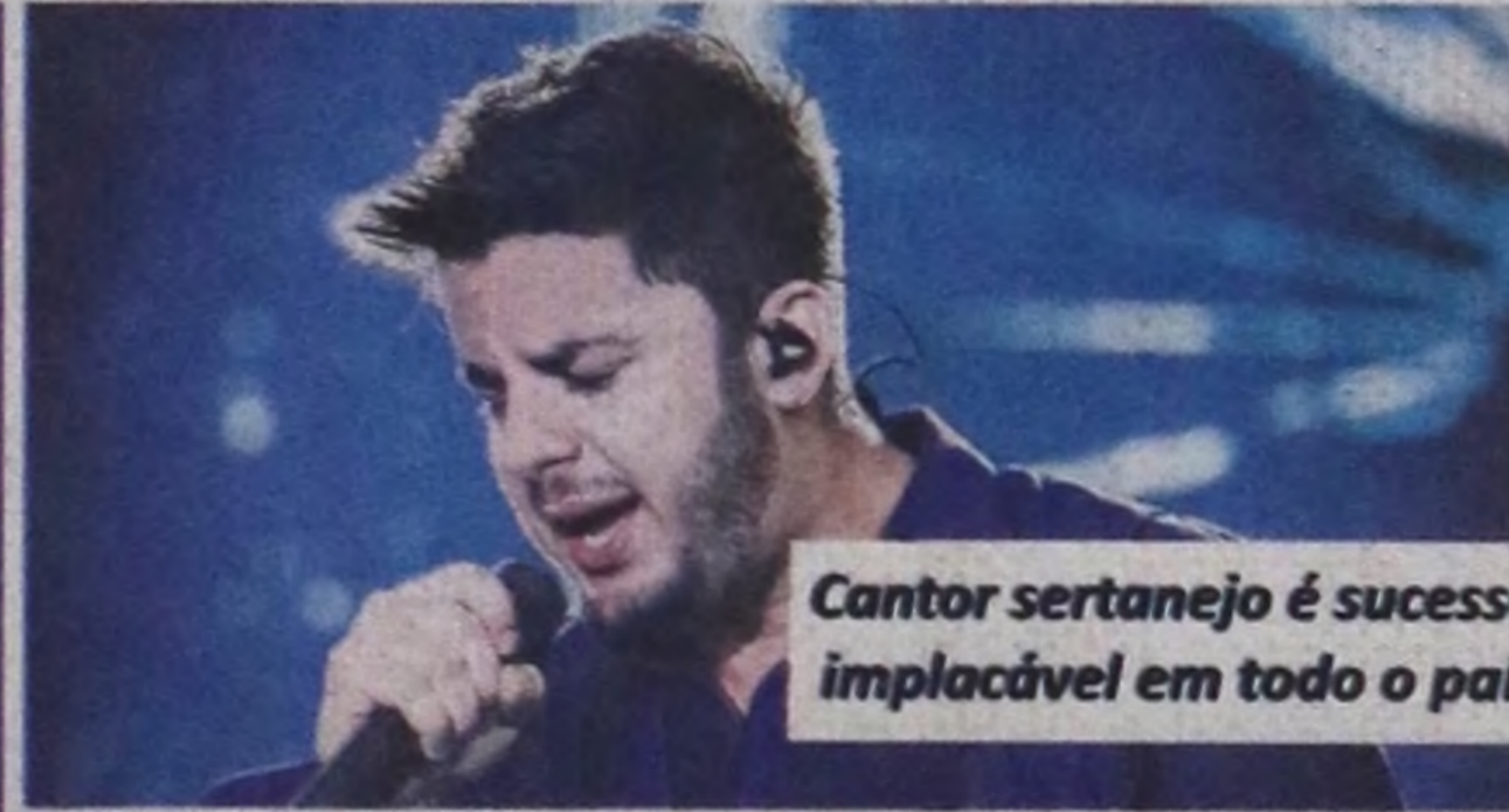
Cantor sertanejo é sucesso implacável em todo o país

O Notícias de Lençóis conversou com o cantor para saber como estão os preparativos para a maior festa universitária da região. "Estou muito feliz, são