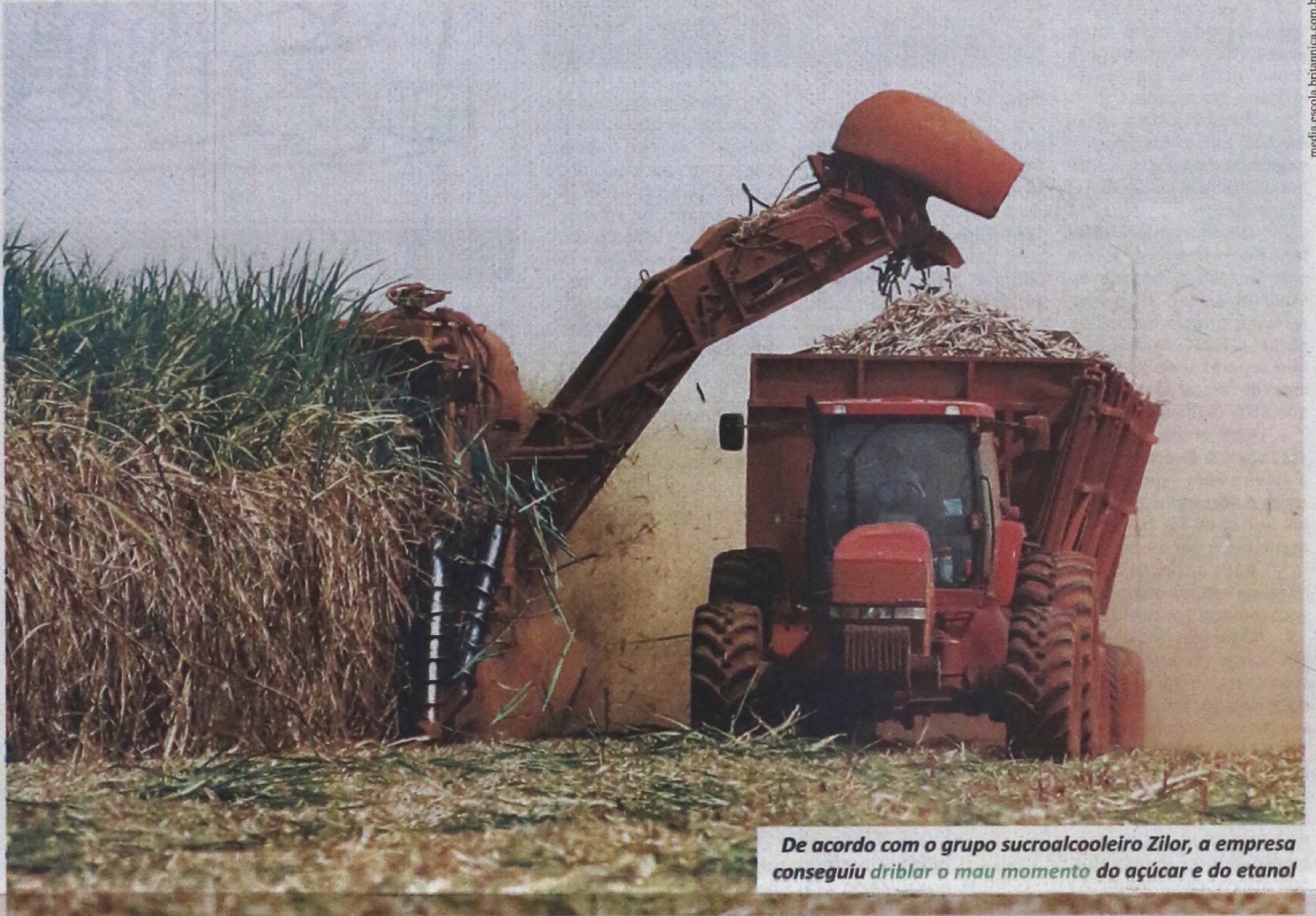
De acordo com o grupo sucroalcooleiro Zilor, a empresa conseguiu driblar o mau momento do açúcar e do etanol