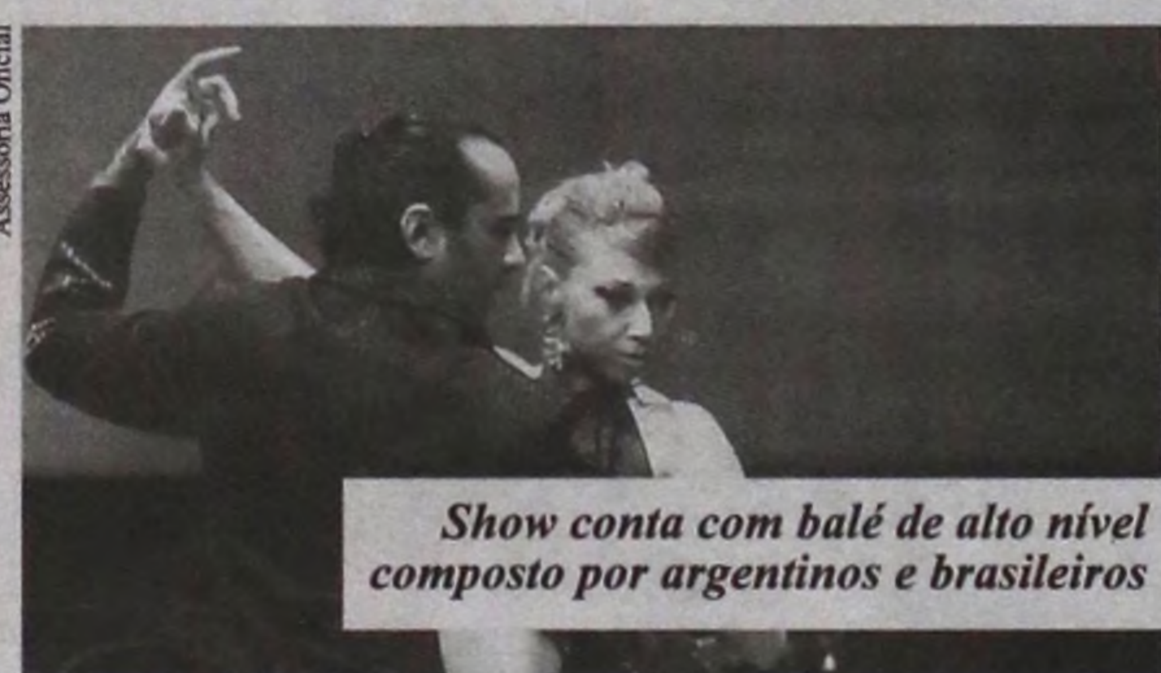
Show conta com balé de alto nível composto por argentinos e brasileiros

o resultado de um ano de pesquisa a respeito da paixão que os brasileiros têm pelo tango. Com o objetivo de desenvolver um projeto multicultural entre Brasil e Argentina, visamos evidenciar a forte ligação com este