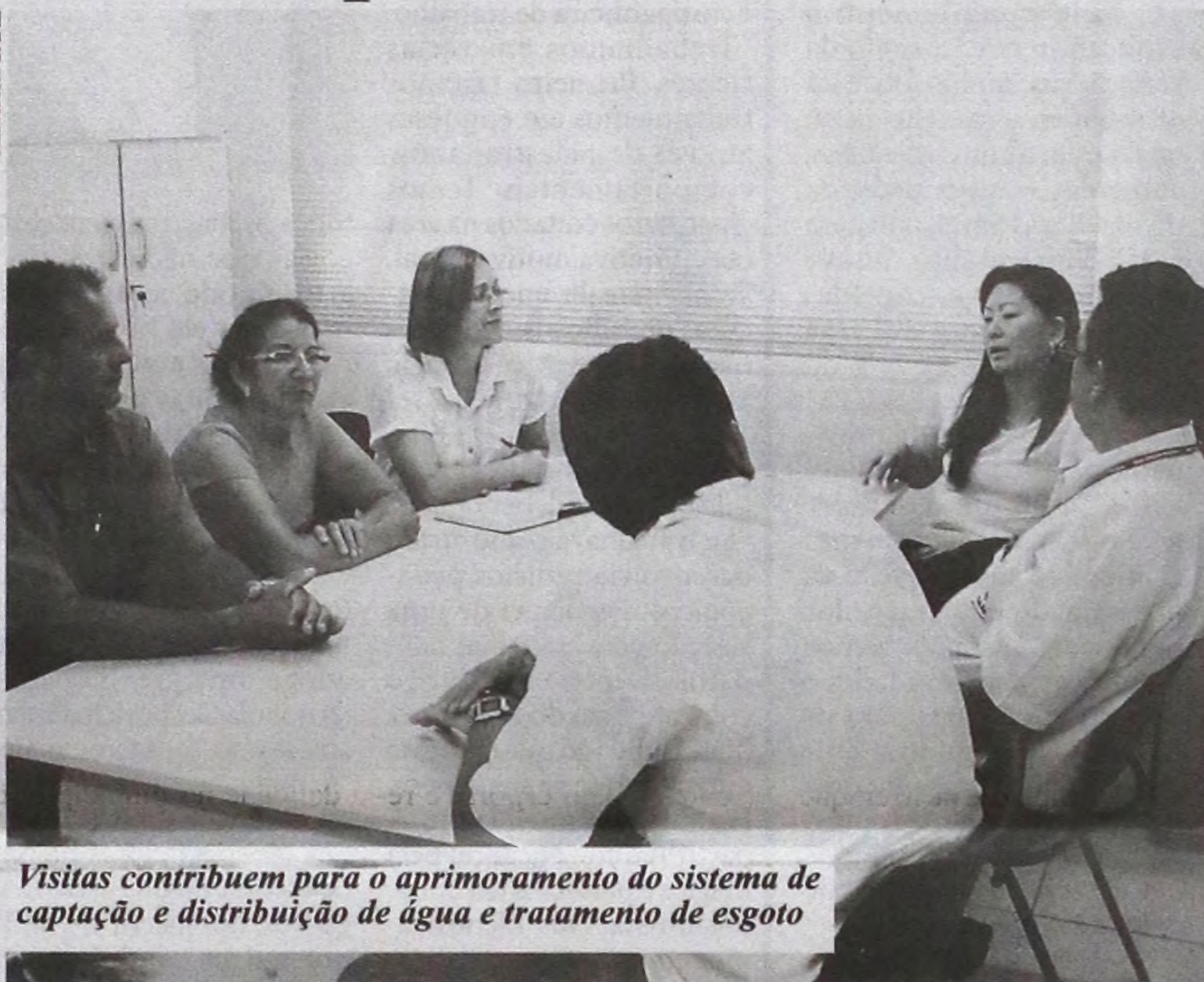
Visitas contribuem para o aprimoramento do sistema de captação e distribuição de água e tratamento de esgoto

"Eu e minha equipe viemos trocar experiências com o SAAE de Lençóis, principalmente na manutenção da rede. Buscamos verificar como funcionam os procedimentos para atender a demanda de vazamentos, ligações e entupimento", destaca a diretora-presidente do DAEP.