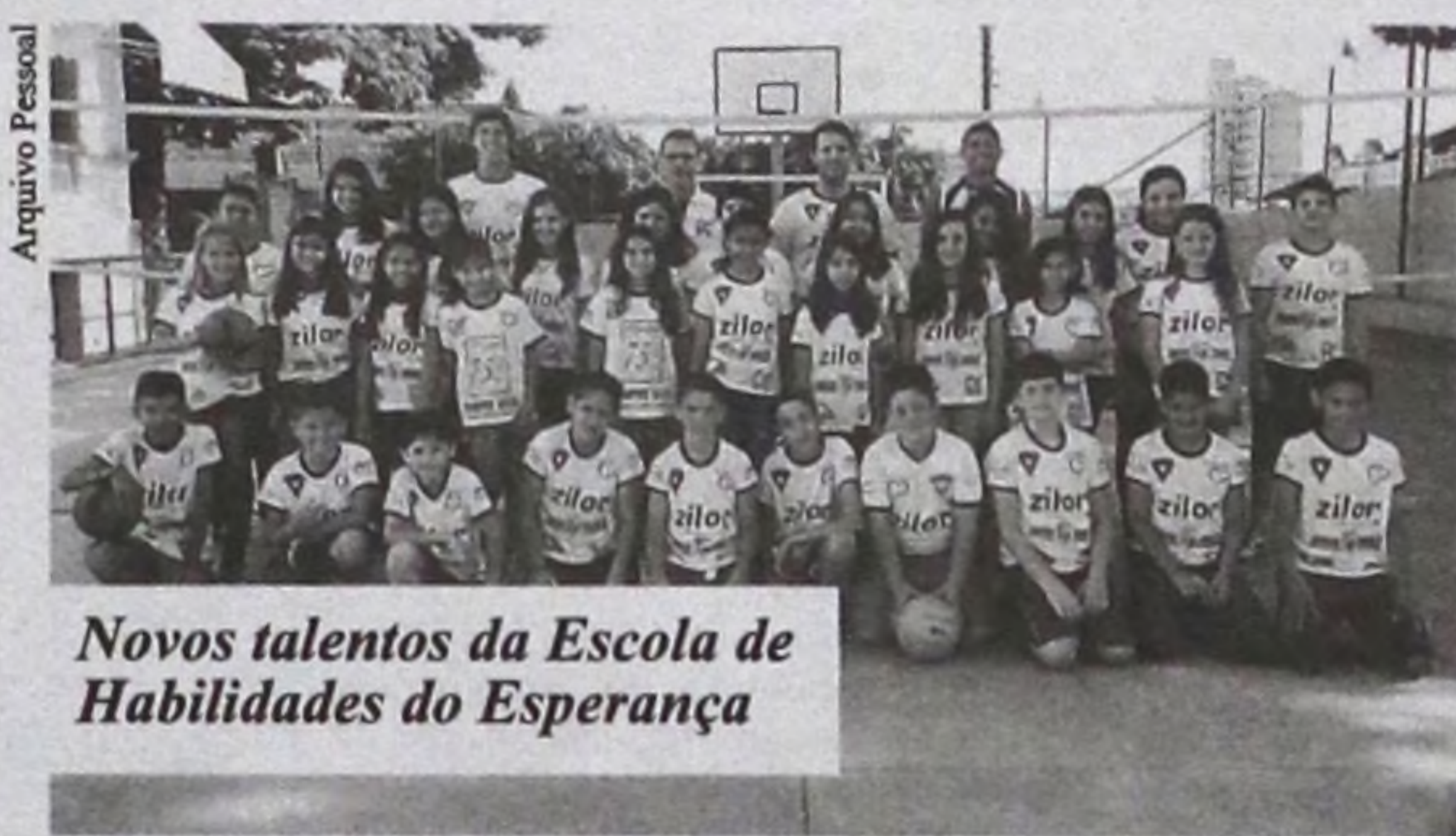
Novos talentos da Escola de Habilidades do Voleibol

Entre as etapas gerenciadas pela AAVLP estão: Escolas de Habilidades do Voleibol, que inicia de forma lúdica a execução das habilidades da modalidade com crianças do quinto ano escolar; Escolas de Voleibol, que dão oportunidades para jovens entre 10 e 16 anos de desenvolver e aprimorar os fundamentos básicos da modalidade e suas noções técnicas; Equipes de Voleibol, que dão continuidade ao processo educativo pelo voleibol, respeitando o progresso individual e aperfeiçoando o coletivo dos atletas envolvidos nas competições oficiais ou não; Clube Master, que reúne um público específico, com atletas de 25 a 60