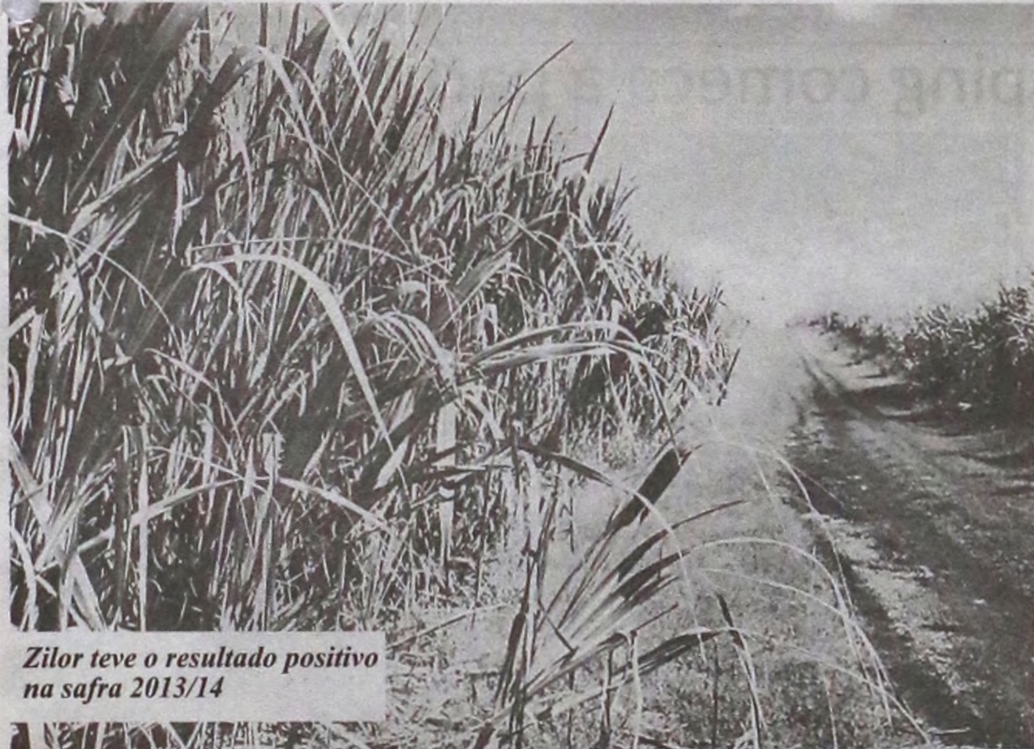
Zilor teve o resultado positivo na safra 2013/14

"Nosso show de mágica é um espetáculo único com mais de 30 mega números. Buscamos quebrar paradigmas. E são momentos assim que nos dão força para continuar. Felicidade não é um estado, é um momento. Ninguém pode ser feliz todos os dias em todos os momentos. A felicidade é a soma de nossos momentos felizes. E por isso, temos que aproveitar e procurar ampliar ao máximo cada momento de felicidade em nossa vida", finaliza Átila.