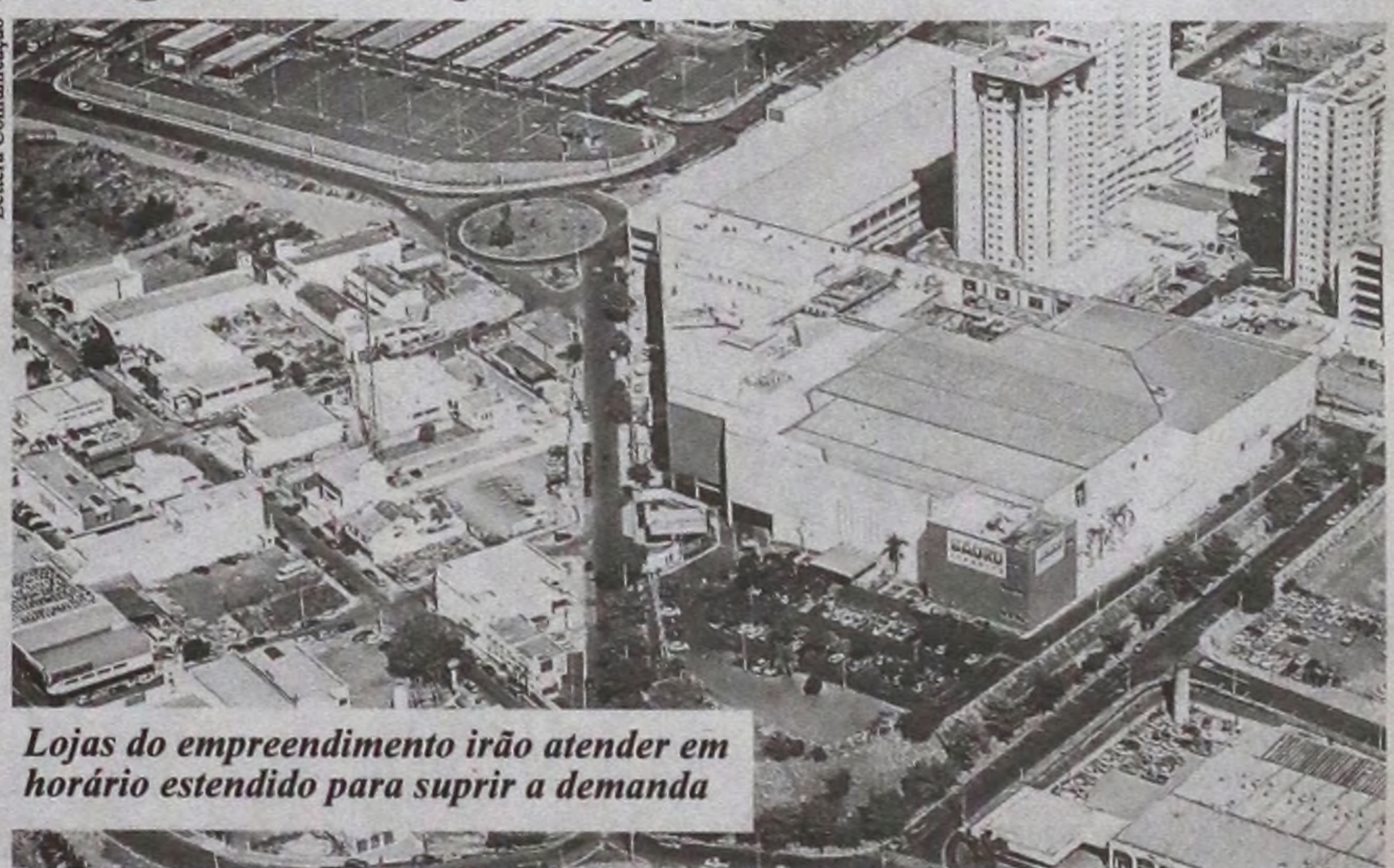
Lojas do empreendimento irão atender em horário estendido para suprir a demanda

Os ganhadores serão conhecidos no dia 12 de janeiro, às 17 horas, quando será feito o sorteio.