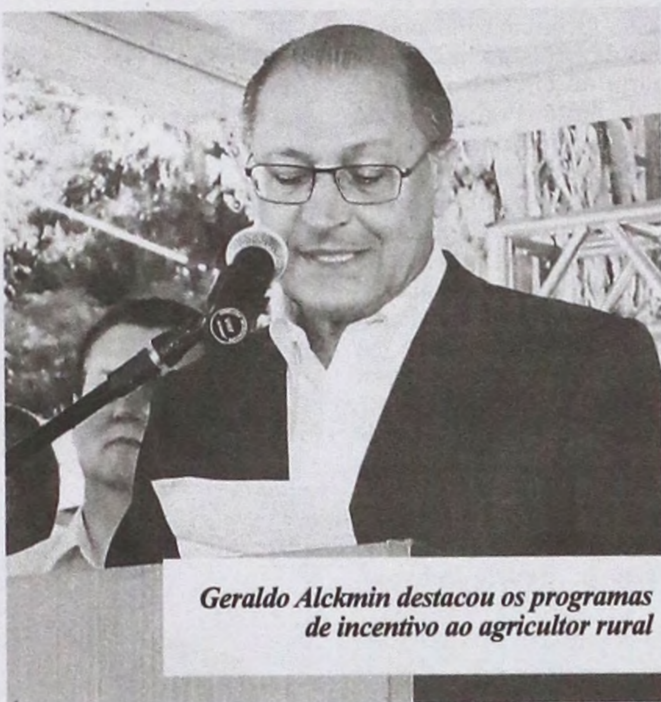
Geraldo Alckmin destacou os programas de incentivo ao agricultor rural

Bel destacou a importância de receber um evento como a Agrifam na cidade. "A feira é um espaço importante para conhecermos e presenciarmos soluções a avanços tecnológicos disponíveis para aqueles que querem trabalhar com a agricultura familiar. Lençóis re-