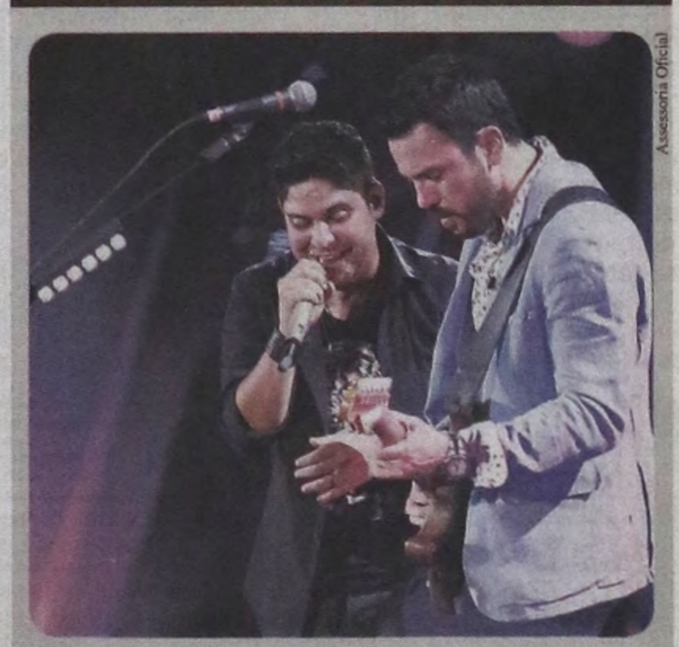
O sertanejo animado da dupla Jorge e Mateus Pág. 05