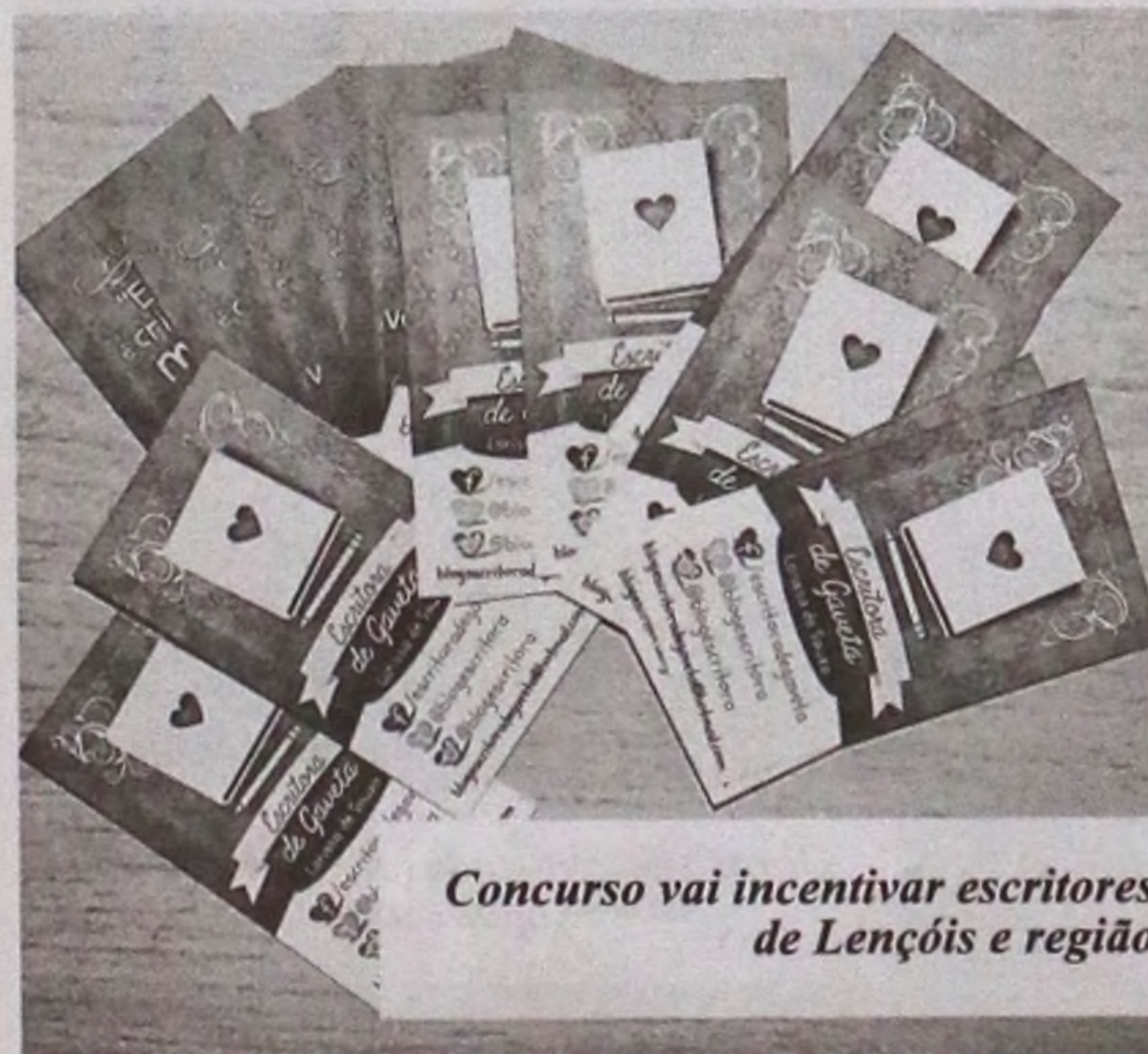
Concurso vai incentivar escritores de Lençóis e região