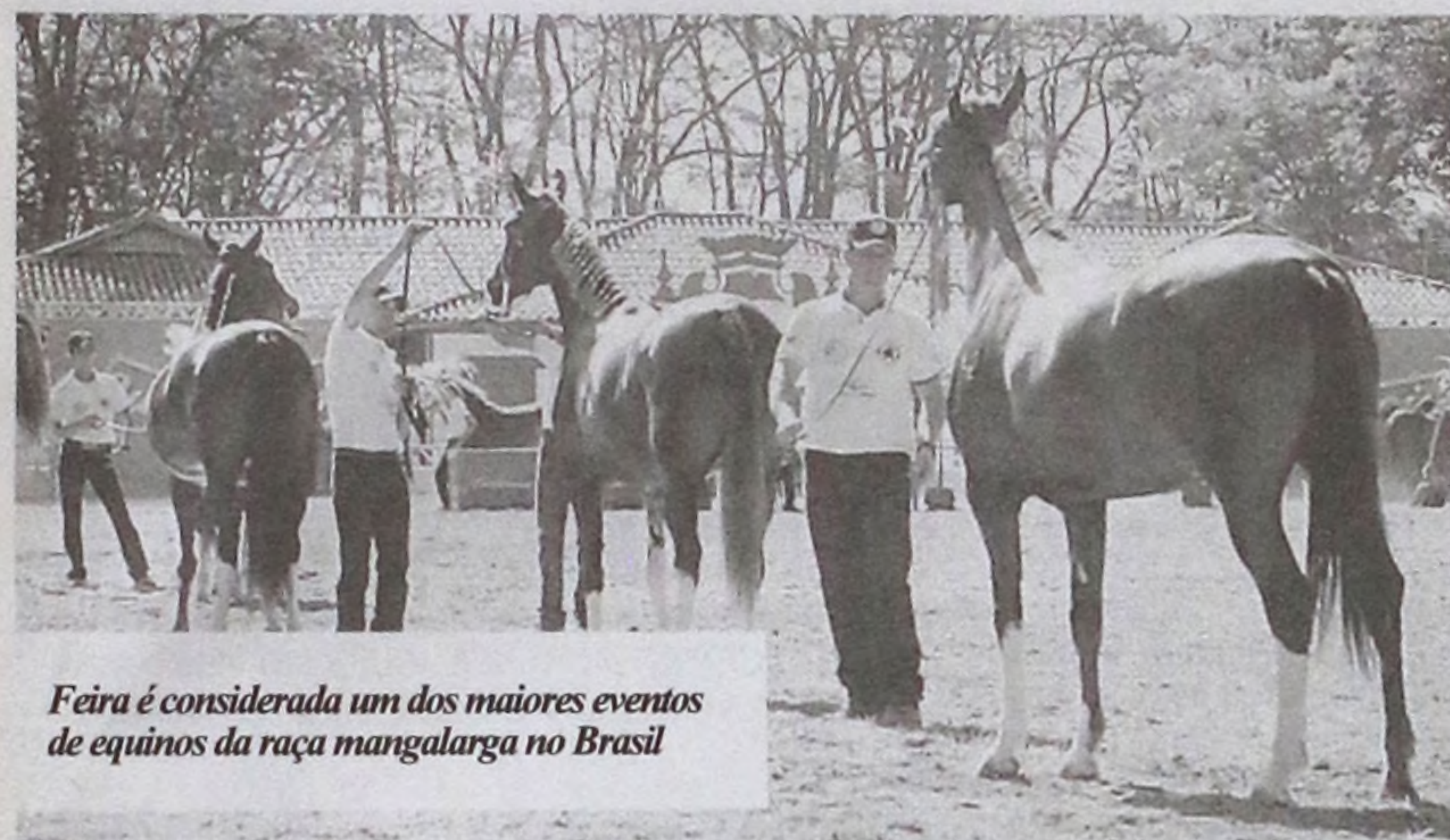
Feira é considerada um dos maiores eventos de equinos da raça mangalarga no Brasil