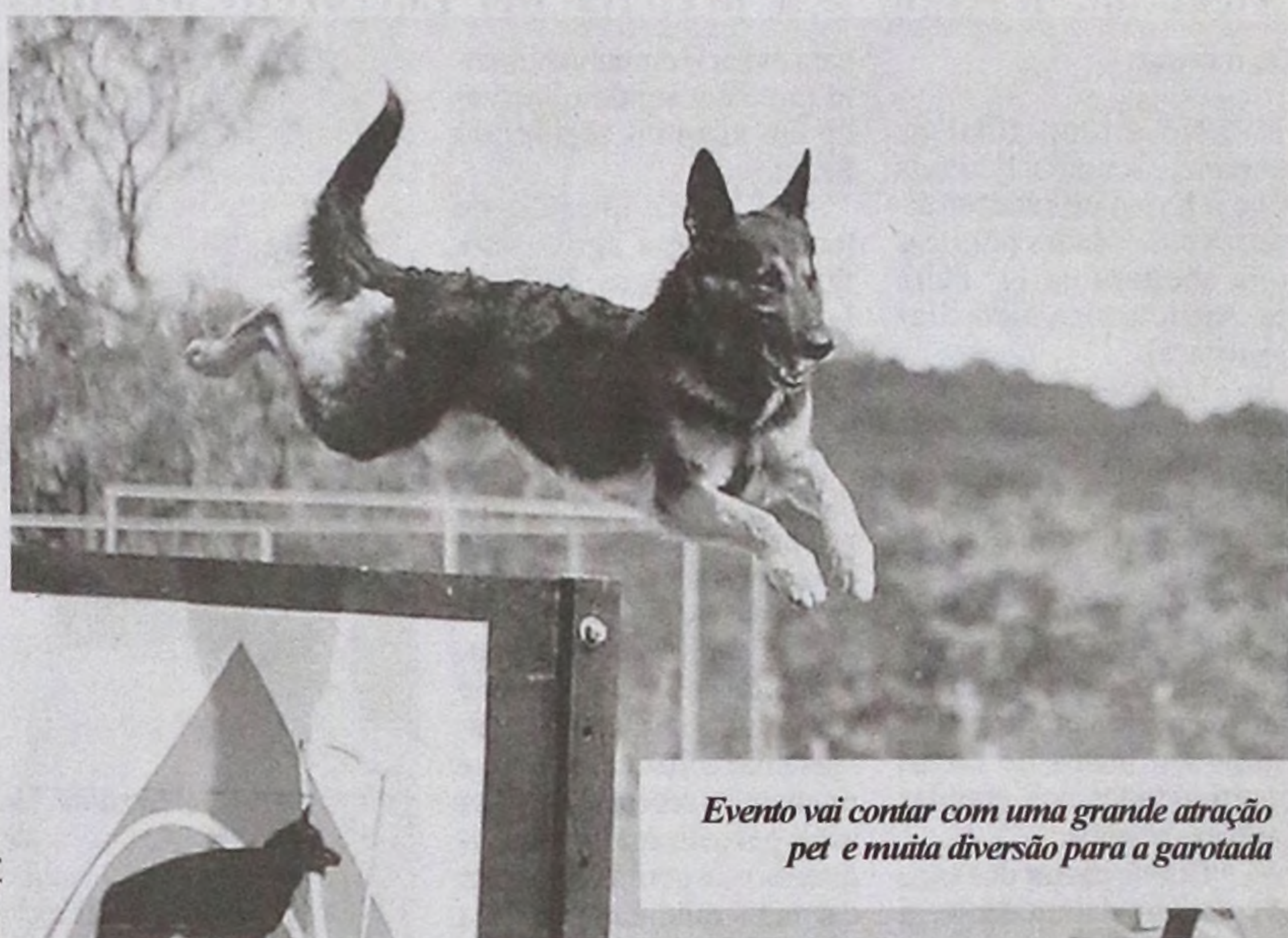
Evento vai contar com uma grande atração pet e muita diversão para a garotada

Um diferencial da Expojaú é a exposição e leilão de cavalos mangalarga. "A feira é considerada o maior evento da raça no Brasil, ficando atrás em número de participantes e animais apenas para a Exposição Nacional. Jaú é referência entre os conhecedores e amantes da raça", revela Fonseca.