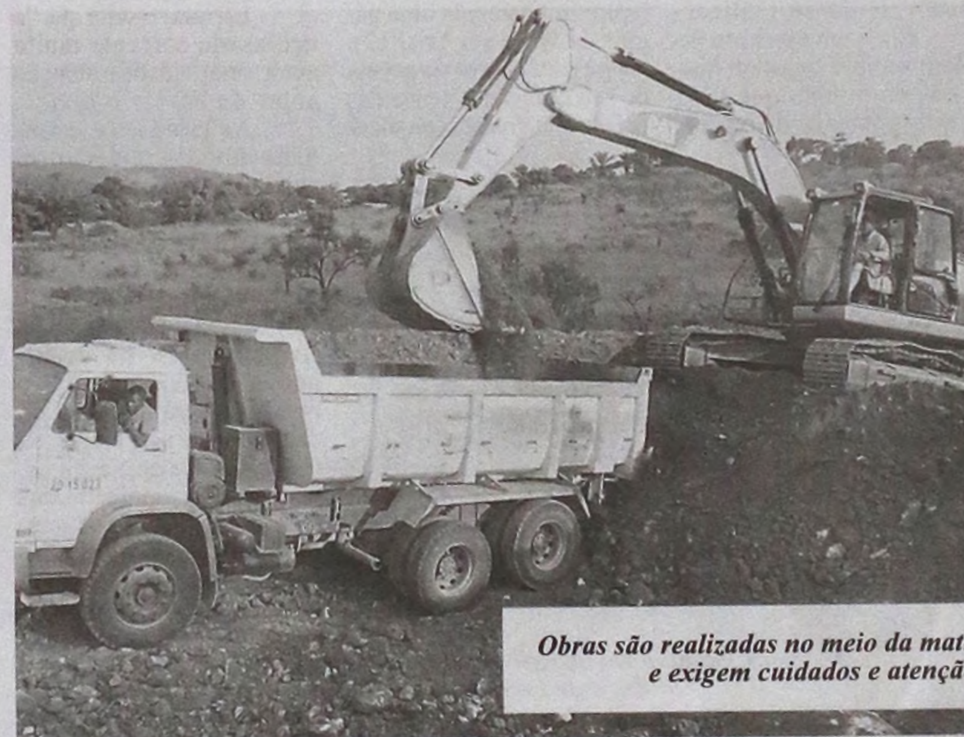
Obras são realizadas no meio da mata e exigem cuidados e atenção

Sua capacidade de produção é de 4,7 milhões de toneladas de papel e celulose por ano.