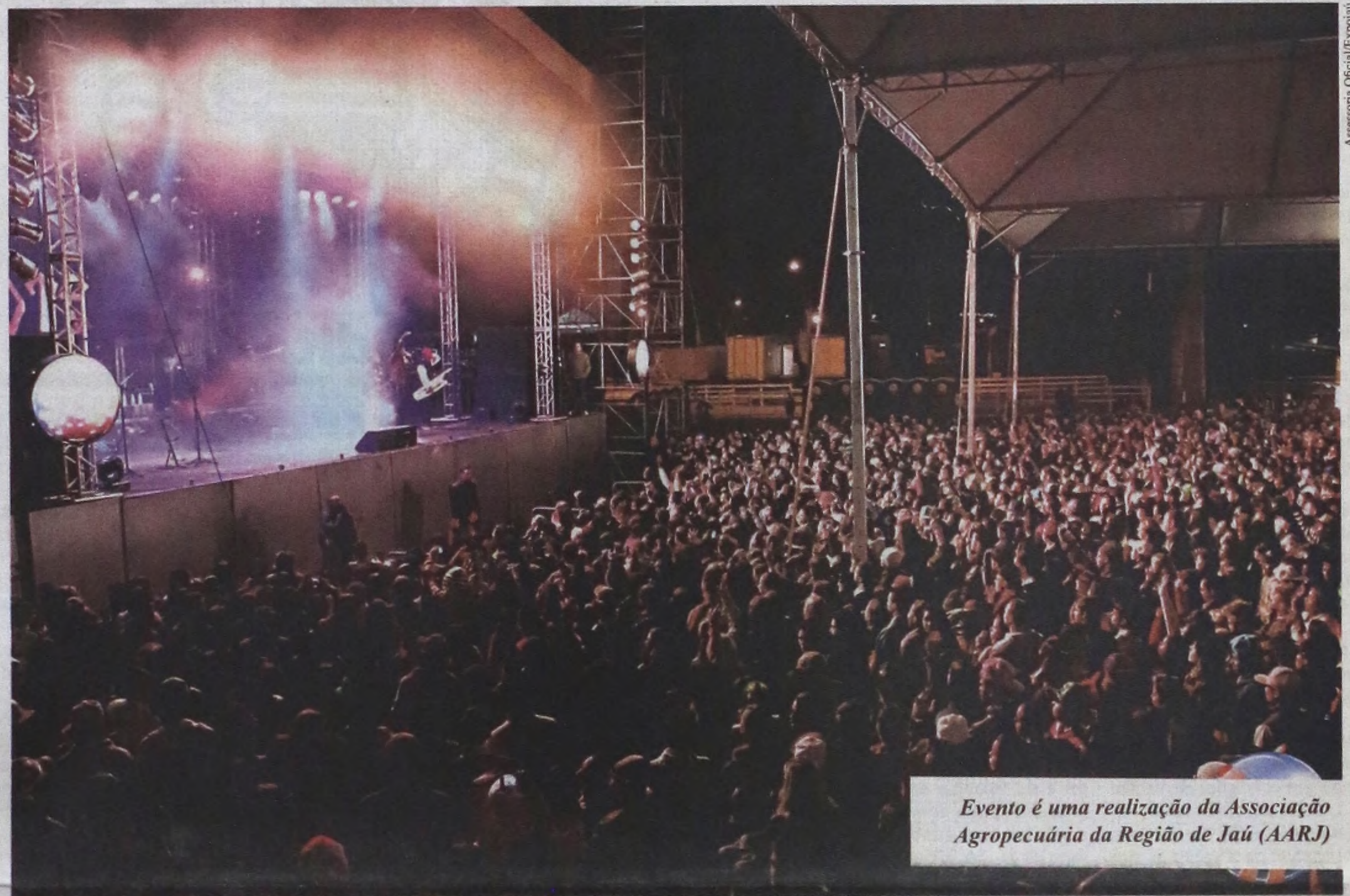
Evento é uma realização da Associação Agropecuária da Região de Jaú (AARJ)