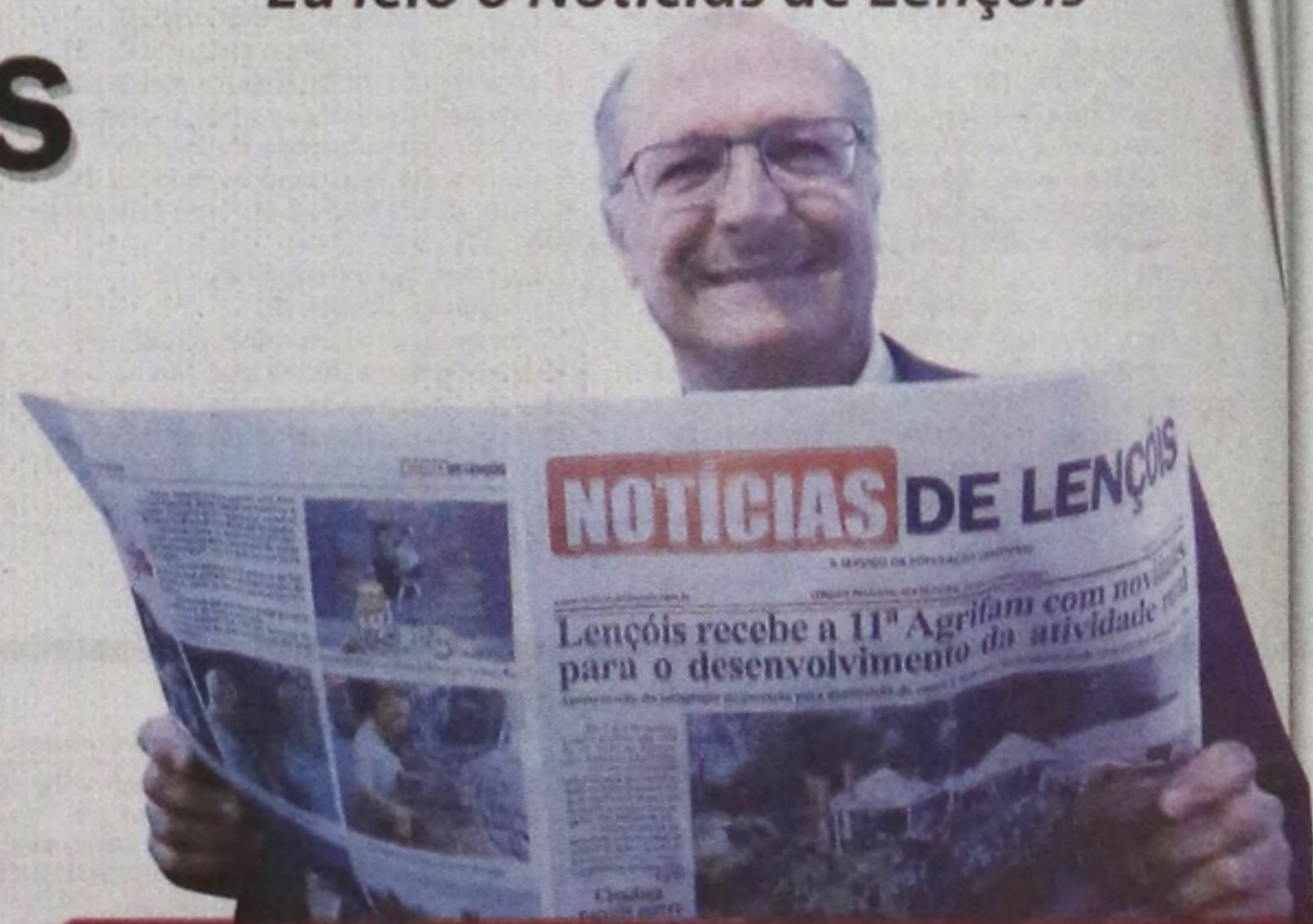
Geraldo Alckmin Governador