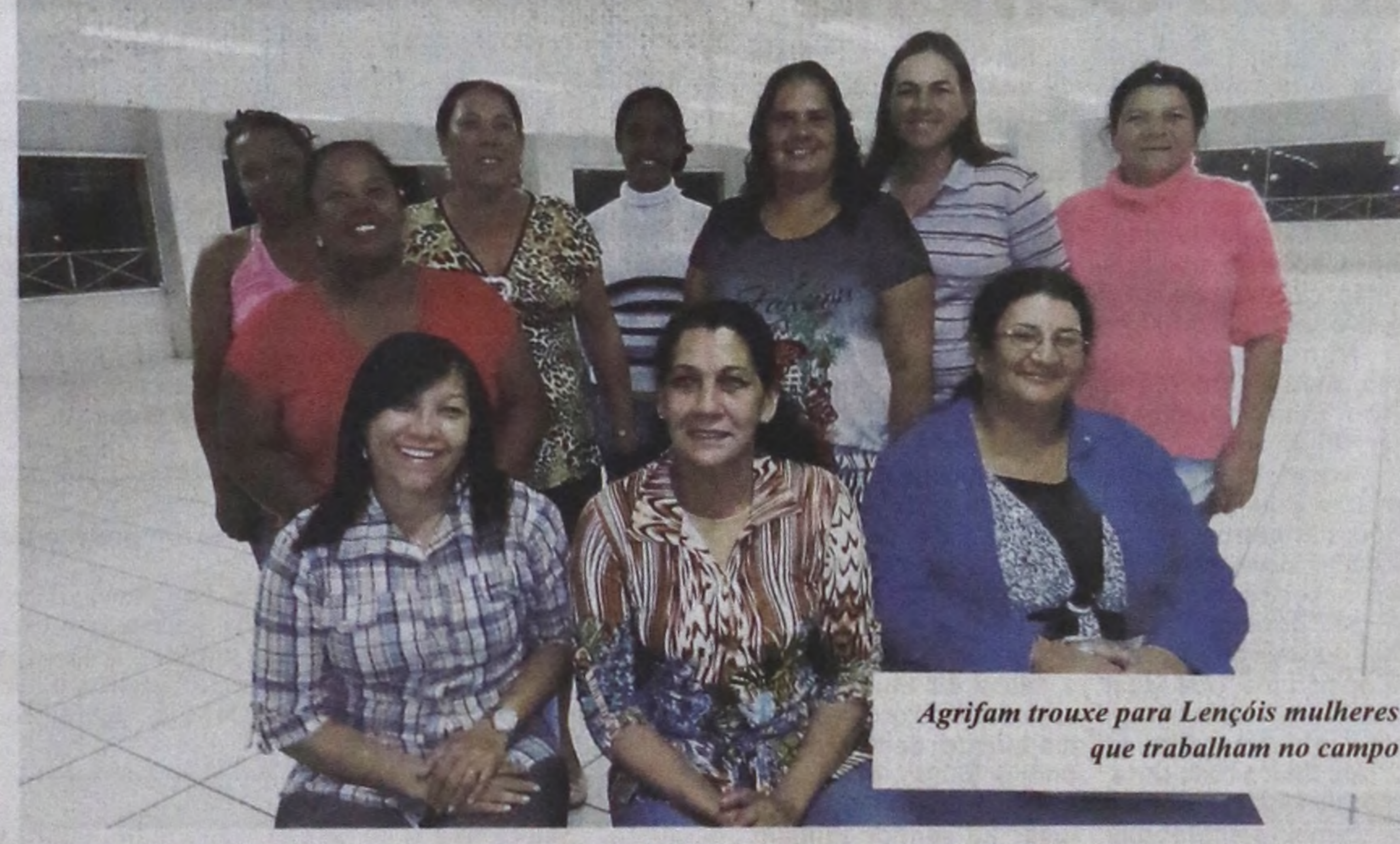
Agrifam trouxe para Lençóis mulheres que trabalham no campo

No último final de semana, Lençóis Paulista teve a honra de receber diversas autoridades políticas para abertura da 11ª Agrifam, evento que marcou o Ano Internacional da Agricultura Familiar.