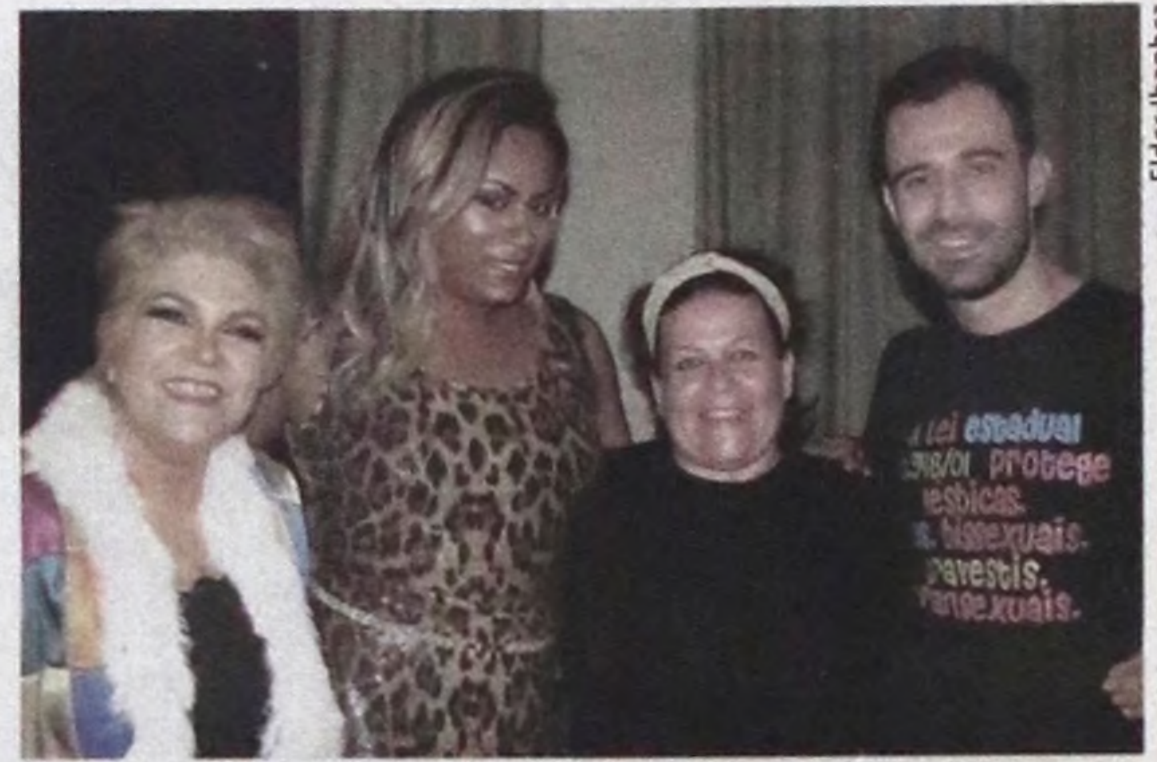
Elenco foi recebido pelo público com muito carinho

Muitas felicidades para todas as mães lençoenses que são verdadeiras lutadoras e guerreiras.