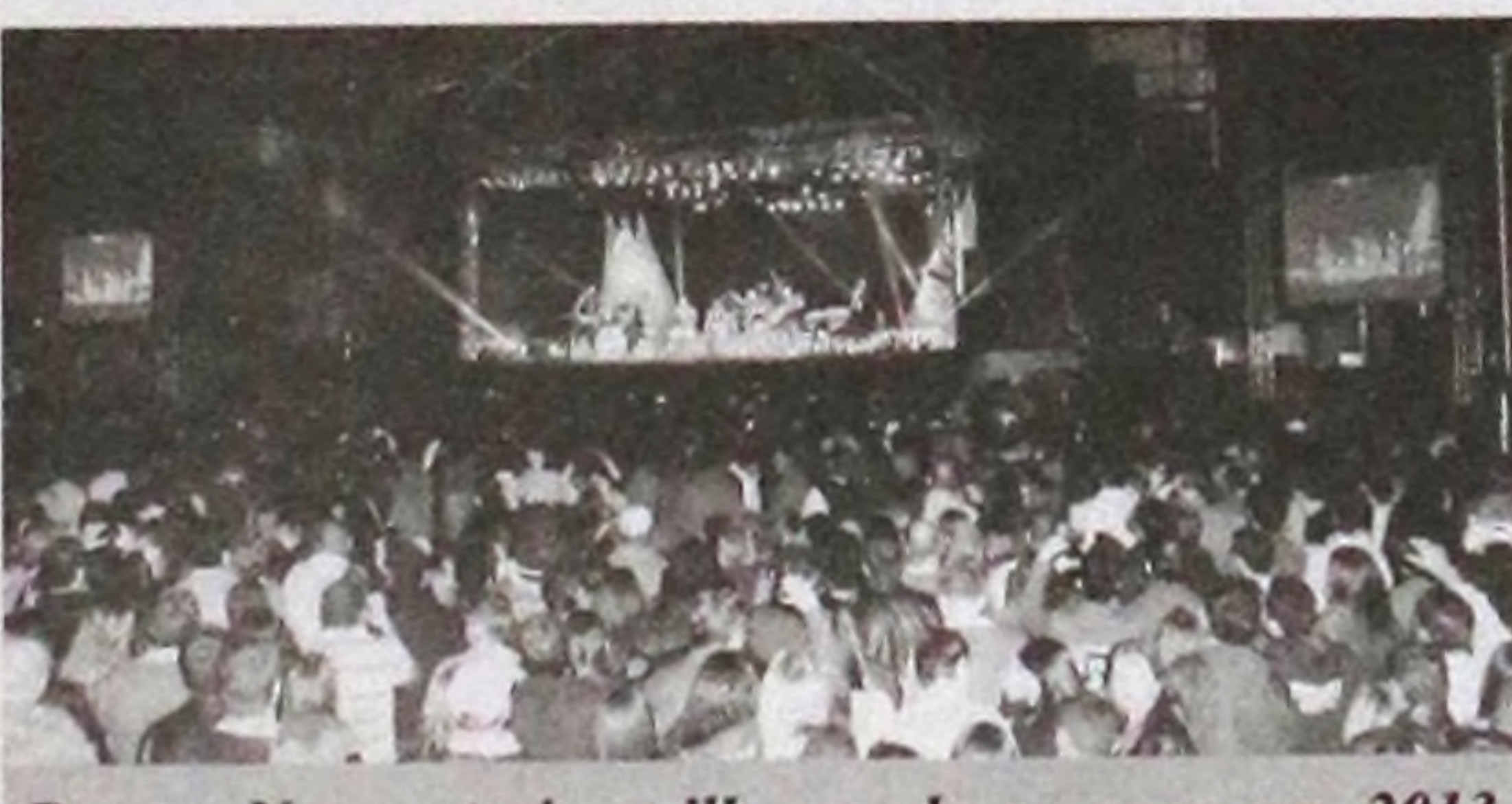
Roupa Nova atraiu milhares de pessoas em 2013

A destinação correta destes resíduos tem sido uma grande preocupação da categoria para que não sejam gerados transtornos ou problemas para a população do município.