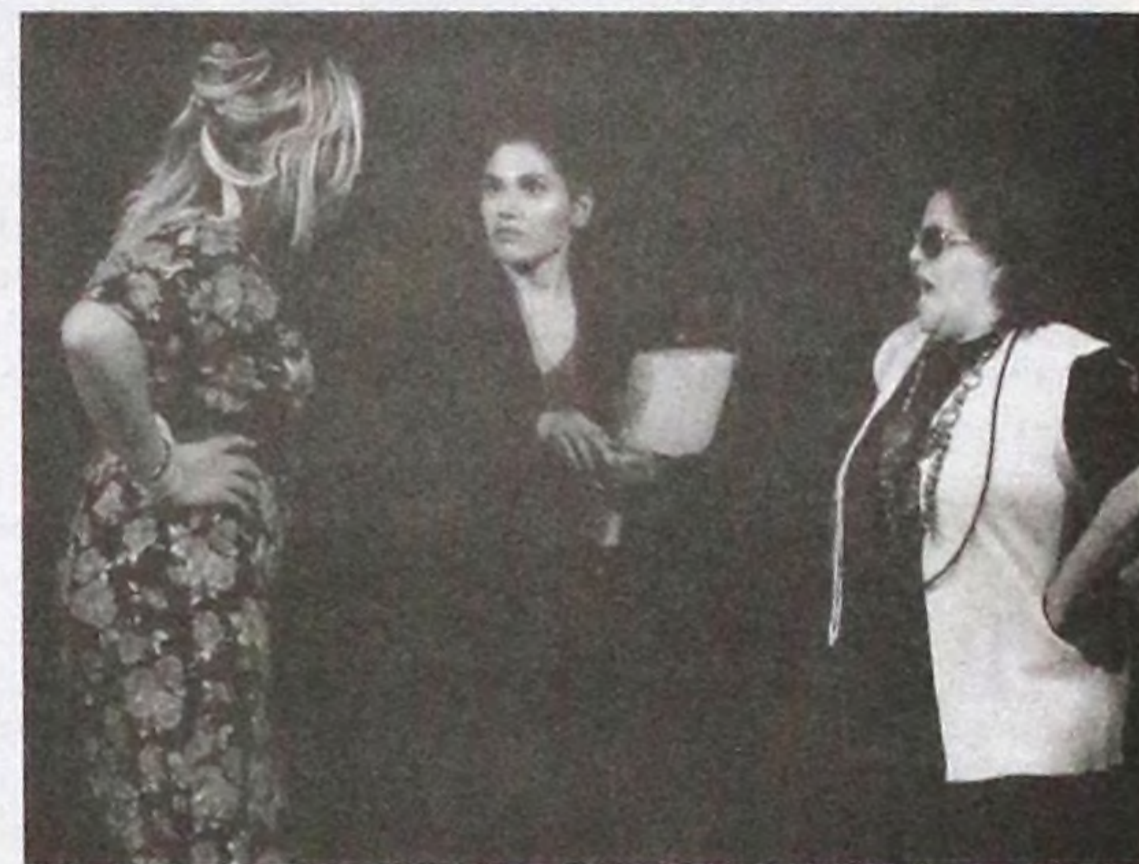
Discriminação é encenada de maneira lúdica