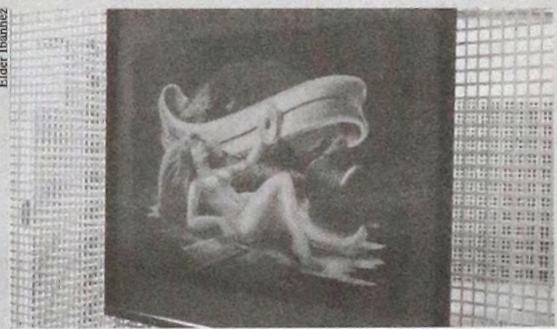
Alguns trabalhos foram ilustrados digitalmente