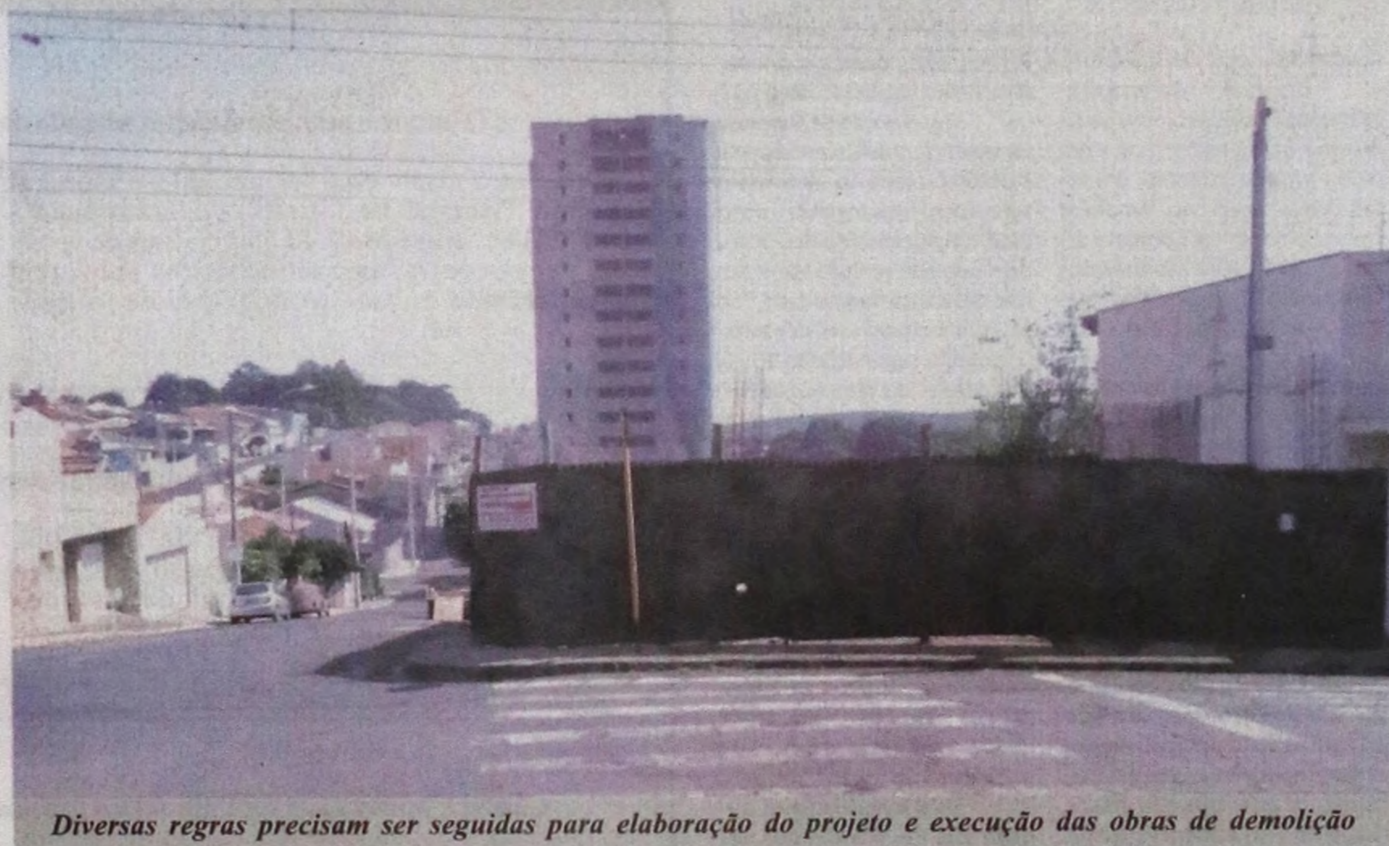
Diversas regras precisam ser seguidas para elaboração do projeto e execução das obras de demolição

Imóveis demolidos podem trazer diversos transtornos e riscos que envolvem questões ligadas à saúde pública.