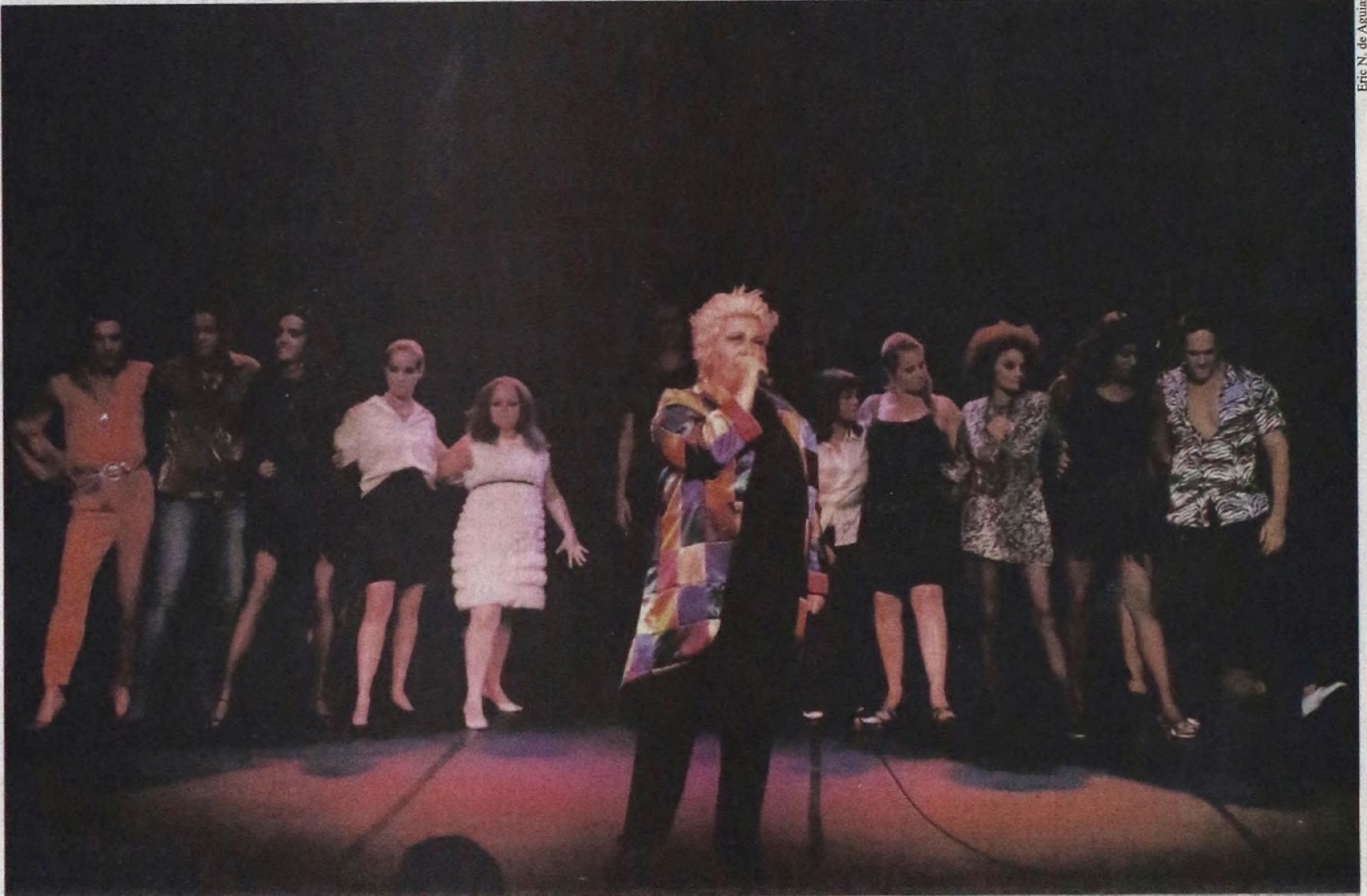
No elenco, formado por cerca de 20 atores, situações de preconceito contra o segmento LGBT são encenadas de maneira lúdica