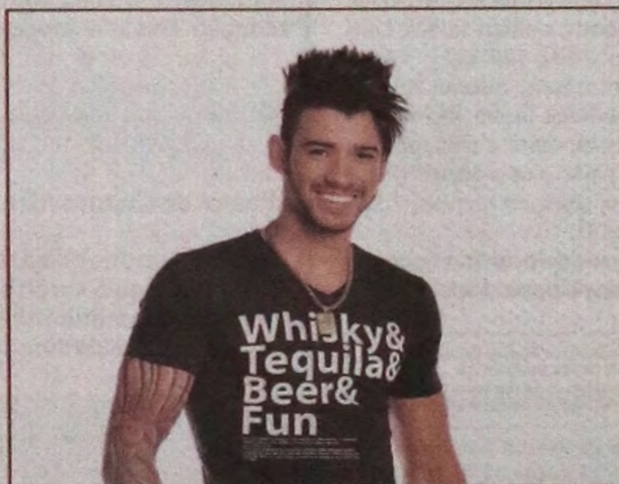
Talento, o cantor se apresenta hoje na região

Um show repleto de novidades e com muitos sucessos que fazem parte do repertório de Gustavo Lima.