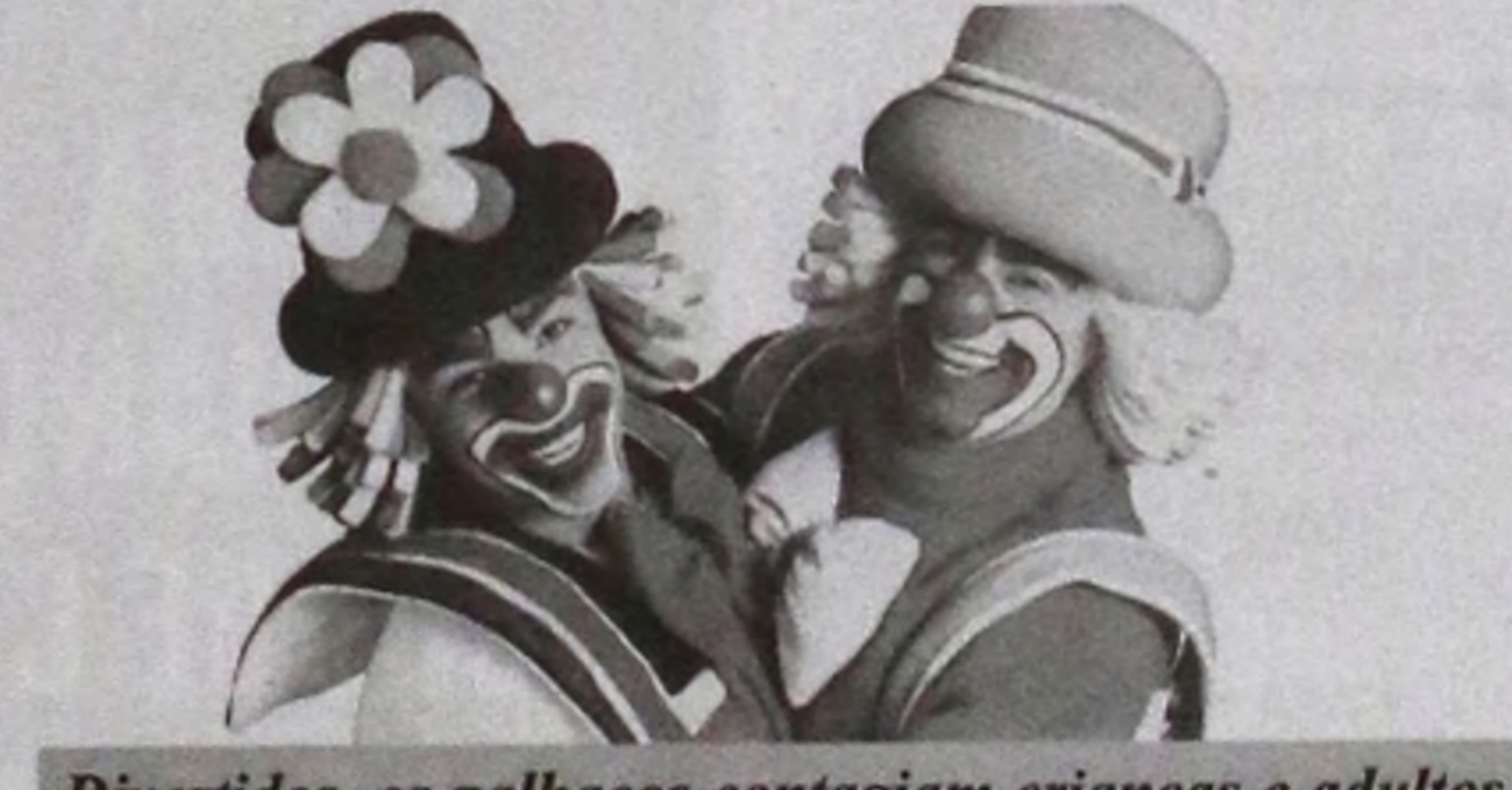
Divertidos, os palhaços contagiam crianças e adultos

São sucessos como "Pula Mais que Pipoca", "Dança do Marreco", "Dança do Lôro", "Obrigado Deusão", "Volta ao Mundo", entre outros.