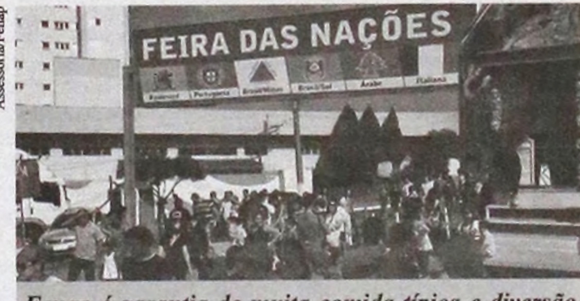
Fenap é garantia de muita comida típica e diversão