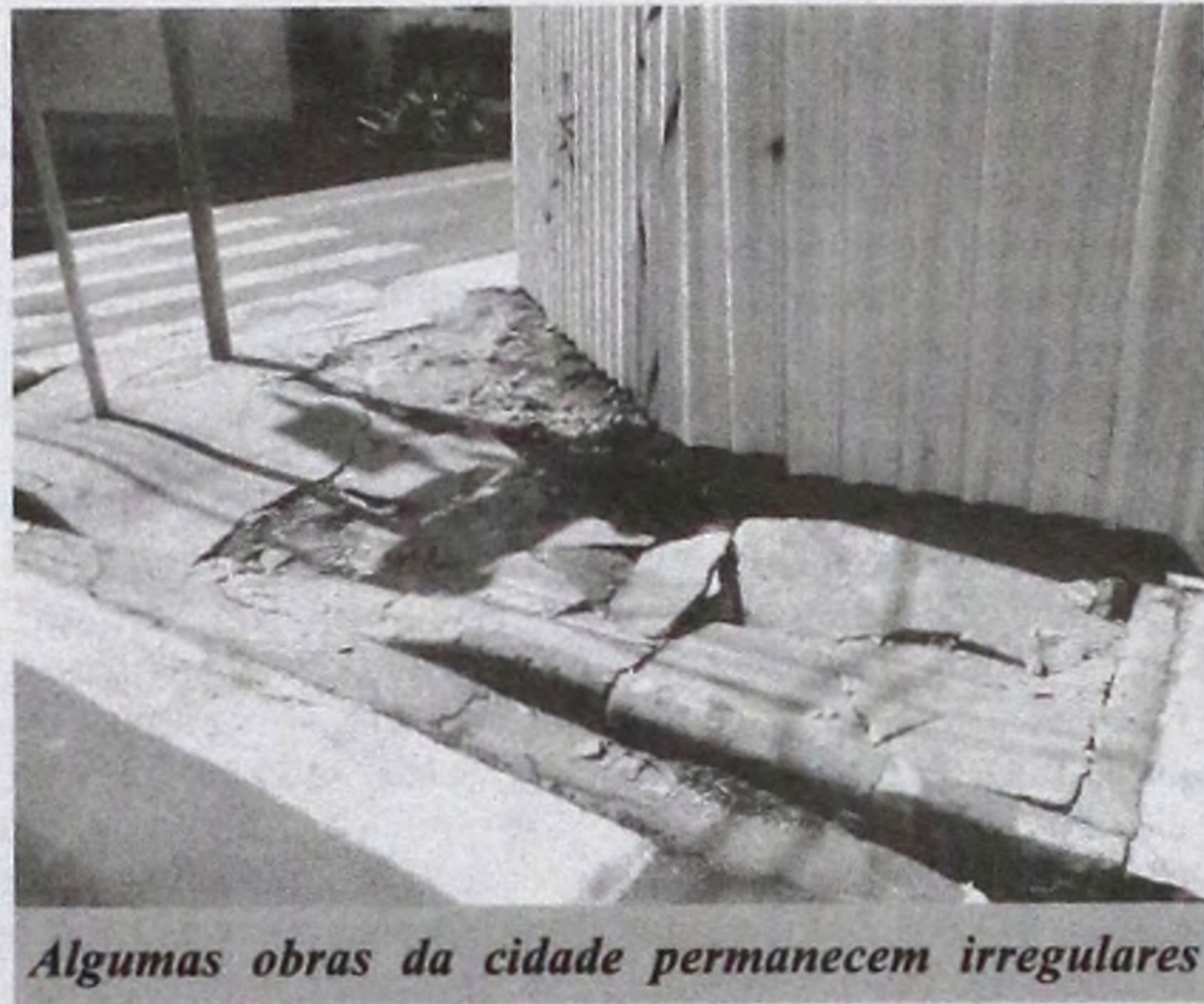
Algumas obras da cidade permanecem irregulares