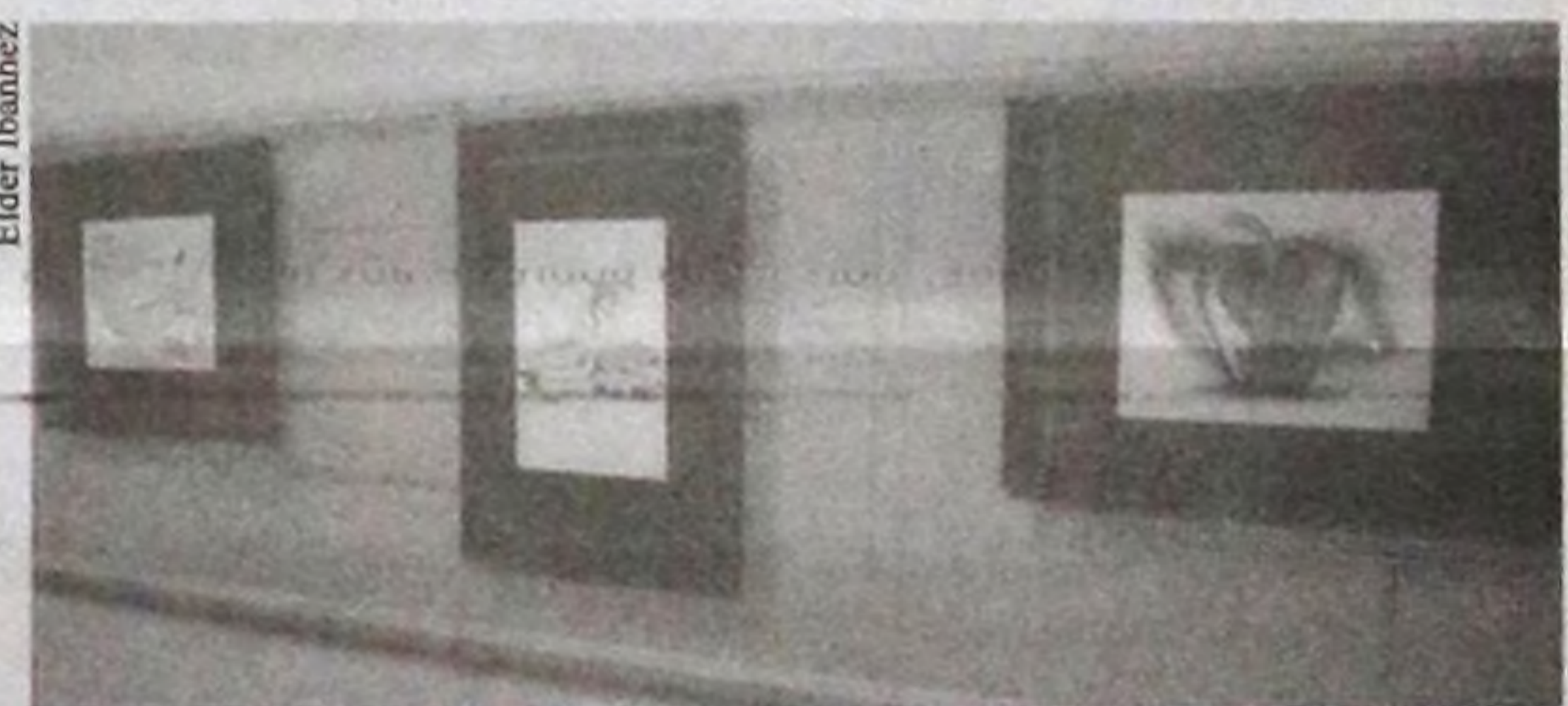
Muita ousadia na série "Eva - O Fruto Proibido"