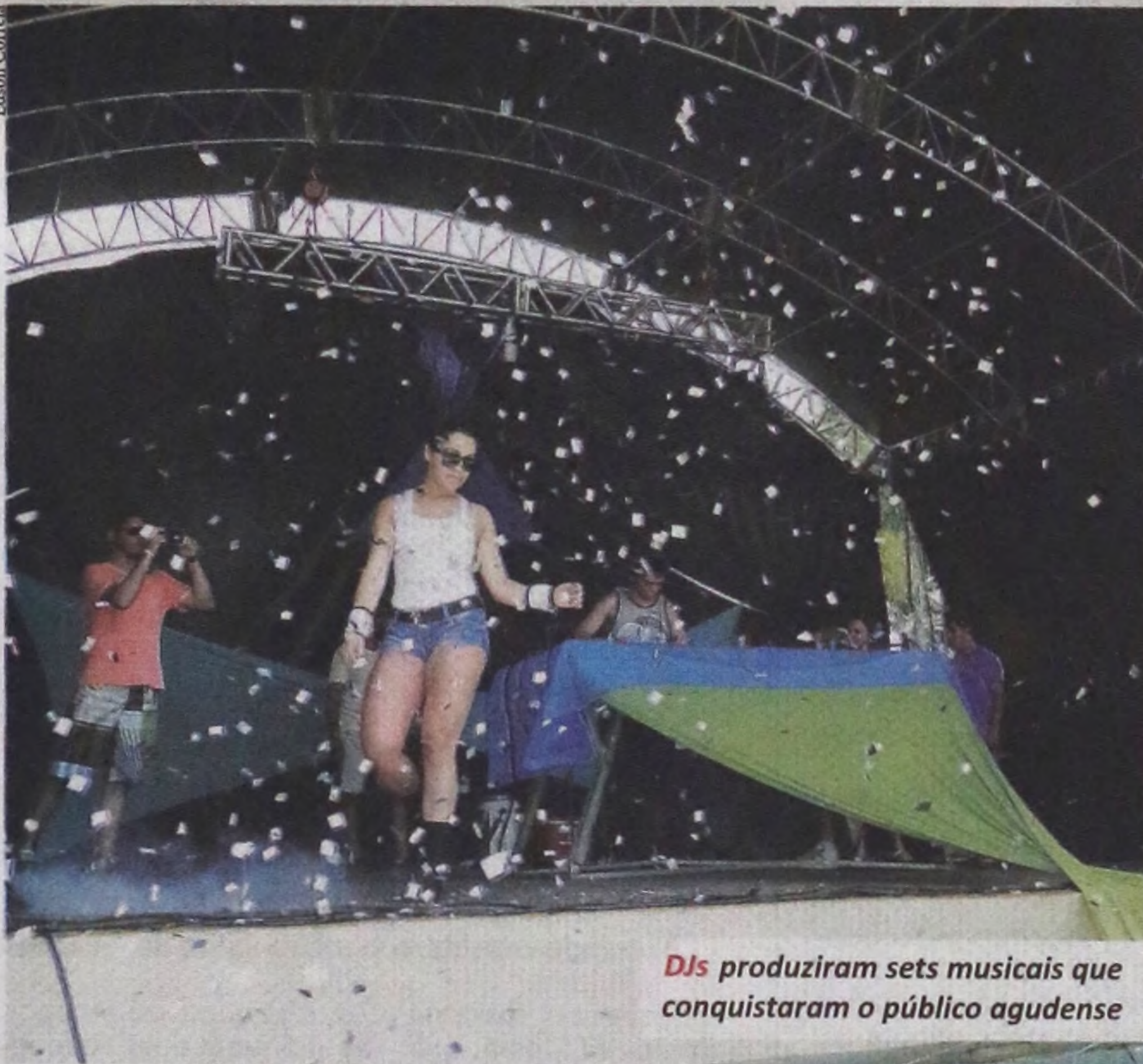
DJs produziram sets musicais que conquistaram o público agudense