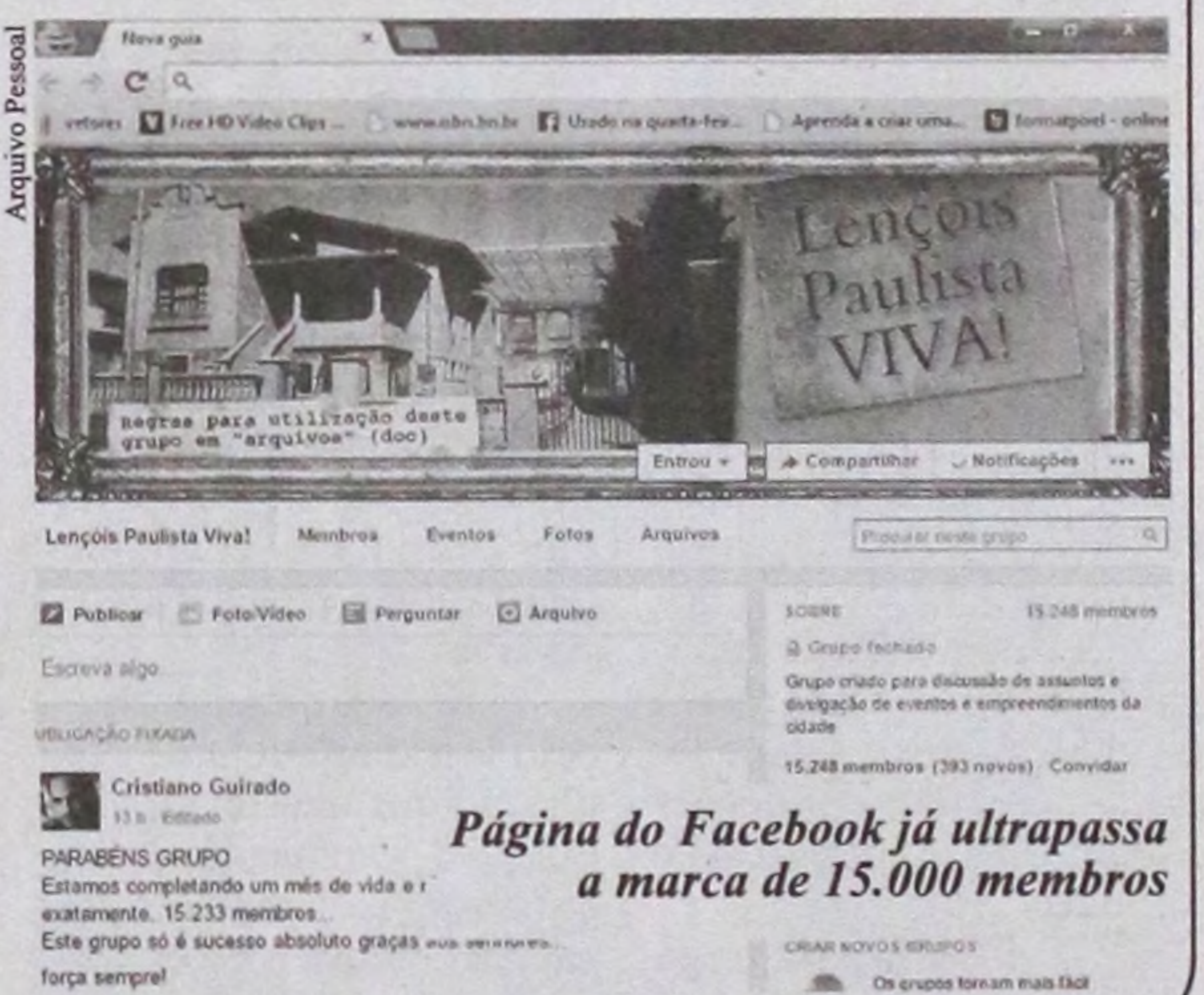
Página do Facebook já ultrapassa a marca de 15.000 membros

“Aos que fazem parte do grupo, só tenho a agradecer. Ele só é o que é, só tem o carisma e apelo emocional que tem, pela participação dos seus membros. Muito obrigado, de coração. Aos que ainda não conhecem, que sejam bem vindos”, finaliza o jornalista.