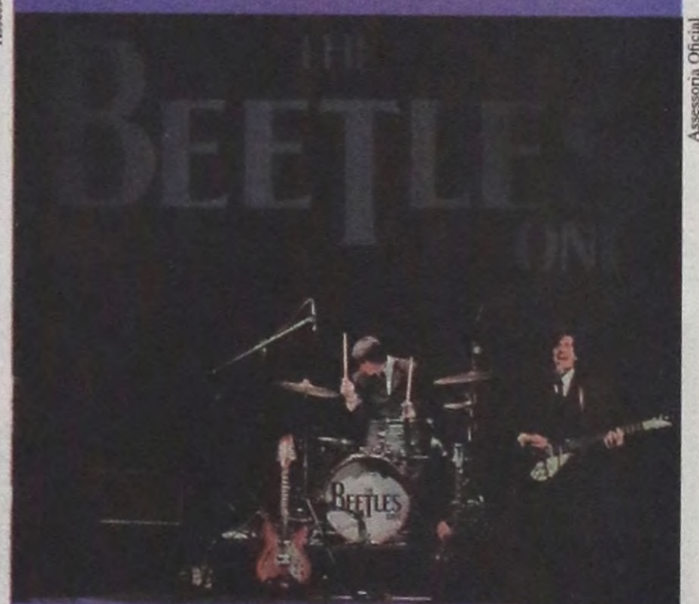
"The Beatles One" retrata banda de Liverpool Pág. 05