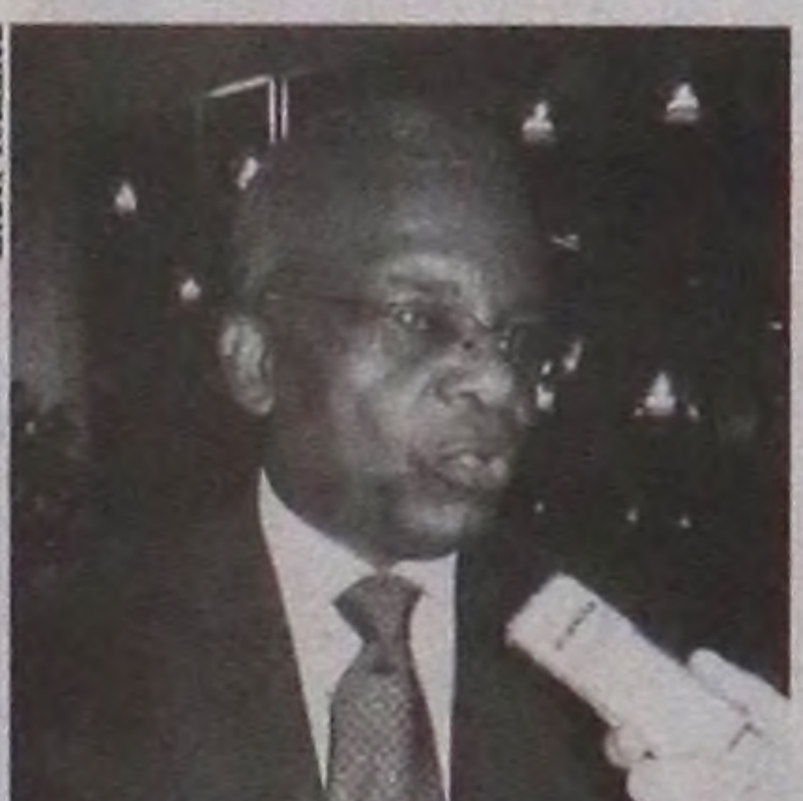
Joaquim Mangueira é o Cônsul da Angola

Já no segundo piso estão novas salas de aulas. A FAAG pretende dobrar o número de alunos atendidos, além de oferecer mais opções em cursos de graduação e MBA.