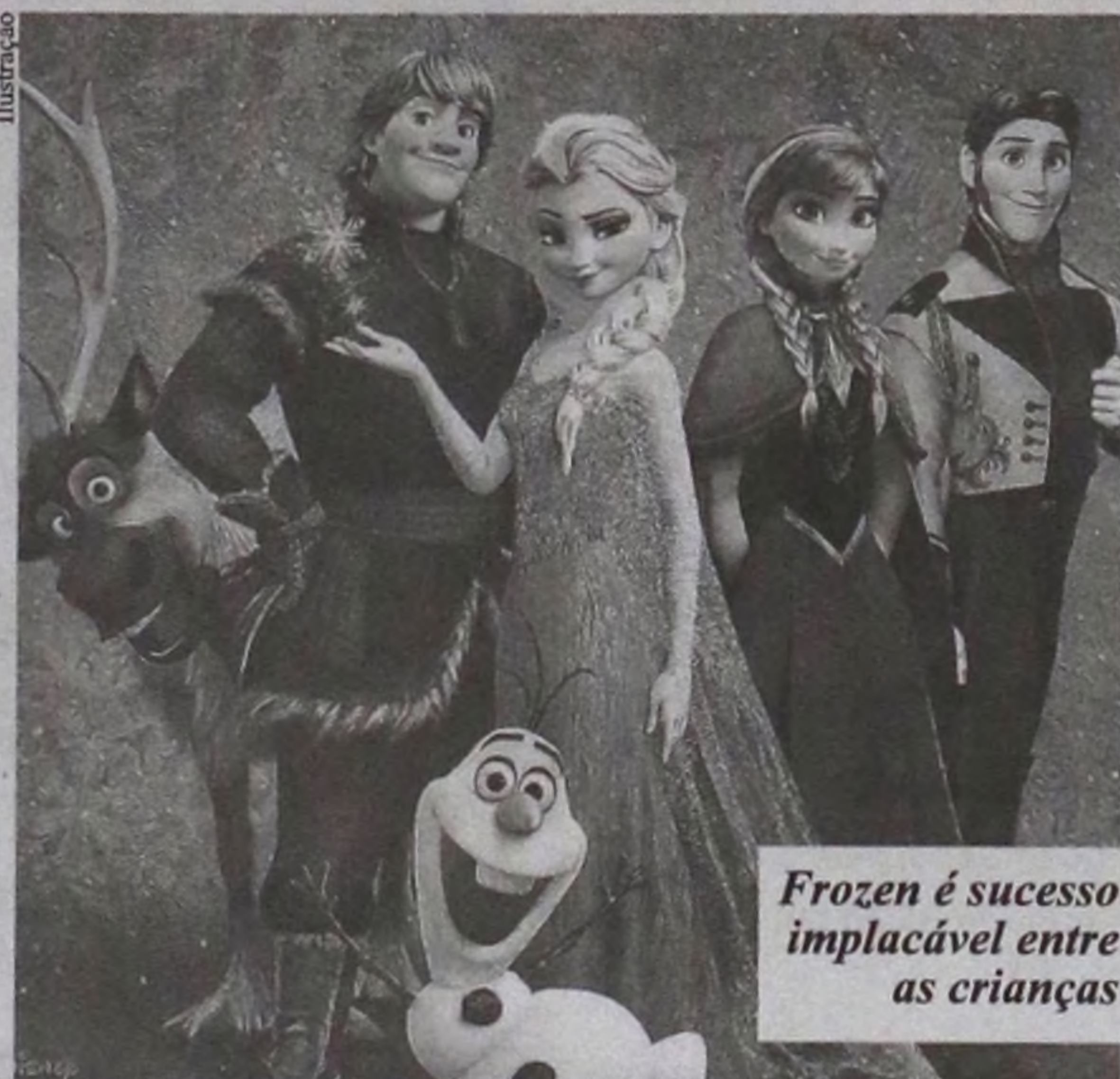
Frozen é sucesso implacável entre as crianças

O musical será exibido na Casa da Cultura