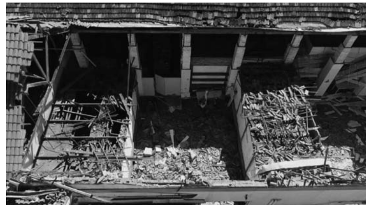
TUDO NOVO - Após demolição, prédio da creche Diomira Paschoal dará lugar a outra creche escola