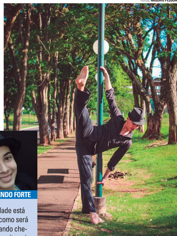
TALENTO - Para chegar à Escola do Teatro Bolshoi, lençoense concorreu com 2,4 mil candidatos de todo o país

CORAÇÃO BATENDO FORTE "Minha ansiedade está a mil. Não sei como será minha vida quando chegar lá. Sei que muita coisa vai mudar. Mas também sei que será para melhor."