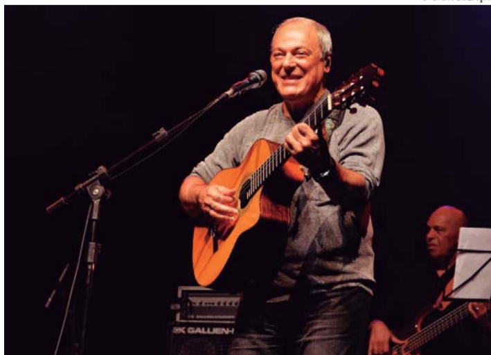
FILLP - Autor de sucessos como "Que Maravilha", "Aquarela" e "O Bem-amado", Toquinho se apresenta no domingo no Teatro Municipal

Com uma estrutura com dois palcos e diversos estandes, tendas e praça de alimentação, o