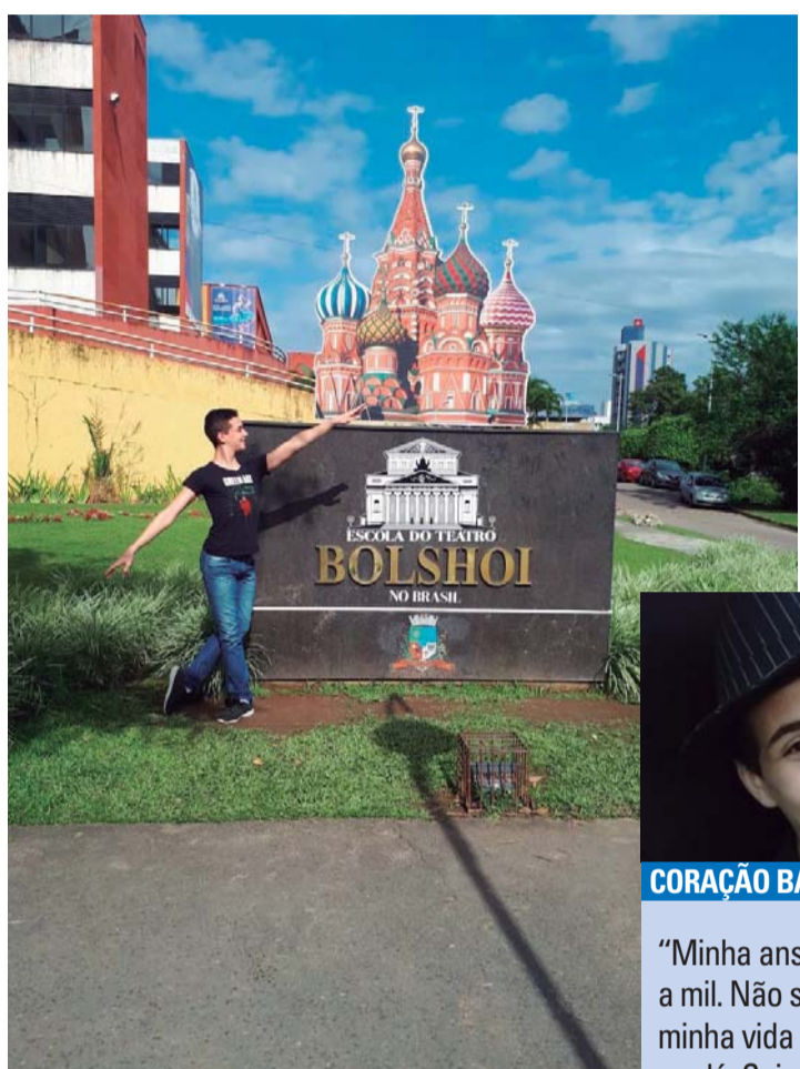
SONHO REALIZADO - Jovem se muda em fevereiro para Joinville para se tornar um bailarino profissional