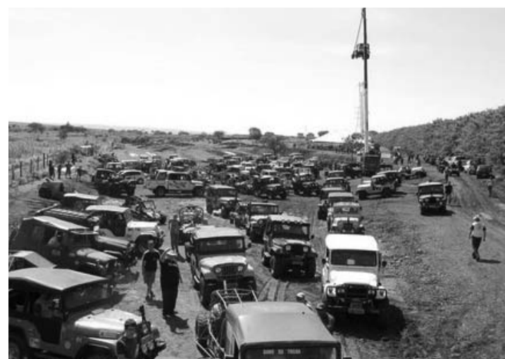
ENCONTRO - Participantes interessados em participar da trilha devem se inscrever na hora do evento