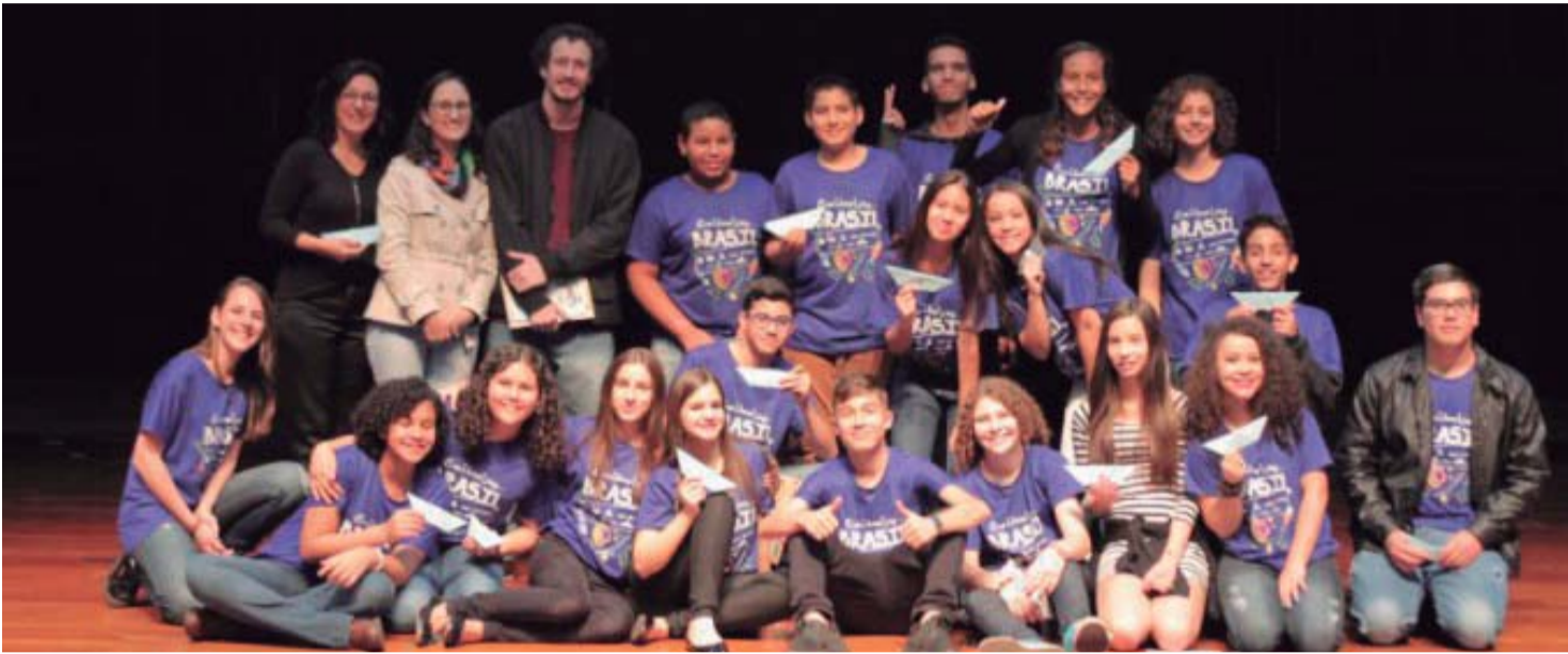
PRÓXIMA PARADA: PORTUGAL - Alunos e professores selecionados embarcam para intercâmbio cultural de 10 dias em Portugal

Durante 10 dias, grupo de alunos e professores da rede pública de ensino de Lençóis Paulista e Macatuba vai percorrer o caminho da Família Real Portuguesa antes da chegada ao Brasil