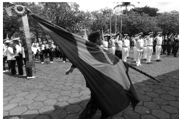
PATRIOTISMO - Forças Armadas se reúnem em Macatuba para incineração das bandeiras

Evento acontece na segunda-feira (19), na Praça Santo Antônio