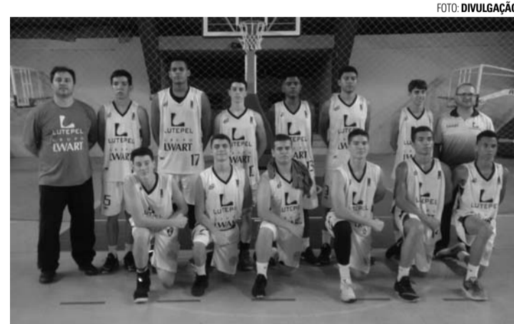
EM CASA - Sub-16 da Alba vence Alphaville pelo Campeonato Paulista

O confronto, que foi disputado no Ginásio Municipal de Esportes Antonio Lorenzetti Filho (Tonicão), em Lençóis Paulista, terminou com o placar de 79 a 54 para os lençoenses, que chegaram a três vitórias em três jogos disputados na segunda fase da competição. Invicta, a equipe se manteve na segunda colocação do Grupo D, com