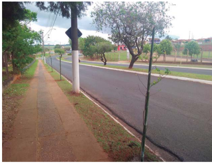
FLORESTA URBANA - Árvores foram plantadas ao longo da Avenida Nações Unidas, no Núcleo Habitacional Luiz Zillo

A Secretaria de Agricultura e Meio Ambiente da Prefeitura de Lençóis Paulista trabalha para concluir o Piloto de Floresta Urbana do município, que está localizado na Avenida Nações Unidas, no Núcleo Habitacional Luiz Zillo, via importante e de grande circulação na região, onde se encontram escolas como a EMEI Yvonne Conti (ensino infantil); Escola Estadual Rubens Pietrarroia, e EMEF Luiz Zillo, além do Estádio Municipal João Roberto Vagula (Vagulão) e do Ginásio Municipal de Esportes Hiller João Capoani (Toniquinho). A conclusão da ação atende aos critérios e ações do Programa Município Verde Azul, da Secretaria de Estado do Meio Ambiente e acontece na semana em que se comemora o Dia da Árvore, data que tem por objetivo conscientizar a população sobre a importância da arborização urbana.