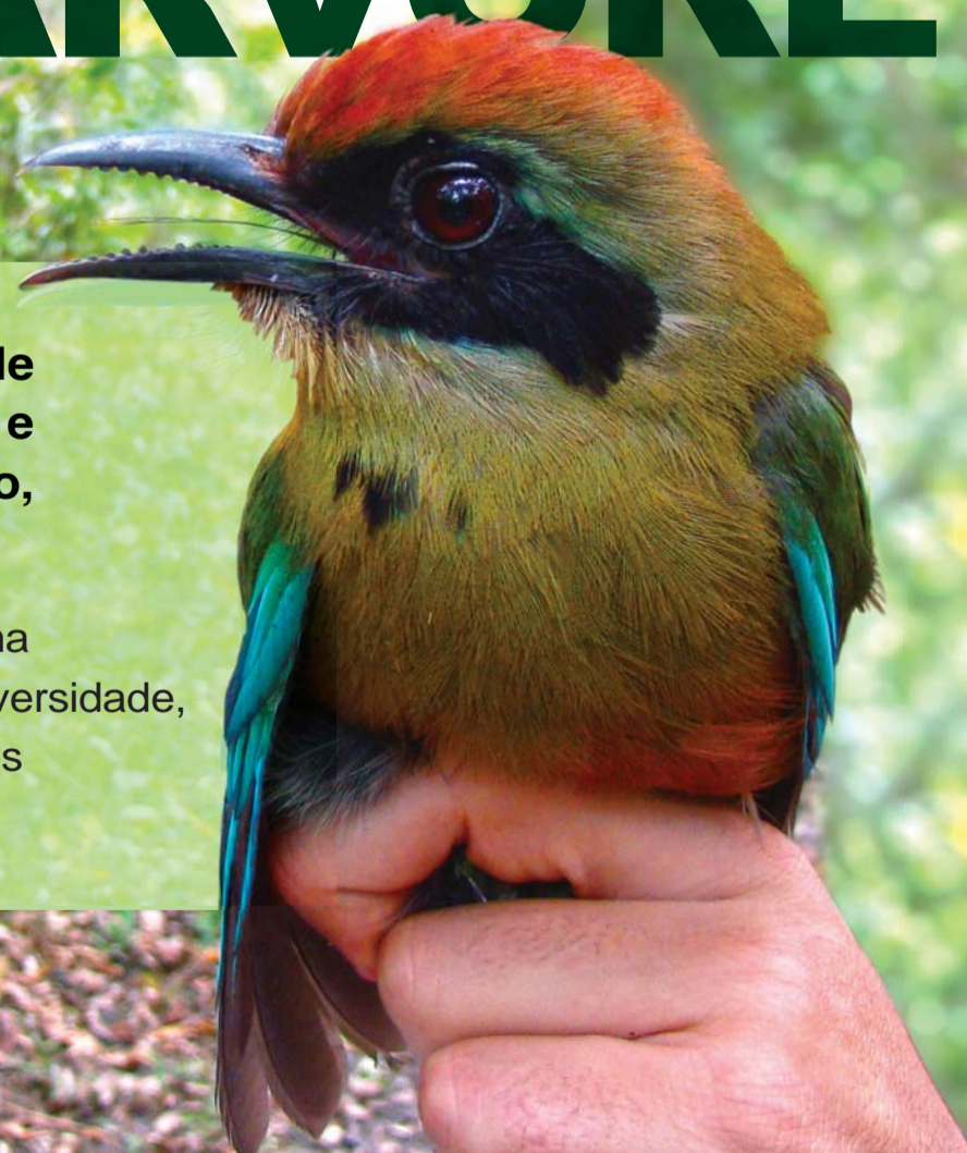
A ave Juruva-verde é uma espécie habitante da mata atlântica presente nas reservas da Zilor

Na Zilor, fazemos o manejo da cana-de-açúcar de forma responsável, contribuindo para a preservação da biodiversidade, o que possibilita a presença de vários animais silvestres em nossas áreas de conservação.