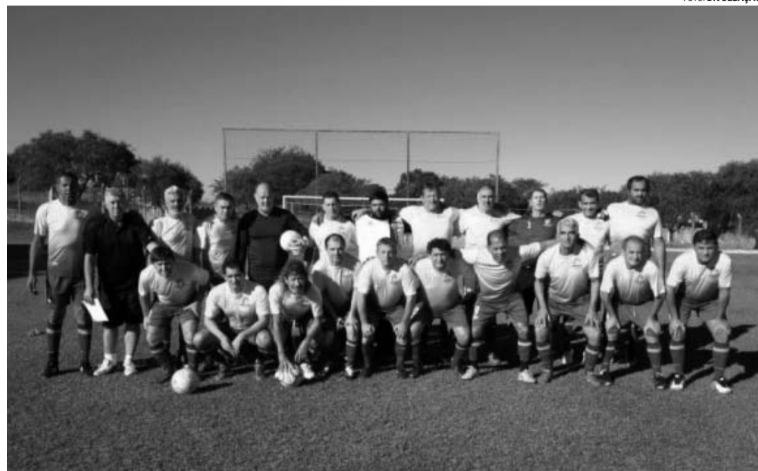
EM CAMPO - Master de Lençóis encara Borebi pelo Campeonato Regional

Na tarde do último sábado (15), no Estádio Municipal Achilles Sormani, em Agudos, o Grupo Tomasini/Botucatu derrotou a equipe de Pirajuí por 2 a 1. No outro confronto, Agudos venceu Avaré pelo mesmo placar. No Estádio Euclides de Moraes Rosa, em Itatinga, a Associação Atlética Botucatuense levou a melhor sobre o Amigos do Grilo, também vencendo por 2 a 1.