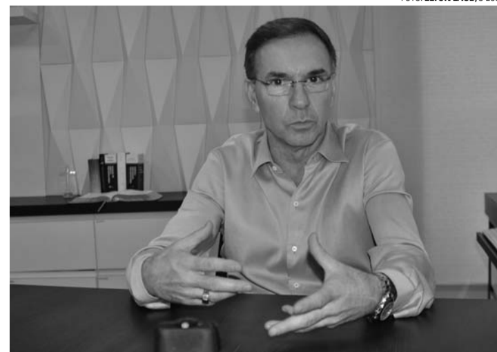
EM ALTA - Pesquisa Propagare/O ECO aponta crescimento considerável de Tipó entre os eleitores lençoenses

O levantamento ouviu 302 eleitores em suas residências, distribuídos proporcionalmente segundo cotas pré-definidas de sexo e faixa etária baseadas em informações do TSE (Tribunal Superior Eleitoral) e regiões geográficas definidas a partir de dados disponibilizados pelo Censo 2010 do IBGE (Instituto Brasileiro de Geografia e Estatística). A margem de erro para o total da amostra é de 5,6 pontos