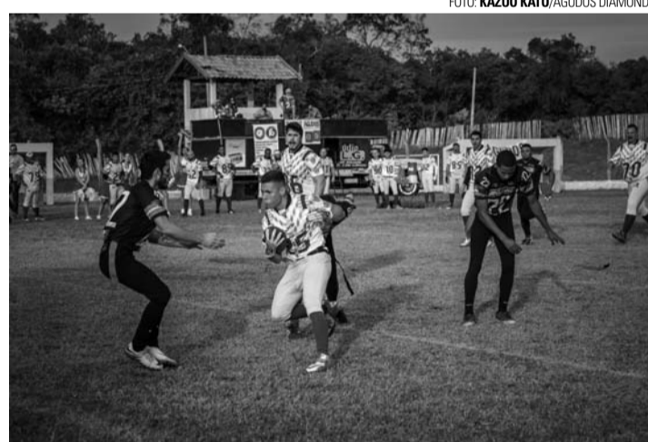
EMBALADO - Com vitória de 6 a 0 sobre o Avaré Scorpions, Agudos Diamonds se manteve invicto na temporada

Com o resultado, o Diamonds, que integra a Divisão Oeste da Conferência Caipira (Caipira Bowl), se manteve invicto, com cinco vitórias em cinco jogos: Ducks Football (19 a 8), Bauru Badgers (19 a 3), Bauru Warhawks (19 a 0),