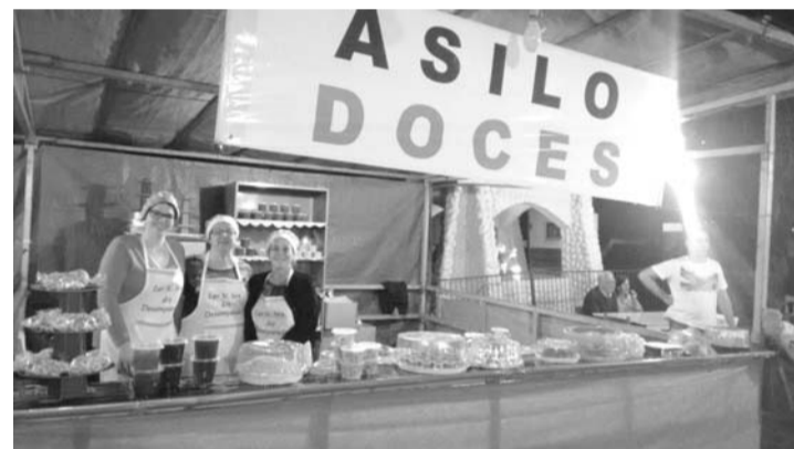
QUERMESSE - Festa do Asilo começa no sábado (11)

te papel social há 57 anos em Lençóis Paulista, o Lar Nossa Senhora dos Desamparados atualmente atende 82 idosos, muitos necessitando de diversos cuidados especiais por conta do estado de saúde, o que gera um alto custo mensal para a manutenção das atividades da instituição. Não por acaso, a festa é tratada com grande importância pelos voluntários.