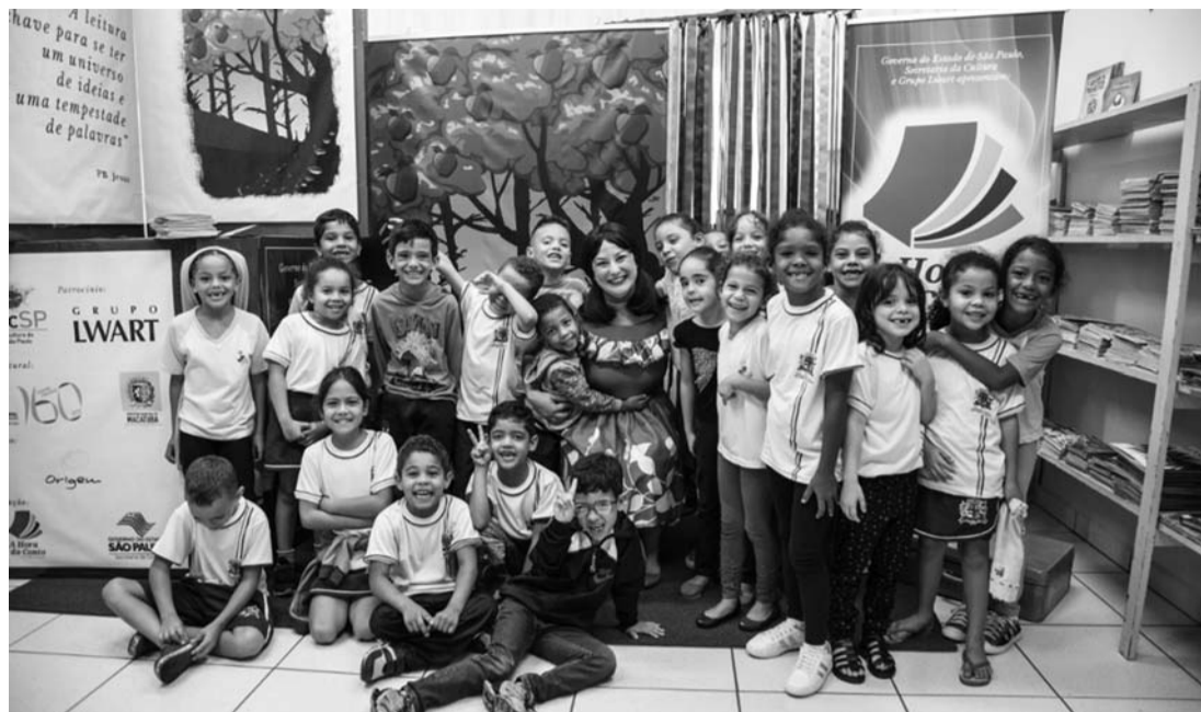
A HORA DO CONTO - Oficinas do projeto acontecem a partir de hoje em Lençóis e Macatuba

As oficinas para os professores serão realizadas nos dias 1 e 8 de agosto durante todo o dia no auditório da Secretaria de Educação, em Lençóis Paulista, e nos dias 14 e 15 no