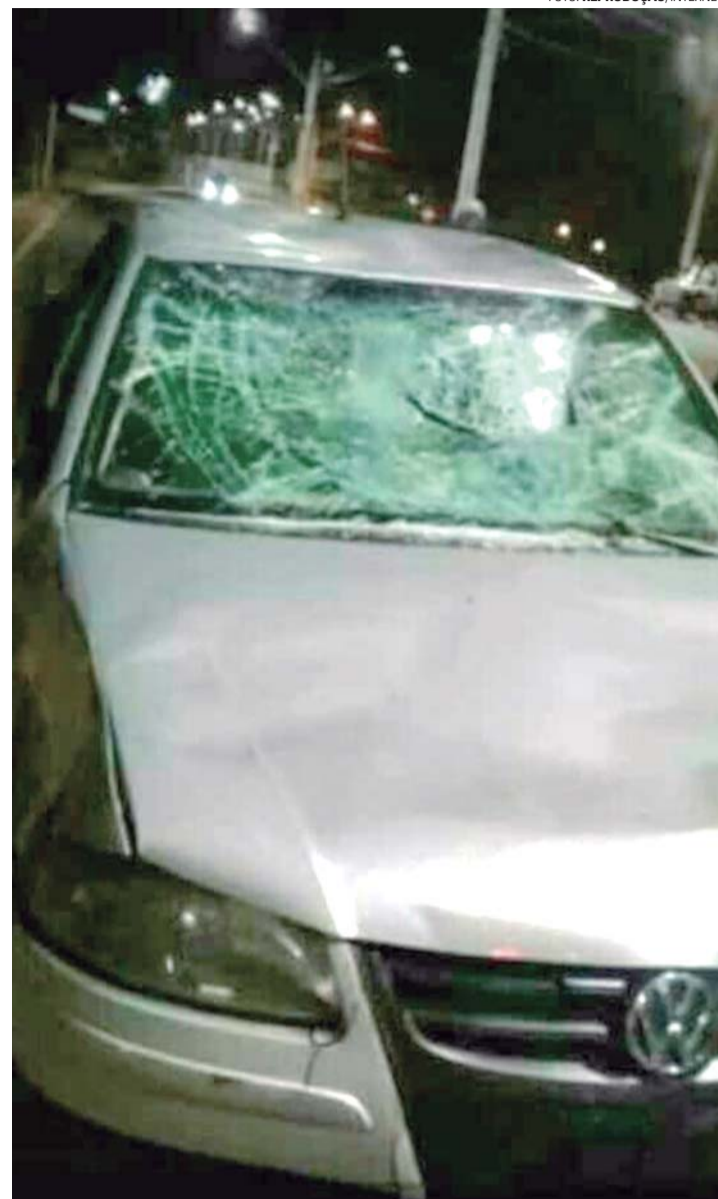
CONFUSÃO - Atropelamento resulta em agressão e depredação de veículo próximo ao Teatro Municipal

O condutor e o passageiro foram conduzidos à Delegacia de Polícia para prestarem depoimento. Ao mesmo foi aplicada multa pela recusa ao teste do bafômetro e liberados ao final da ocorrência. O veículo foi removido do local por um guincho e apreendido para perícia. A equipe da PM fez contato com as vítimas, as quais passavam por cuidados médicos.