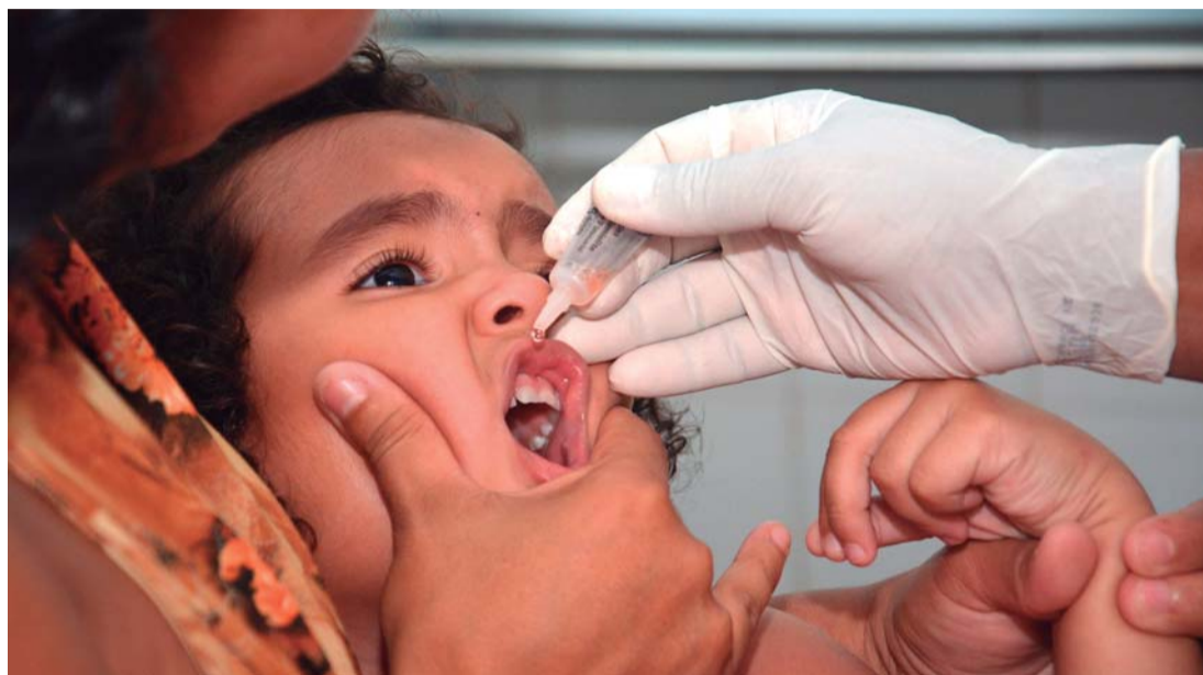
PREVENÇÃO - Meta é vacinar 11,2 milhões de crianças contra a poliomielite e o sarampo

A campanha de vacinação deste ano é indiscriminada, ou seja, pretende vacinar todas as crianças dessa faixa etária no país, para manter coberturas homogêneas de vacinação. Para a poliomielite, as que não tomaram nenhuma dose durante a vida, receberão a VIP. Já os menores de cinco anos que já tive-