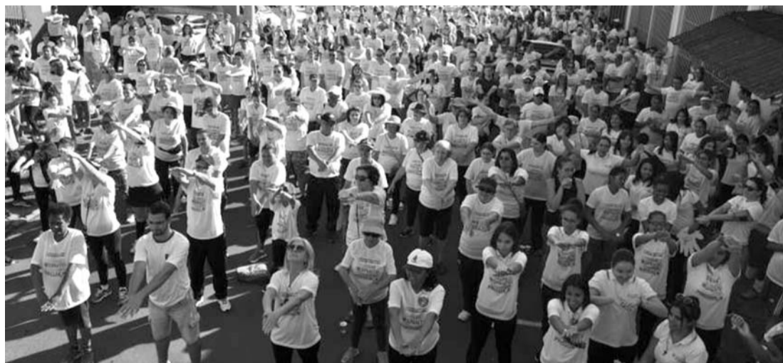
DISPOSIÇÃO - Evento estimula a prática de atividades físicas e a adoção de hábitos mais saudáveis

Interessados devem doar um isotônico no ato da inscrição; evento é no dia 26