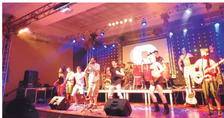
QUASE LÁ - Baile de Máscaras Beneficente acontece no dia 25; animação é da banda Os Quatro

Conforme já divulgado pelo Jornal O ECO, o evento que tem início previsto para as 9h, contará com animação da banda Os Quatro, que promete contagiar o público com um repertório bem variado para agradar a todos os estilos. Segundo a organização, a festa também reserva outras atrações, como um grupo de violinistas da Casa da Cultura Prof.ª Maria Bove Coneglian, que vai recepcionar os convidados já na entrada no salão; além de atores da Cia Atos & Cenas, que vão interagir com o