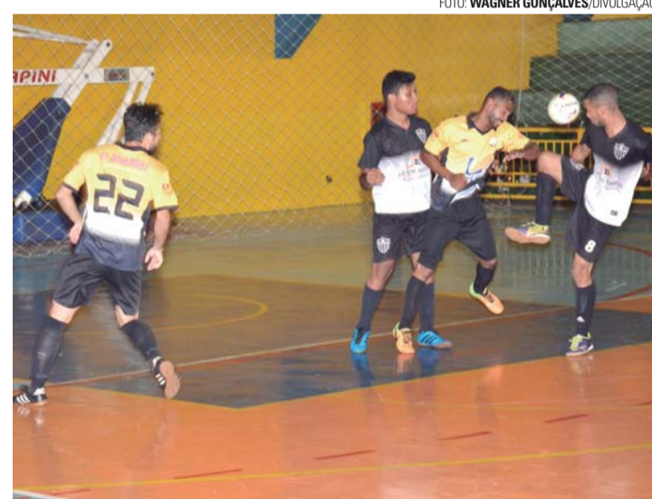
TUDO OU NADA - Tonicão recebe rodada decisiva das séries Ouro e Prata da Nova Copa Lençóis de Futsal

da sexta-feira (6), no Tonicão. No primeiro jogo, às 19h20, jogam Lar Doce Bar e Zoio FC. Em seguida, às 20h, o Asa Branca encara Só Tapa FC ou UME. A Série Ouro define os finalistas na próxima segunda-feira (9). Às 19h20, entram em quadra Açaí e Santa Luzia. Na sequência, às 20h, o Grêmio Cecap mede forças com Desacreditados ou Palestra. As finais de ambas as séries serão disputadas na sexta-feira (13), também no Tonicão.