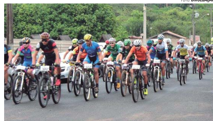
SEM LIMITES - Competição deve reunir centenas de ciclistas em Lençóis Paulista

Os ciclistas interessados em participar podem se inscrever através dos sites www.incentivo-esporte.com.br e www.tripadventure.com.br . O valor das inscrições, que se encerram na próxima