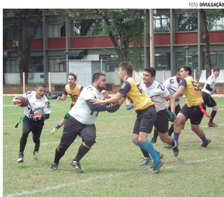
VAI COMEÇAR - Readers e Diamonds estreiam no domingo (8) no Caipira Bowl

A exemplo das outras edições, Readers e Diamonds