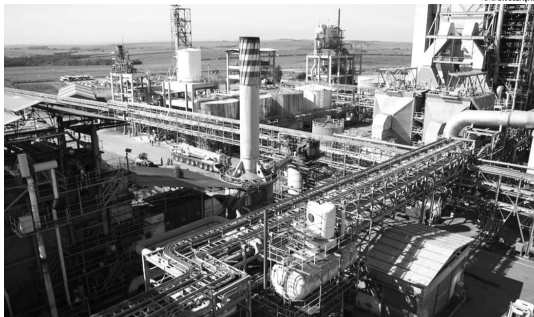
CRESCIMENTO - Projeto de expansão pode aumentar em cinco vezes capacidade de produção da Lwarcel

O Grupo Lwart também não sugere uma data específica para a definição do futuro da Lwarcel - o Estadão afirma que as negociações devem ser concluídas ainda no primeiro semestre -, mas garante que tudo deve "[...] ocorrer em cur-