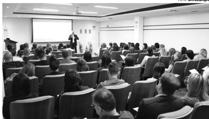
CONVENÇÃO - Professores tiveram um dia intenso de atividades, com palestras, dinâmicas e mesa redonda para troca de experiências

franquia, ressalta a importância do encontro. "Um dos diferenciais da Efac é oferecer um curso que o aluno saia preparado para o mercado de trabalho e isso só é possível graças a dedicação e preparação dos nossos professores em seguir a didática de