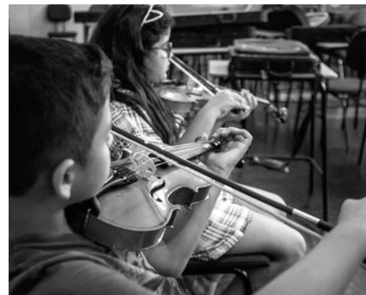
VAGAS - Ao todo estão sendo oferecidas 324 vagas para crianças a partir de seis anos

As vagas oferecidas são para as oficinas de violão (132 vagas); teclado (95 vagas); guitarra (12 vagas); violino (35 vagas); violoncelo (seis vagas);