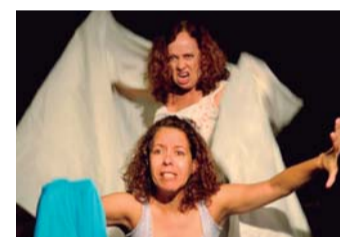
DEBATE - Peça é inspirada em pesquisas e depoimentos de mulheres que sofreram algum tipo de violência

A entrada é gratuita, mas a disponibilidade de ingressos deve ser consultada na Casa da Cultura Prof.ª Maria Bove Coneglian, pelo telefone (14) 3263-6525. O Teatro