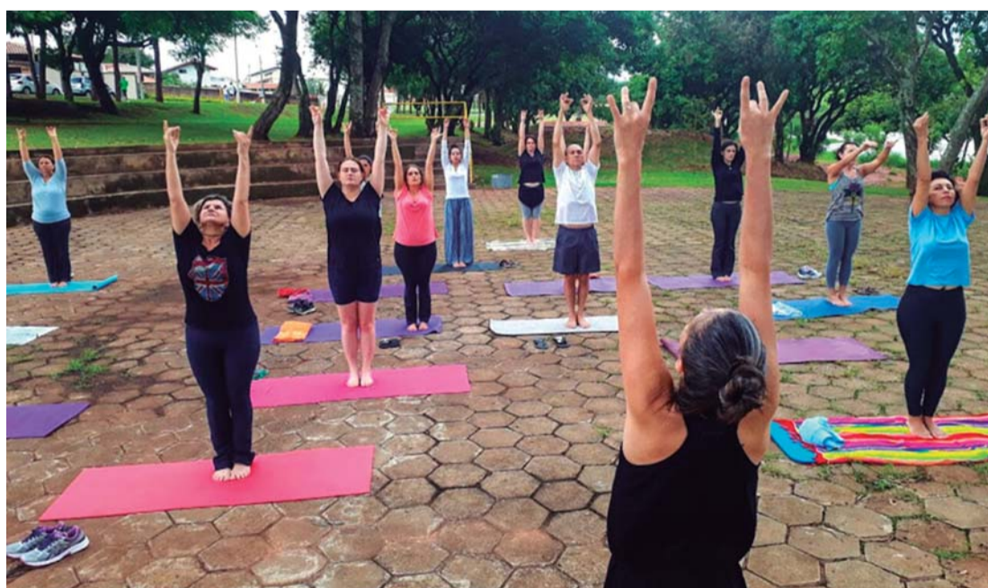
NA PRAÇA - Projeto social de yoga nas praças de Lençóis acontece aos domingos