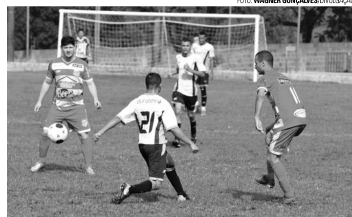
HORA DA VERDADE - Expressinho e Duratex se enfrentam por vaga nas quartas de final; na foto, confronto entre as equipes pelo Amador de 2017, também em Alfredo Guedes

Vale ressaltar que os confrontos são só de ida e que as duas equipes vencedoras se garantem nas quartas de final. Em caso de empate no tempo regulamentar, a decisão da vaga se dará por cobranças de pênaltis. A 12ª Copa Lençóis de Futebol Amador é organizada pela Diretoria de Esportes e Recreação de Lençóis Paulista.