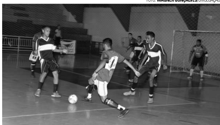
EQUILÍBRIO - Em jogo de 16 gols, Só Tapa venceu o Unidos da Vila por 9 a 7