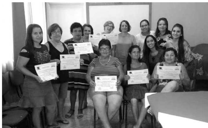
CONCLUSÃO - Alunas do curso de pintura em tela receberam certificados

Sendo a primeira turma de 2017, o curso teve duração de seis meses e contou com a instrução realizada pela professora