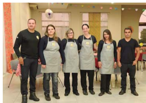
EQUIPE - Com profissionais treinados e capacitados, empresa atua em todos os tipos de eventos