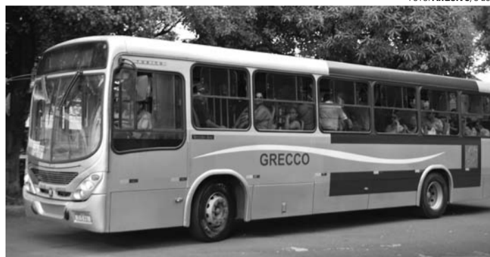
COBRANÇA - Tarifa dos circulares volta a ser cobrada a partir do dia 10; valor será o mesmo: R$ 3,25

Segundo a assessoria de imprensa da Prefeitura Municipal, para facilitar o atendimento dos usuários, foi elaborado um cronograma para o credenciamento, que será feito por ordem de chegada, mediante a distribuição de senha.