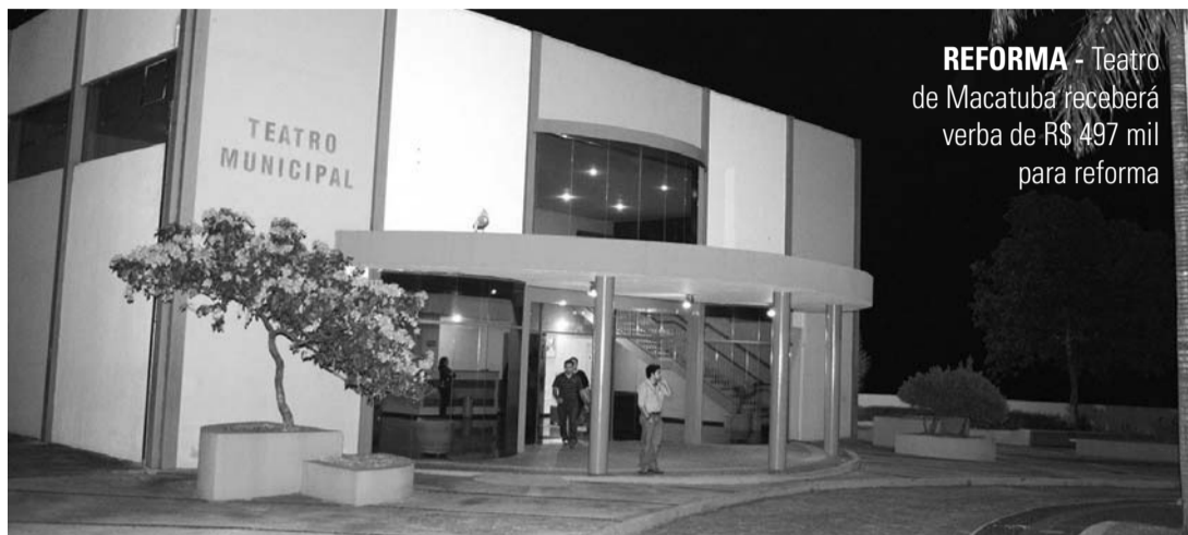
REFORMA - Teatro de Macatuba receberá verba de R$ 497 mil para reforma

Segundo dados disponíveis, quase mil projetos foram inscritos no FID este ano e apenas 400 foram selecionados. O projeto