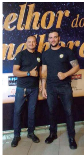
MELHOR DOS MELHORES - FS Segurança atuou na festa dos 80 anos do Jornal O ECO

Para conhecer mais sobre os serviços oferecidos, a página do Facebook é “FS Segurança Agente Limpezas”.