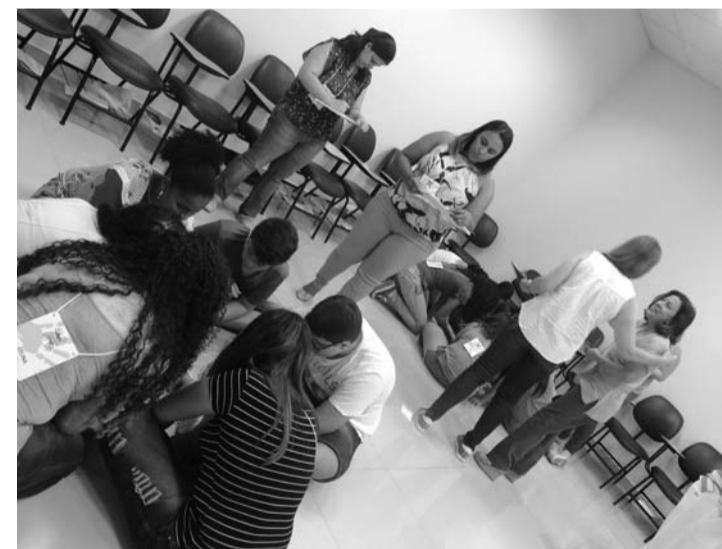
NOVA TURMA - Alunos selecionados realizam primeiro encontro neste sábado (17)

A nova turma participará de encontros semanais, às terças e quintas, das 15h30 às 17h30 e, uma vez ao mês, os jovens se reunirão aos sábados. A primeira atividade, prevista para hoje, tem como foco os jovens conhecer um ao outro, interagir com os facilitadores e definir as regras de convivência. A partir desse encontro, serão abordados temas que contribuem para