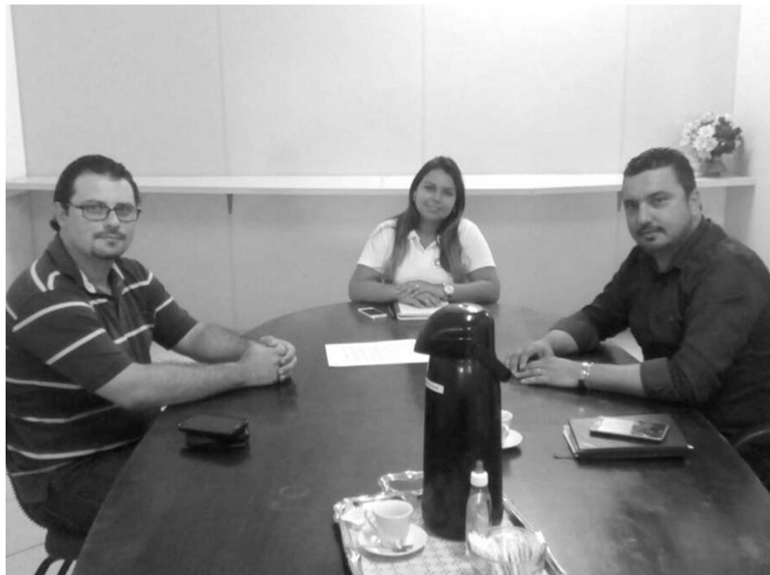
PARCERIA - Reunião entre Prefeitura e Acira, marcam início de nova parceria para desenvolvimento do comércio e indústria

Um dos pontos de destaque da reunião, que deve ser incrementado é o Emprega Agudos, agência pública mantida pela Prefeitura que faz o recrutamento e seleção completa, a pedido das empresas agudenses. O compartilhamento do Banco de Currículos com o Emprega Agudos foi um dos pontos de destaques da reunião.