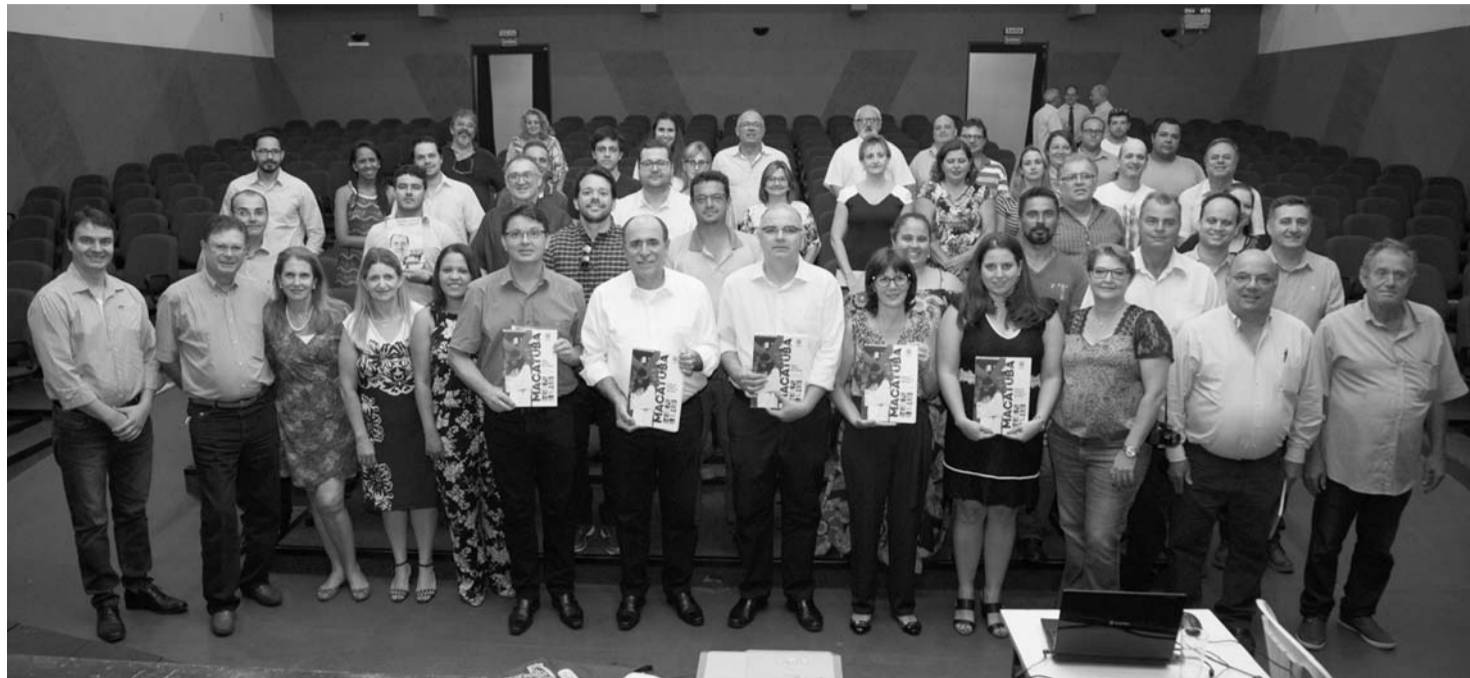
ENTREGA - Cerimônia foi realizada no Teatro Municipal de Macatuba

"A data de hoje é muito importante porque estamos dando um passo firme para que Macatuba se coloque na rota do