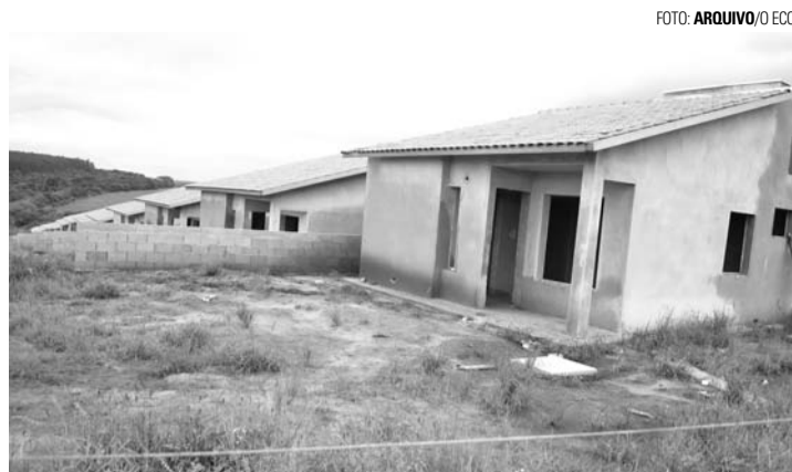
ABANDONO - Obras estão paralisadas há quase um ano e meio, desde outubro de 2016