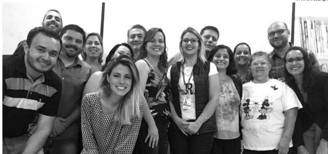
TREINAMENTO - Conselheiros e diretores municipais participaram do encontro no Espaço Cultural

Diretores Municipais e Conselheiros participaram de um treinamento realizado pela empresa InterAge Consultoria em Gerontologia