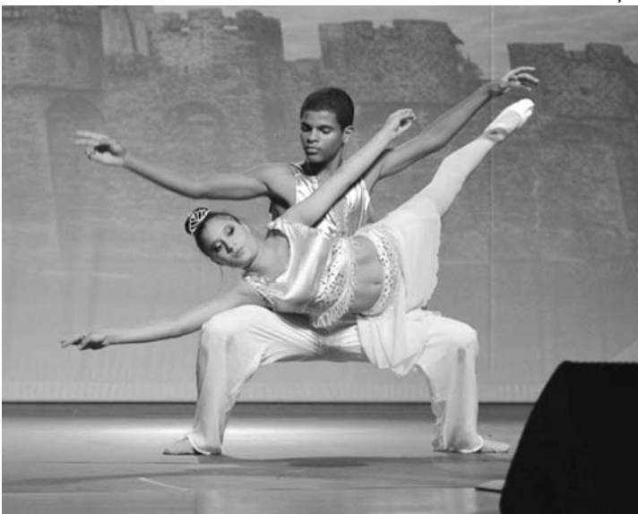
DANÇA - Academia Tablado busca novos talentos da dança