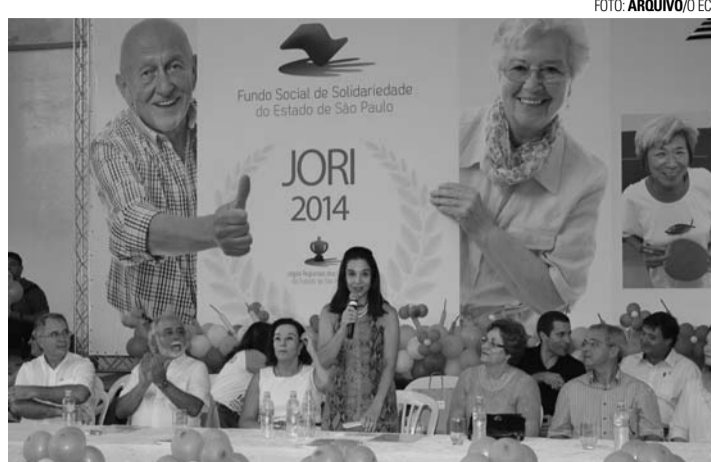
SOLENIDADE - Lu Alckmin participa da abertura; na foto a primeira-dama durante discurso na edição de 2014

A organização espera receber mais de 2 mil pessoas, entre atletas e membros das comissões técnicas e equipes de apoio durante o evento, que segue até o domingo (21). A maioria das delegações está alojada