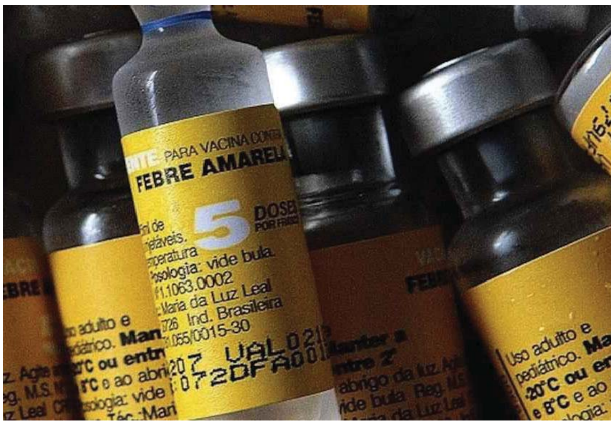
PREVENÇÃO - Vacina contra a febre amarela passa a ser recomendada em todo o estado de São Paulo

Estado confirmou 21 mortes pela doença nos últimos 12 meses, pelo menos oito deles no início deste ano