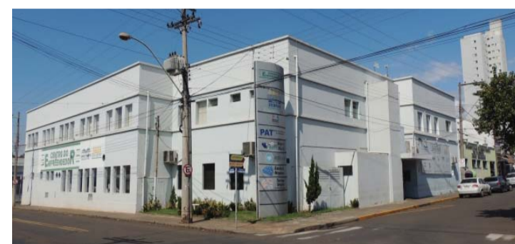
MERCADO DE TRABALHO - Encontros do Time do Emprego acontecem no Centro do Empreendedor

Interessados devem comparecer ao Centro do Empreendedor entre os dias 22 e 24