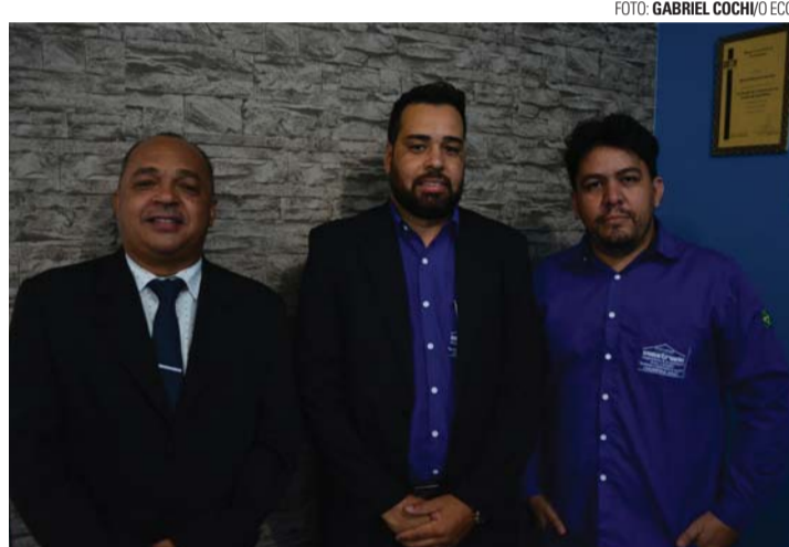
SERIEDADE - Construelo conta com profissionais altamente qualificados

custos, aumento da competitividade no mercado, aumentando a satisfação de seus clientes e a credibilidade da empresa.