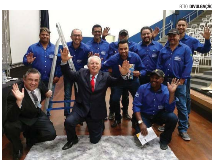
CAPACITAÇÃO - Profissionais da Construelo passam constantemente por treinamentos para aprimorar os conhecimentos

A Construelo Engenharia e Arquitetura fica na Avenida dos Estudantes, 25, Sala 5 (ao lado do Fórum), em Lençóis Paulista. O horário de atendimento é de segunda a sexta-feira das 8h às 18h, e aos sábados das 8h às 12h. Mais informações podem ser obtidas pelos telefones (14) 3264-5929 e (14) 98134-0147. Solicite um orçamento na Construelo e construa com segurança e qualidade.