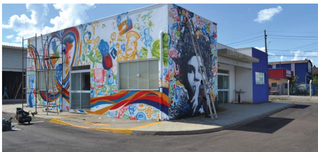
QUASE PRONTO - Polo da Etecri será inaugurado no próximo sábado (27)