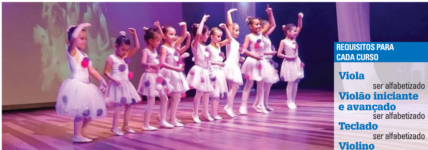
PEDERNEIRAS - Matrículas para projeto "Andar e Voar" estão abertas