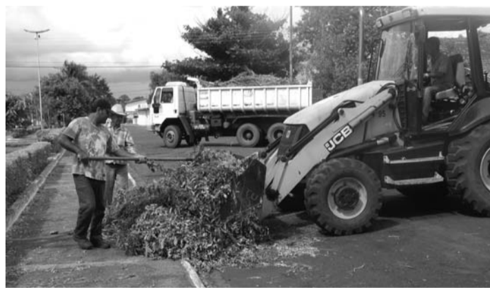
SERVIÇO - Volume máximo deve ser equivalente a três carriolas de mão

A cidade foi dividida em três grupos. O primeiro grupo é formado pelos bairros da região dos Altos da Cidade: Sonho Meu, Esperança, Bocayuva, Jardim América, Planalto e Santa Felicidade. A orientação é para que galho e entulho sejam colocados na calçada no domingo (28), já que a coleta começa na