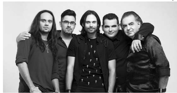
LOUVOR - Banda Anjos de Resgate se apresenta amanhã (25) em Agudos

A praça de alimentação conta com as tradicionais barracas de espetinhos, pastel e bebidas, entre outras diversões. As apresentações musicais, que começam hoje, com o Grupo dos Homens, seguem