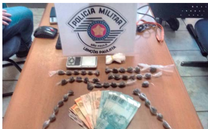
TRÁFICO - 42 porções de drogas são apreendidas com mulher no Jardim Carolina

recebeu voz de prisão e foi encaminhada à Delegacia de Polícia, onde o delegado de plantão to-