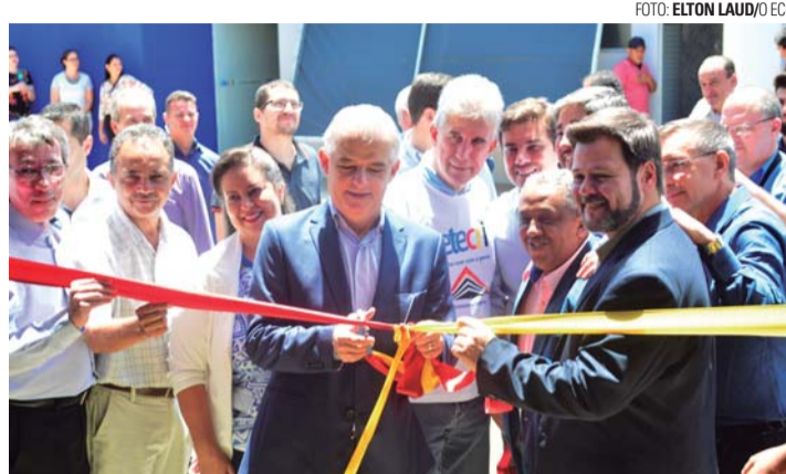
ECONOMIA CRIATIVA - Vice-governador Márcio França e autoridades regionais inauguram Etecri em Lençóis

Os interessados nos cursos que serão oferecidos pelo polo local da Etecri já podem fazer suas inscrições através do site do programa Via Rápida ( www.viarapida.sp.gov.br/Cursos.aspx?Cidade=12313 ). No local é possível obter informações sobre cada um dos cursos oferecidos. Para realizar a inscrição basta selecionar o curso desejado, clicar no link "Inscreva-se" e preencher as informações necessárias. A idade mínima é 16 anos.