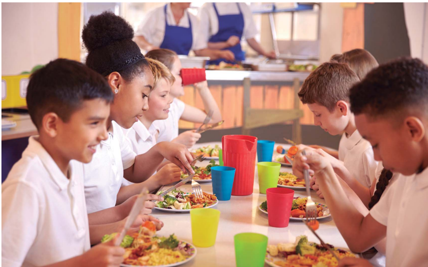
NUTRIÇÃO EQUILIBRADA - Segundo especialistas, alguns nutrientes podem auxiliar no crescimento das crianças

Entre outras coisas, baixo crescimento pode influenciar no aprendizado infantil