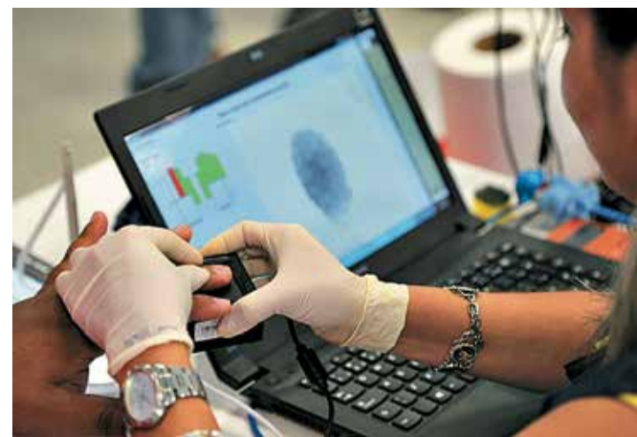
RETA FINAL - Eleitores que ainda não fizeram a biometria tem apenas duas semanas para ficar em dia com a Justiça Eleitoral

Conforme publicado na edição do último sábado pelo Jornal O ECO, milhares de eleitores da região ainda não regularizaram a situação junto à Justiça Eleitoral. Mesmo com