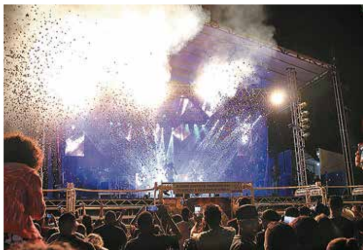
ANIMAÇÃO - Festa do Peão agita a vizinha cidade de Macatuba desde a quinta-feira (5)

Realizada na estrutura montada no Centro de Lazer do Trabalhador, a 24ª Festa do Peão de Macatuba conta com praça de alimentação com barracas