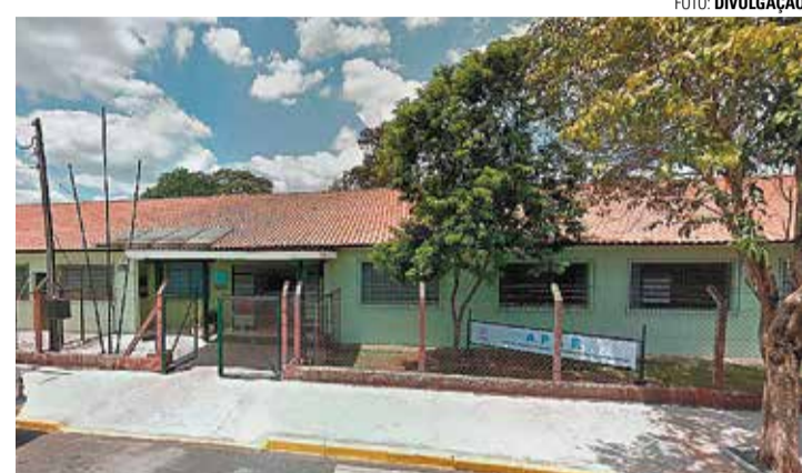
COMPRAS - Feirão de Jaquetas acontece no salão de festas da Apae na próxima semana

Jaquetas e outras vestimentas novas serão vendidas à preço de fábrica