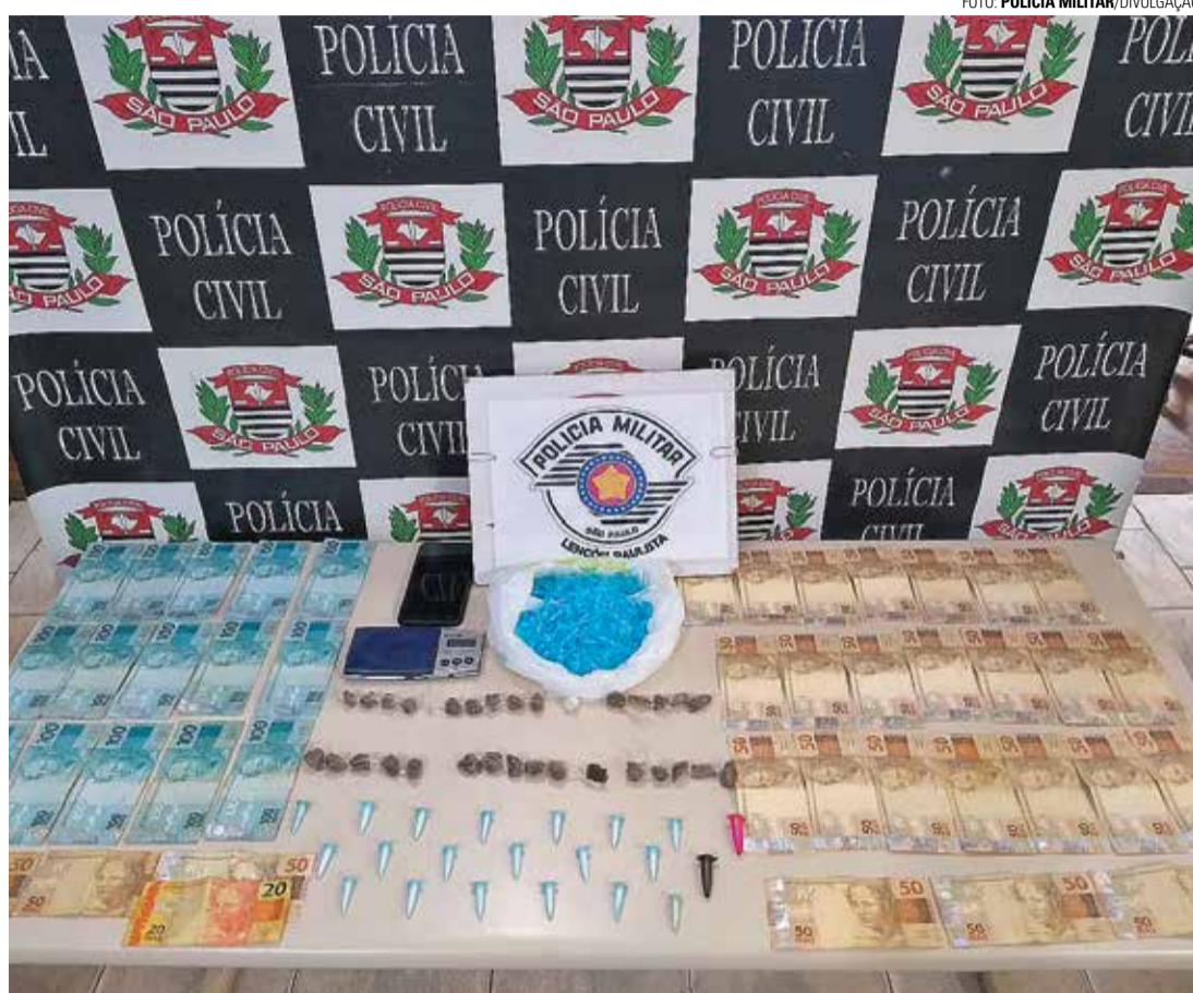
FLAGRANTE - Dois homens foram presos por tráfico de drogas na quarta-feira (30)

Durante a ação conjunta foram apreendidos 30 invólucros