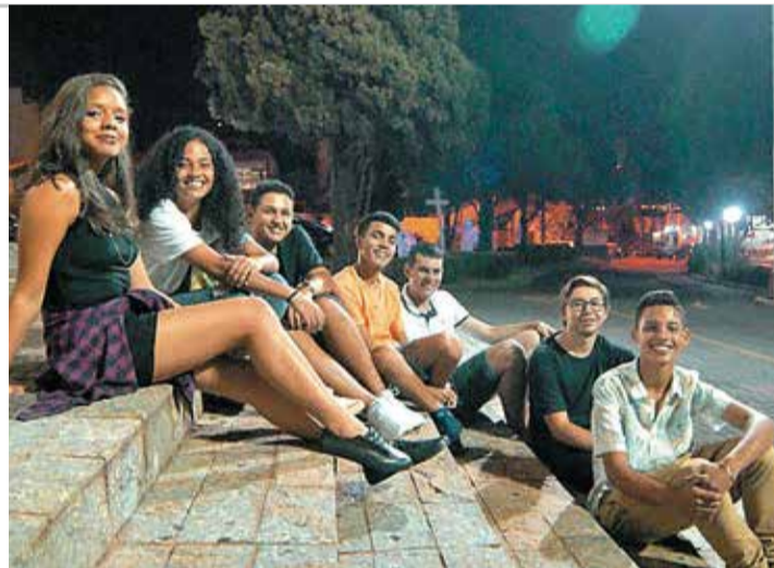
FACEIROS CINTILANTES - Grupo lençoense é semifinalista do festival

Concurso proporciona experiência profissional para candidatos de 13 a 21 anos, residentes em todo o estado de São Paulo