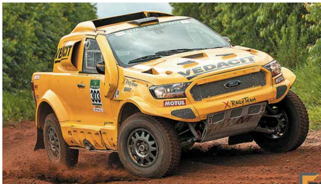
OFF-ROAD - Rally de Inverno terá a participação dos principais pilotos do off-road nacional

Etapa válida pelo Campeonato Brasileiro de Rally Cross Country e Baja deve reunir 80 competidores