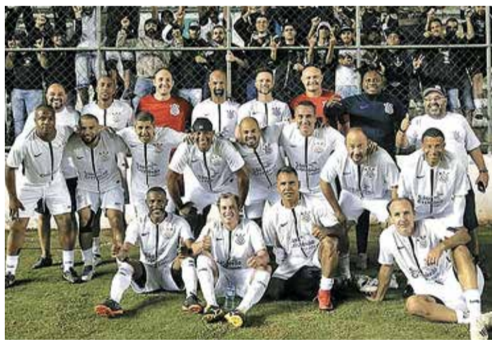
AMISTOSO - Evento jogo entre Master do Corinthians x Master de Lençóis Paulista

Para proporcionar um evento para toda família, a Secretaria de