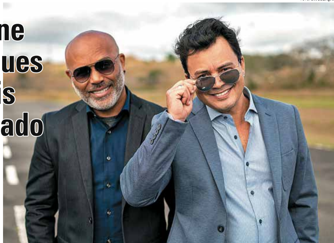
PARA OS MELHORES - Dupla Rick & Renner promete show animado do começo ao fim

“O público pode esperar uma grande noite. Nosso show é repleto de sucessos, com músicas românticas e dançantes que, com certeza, vão fazer todos dançarem e curtirem do começo ao fim”. É com essas palavras que Rick, da dupla Rick & Renner fala sobre o que espera para o show deste sábado (9), que marca a volta da dupla aos palcos de Lençóis Paulista. A apresentação é o ponto alto da festa do prêmio Melhores do Ano, que acontece a partir das 20h, no Clube Esportivo Marimbondo (CEM).