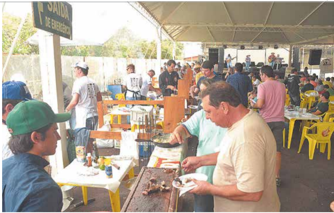
TRADIÇÃO - Queima do Cordeiro marca último dia da 32ª Expovelha