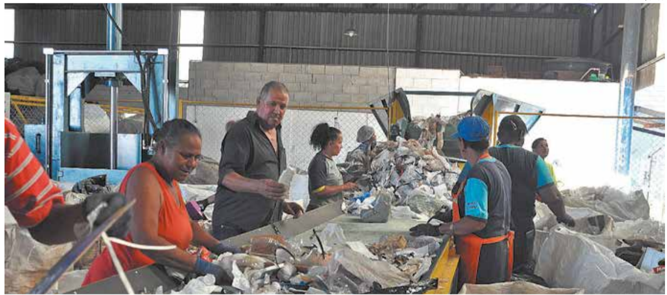
INVESTIMENTO - Novos equipamentos otimizam o trabalho no setor de reciclagem da Adefilp; na foto, associados da entidade

Os equipamentos - uma esteira de triagem, uma esteira de alimentação, uma prensa vertical, uma prensa horizontal e um carrinho plataforma - foram conquistados por intermédio do Rotary Club Cidade do Livro, que viabilizou a destinação de cerca de R$ 160 mil para a aquisição por meio do Fundo Mundial da Fundação Rotária.