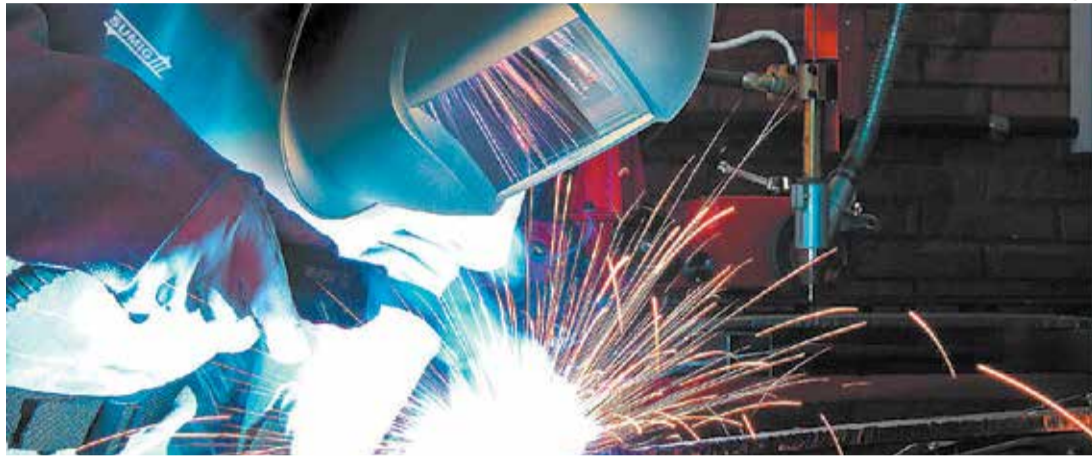
BOM MOMENTO - Indústria de transformação responde por mais da metade das vagas abertas neste ano

De acordo com levantamento feito pela reportagem do ECO, em 2011, em meio a um momento de significativa recuperação da economia, a cidade fechou o ano com superávit de 1.066 vagas (10.883 contratações e 9.817 demissões). De lá para cá, apenas três anos registraram bons resultados, mas nenhum deles perto da marca anterior. Em 2012 foram criados 893 postos de trabalho (10.540 contratações e 9.647 demissões). No