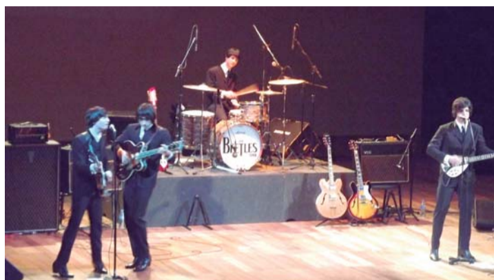
SHOW - The Beatles One é atração principal da Festa Junina Solidária

Assim como nos anos anteriores, a Prefeitura Municipal de Macatuba e as empresas parceiras custeiam toda a estrutura da festa (barracas, palco, som e shows), que tem caráter filantrópico, com a praça de alimentação e espaço kids sob responsabilidade das entidades, que comercializam os produtos a preço acessível e ainda