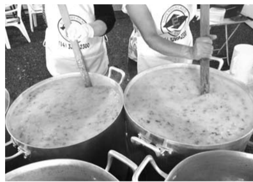
ÁGUA NA BOCA - Sopa de milho verde é uma das mais requisitadas na festa

A festa segue neste sábado (15) a partir das 17h (aos domingos o recinto abre às 15h) com diversas barracas, onde os visitantes podem encontrar os mais variados pratos, como bolo, cuscuz, doces, milho cozido, mini pizza, pamonha, panqueca, pastel, sopa e suco. Quem preferir, também pode fazer o pedido pelo disk entrega pelo telefone (14) 99717-1916.