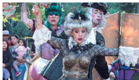
AGUDOS - Cia de Arte Barracão Cultural se apresenta hoje (15) no Seminário Santo Antônio

A entrada é gratuita. A retirada de convites deve ser feita na Secretaria de Educação e Cultura de Agudos, que fica na Avenida Sargento Andirás, 183, no Centro. Para saber sobre a disponibilidade de lugares e obter outras informações basta ligar para o telefone (14) 3262-1918. O Seminário Santo Antônio fica no quilômetro quatro do acesso Frei Gregório Johnscher.