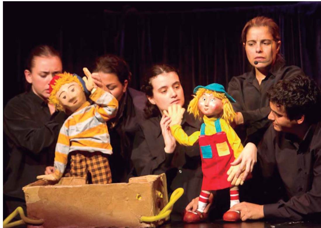
TEATRO DE BONECOS - Cia Truks se apresenta com "Senhor dos Sonhos" na quarta-feira (19)

A peça, que tem classificação indicativa livre, tem tradução simultânea para Libras (Língua Brasileira de Sinais). A entrada é gratuita e os ingressos podem ser retirados na recepção da Casa da Cultura Prof.ª Maria Bove Coneglian, que fica na Rua Sete de Setembro, 934, no Centro. Outras informações podem ser obtidas pelo telefone (14) 3263-6525. O Teatro Municipal Adélia Lorenzetti, fica na Rua Cel. Álvaro Martins, 790, na Vila Nova Irerê.