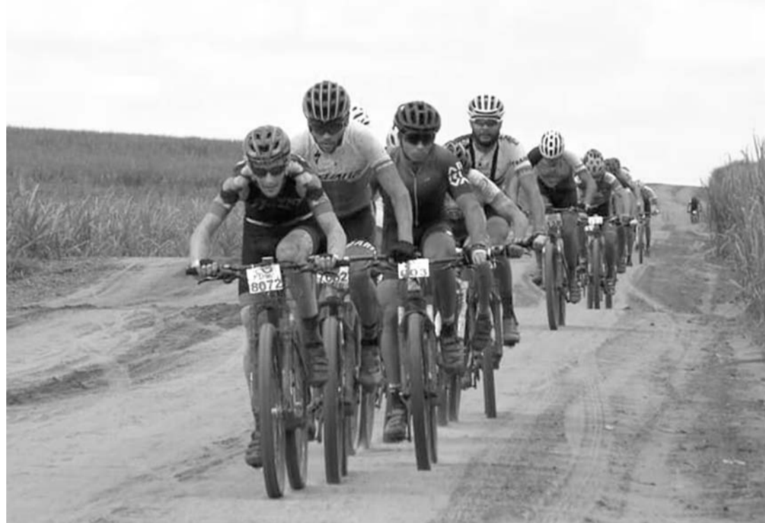
RESISTÊNCIA - 1º Rachão de Mountain Bike tem percurso de 46 quilômetros por trilhas de Lençóis Paulista

A competição está organizada em categoria única, envolvendo homens e mulheres. Em cada modalidade (masculina e feminina) serão premiados os dez primeiros colocados, mas o principal objetivo é pedalar e exercitar a solidariedade, já que a inscrição (R$ 10 por participante) também arrecada dois litros de leite por competidor para ajudar nas ações da Casa Abrigo