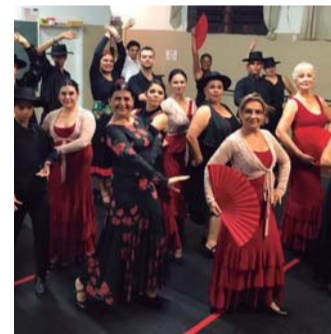
DANÇA - Grupo Tablado Flamenco traz no elenco integrantes de Lençóis Paulista e Bauru

Espectáculo é beneficente e terá toda a renda destinada à Casa Abrigo Amorada