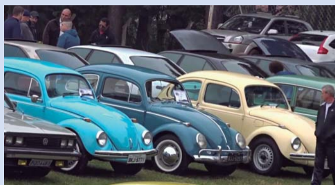
DOMINGO DOS POSSANTES - Macatuba é ponto de encontro de colecionadores e apaixonados por carros antigos neste domingo (16)

Além dos carros, camionetes e motocicletas, o encontro vai contar com o tradicional mercado de pulgas, que é como os amantes de carros antigos chamam o comércio de peças e acessórios usados. Os veículos ficam reunidos nos campos de futebol. Já a parte de cima do Centro de Lazer recebe as outras atrações, que se estendem até o período da noite.