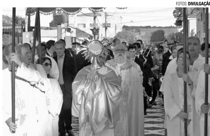
DEVOÇÃO - Paróquias da região celebram o Corpus Christi na quinta-feira (20)

Em Pederneiras, a partir das 16h, na Paróquia São Sebastião, tem santa missa seguida de procissão até o Asilo São Vicente de Paula. Nas paróquias Nossa Senhora Aparecida e São Judas Tadeu, as celebrações têm início às 8h, com a missa solene, em seguida os fiéis saem em procissão eucarística no entorno das igrejas. Na Capela Santa Isabel, no distrito de Vanglória,