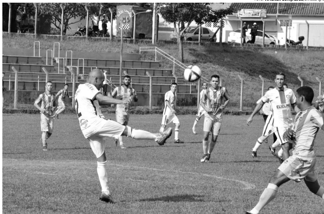
BOLA EM JOGO - Após vitória sobre Açaí, Asa Branca (uniforme branco) encara São Cristovão pela Série A

As equipes da Série B jogam apenas no domingo (23). No Estádio Municipal João Roberto Vagula (Vagulão), às 8h, o Unidos da Vila enfrenta o Reduto. Às 10h, duelam Grêmio da Vila e MA FC. No campo do Centro Esportivo Zéfiro Orsi (Jardim Ubirama), às 8h, o Chape encara o Capital. Às 10h, entram em campo Esportivo União e Real Lençóis. Na Cecap, às 8h, o Liverpool joga contra o Guarani. Às 10h, medem forças Esperantina e Nacional. Em Alfredo Guedes, às 8h, o Paulista pega o União Primavera. Às 10h, jogam Alfredo Guedes e Atlético Kaju.