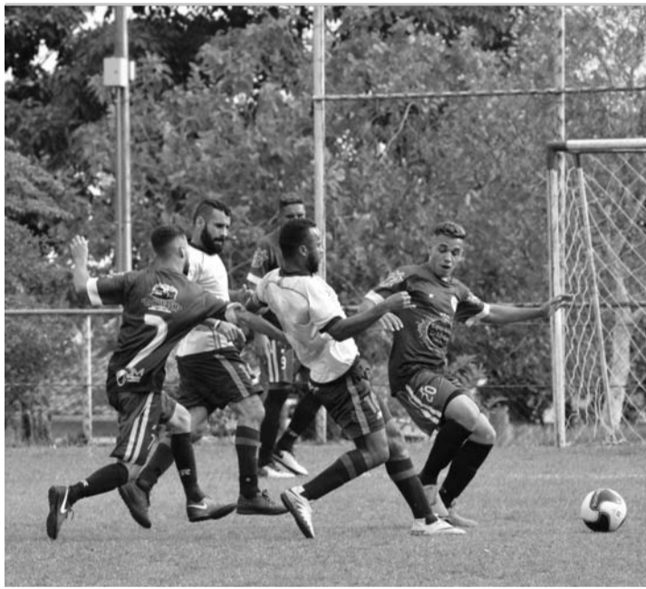
HORA DA DECISÃO - Asa Branca (camisa clara) e Estrela Várzea brigam pelo troféu no Jardim América

retamente com o departamento de esportes do Clube Marimbondo. O telefone para contato é o (14) 3269-3400. O CEM fica na Avenida Brasil, 1039, no Centro de Lençóis Paulista.