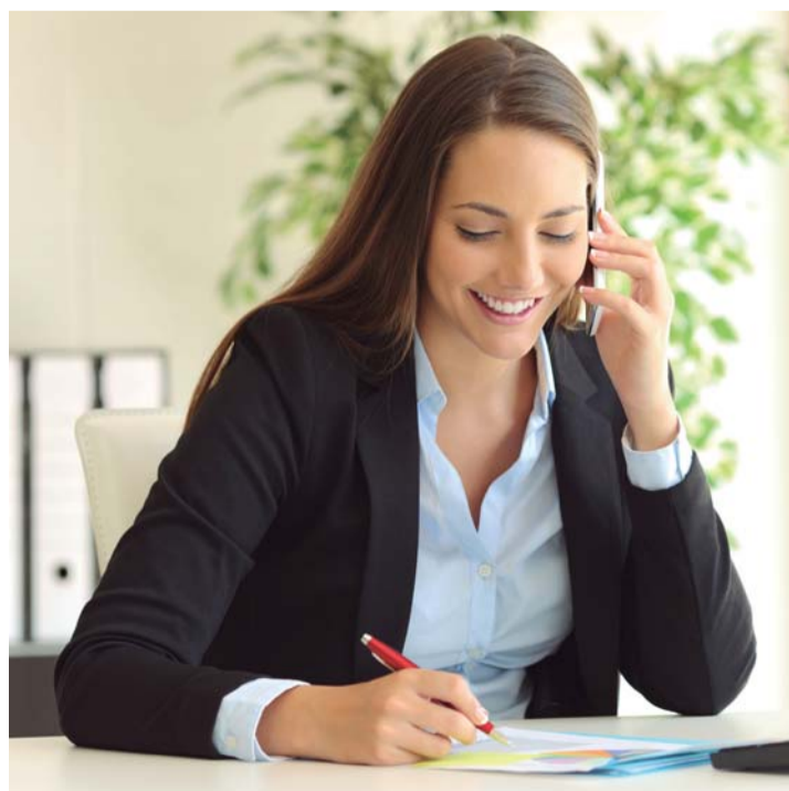
MEDLINE - Atendendo pelo número 0800 772 3772, serviço funciona 24 horas por dia, sete dias por semana

O MedLine coloca em prática os mais modernos conceitos da Telemedicina, reconhecidos pela classe médica no Brasil e no mundo com procedimentos validados pelo ATA (American Telemedicine Association). O sistema opera em conformidade com as Resoluções do CFM (Con-