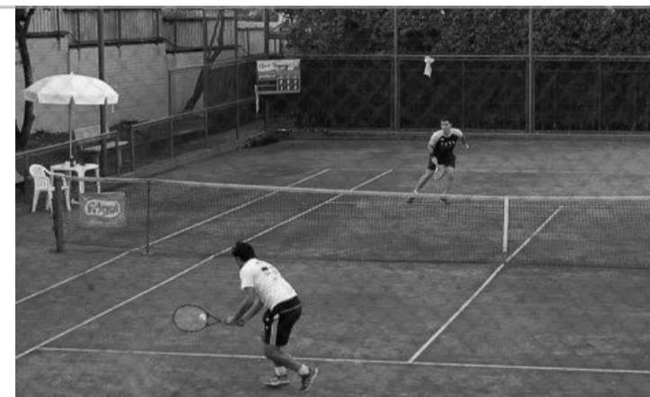
EM QUADRA - Atletas profissionais e amadores disputam open Frigol de Tênis 2019

ções e esclarecer dúvidas sobre as inscrições, regulamento ou demais questões relacionadas ao Open Frigol de Tênis 2019, basta acessar o site mencionado acima ou entrar em contato di-