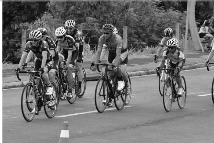
CIRCUITO - Prova acontece na região do Parque do Povo; na foto, etapa realizada no ano passado

prova contempla 13 categorias: Infantojuvenil (até 14 anos), Juvenil Masculino (15 a 16 anos), Júnior Masculino (17 a 18 anos), Júnior Feminino (até 18 anos), Elite Masculino (19 a 29 anos - com critério técnico), Elite Feminino (a partir de 19 anos), Sub-30 (19 a 29 anos), Sênior A (30 a 39 anos), Sênior B (40 a 49 anos), Máster A (50 a 59 anos), Máster B (a partir de 60 anos), Mountain Bike (livre) e Iniciantes (atle-