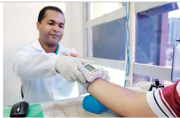
PRESSÃO ALTA - Segundo estudo, hipertensão afeta pelo menos um a cada quatro adultos no Brasil

O Sistema Único de Saúde (SUS) oferece gratuitamente medicamentos nas Unidades Básicas de Saúde e pelas unidades farmacêuticas creden-