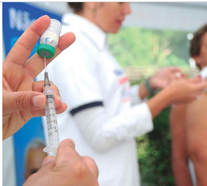
ABAIXO DA META - De acordo com último levantamento, índice de cobertura ainda está abaixo dos 50% em Lençóis Paulista

bado (18), equipes estarão a postos para vacinar pessoas interessadas em três pontos da cidade. Os lençoenses poderão receber a vacina sem que isso atrapalhe as compras programadas em supermercados. Os agentes da saúde estarão na loja do Supermercado Santa Catarina (Núcleo Habitacional Luiz Zillo), Supermercado Azulão (Cecap) e Supermercado Jáú Serve (loja 2, Asilo). Nesses três supermercados a vacina estará à disposição dos