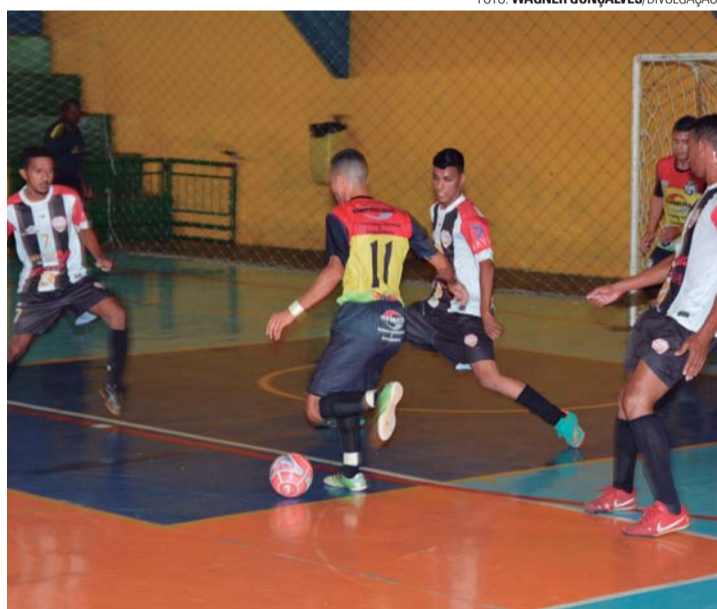
DIRETO - Com vitória sobre Reduto, Unidos do Júlio Ferrari (mangas escuras) garantiu primeiro lugar do Grupo 8 e passou direto para a semifinal

A competição promovida pela Secretaria de Esportes e Recreação de Lençóis Paulista segue com mais dois jogos decisivos na noite desta quarta-feira (3). Às 19h30, pela Série Prata, jogam Atlético Kaju (2º G7) e Reduto (3º G8). Às 20h20, pela Série Ouro, duelam UME (2º G5) e Santa Luzia (3º G6). Na sexta-feira (5), pela Série Prata, às 19h30, se enfrentam Valência (3º G7) e Carniça FC (2º G8). Às 20h20, pela Série Ouro, entram em