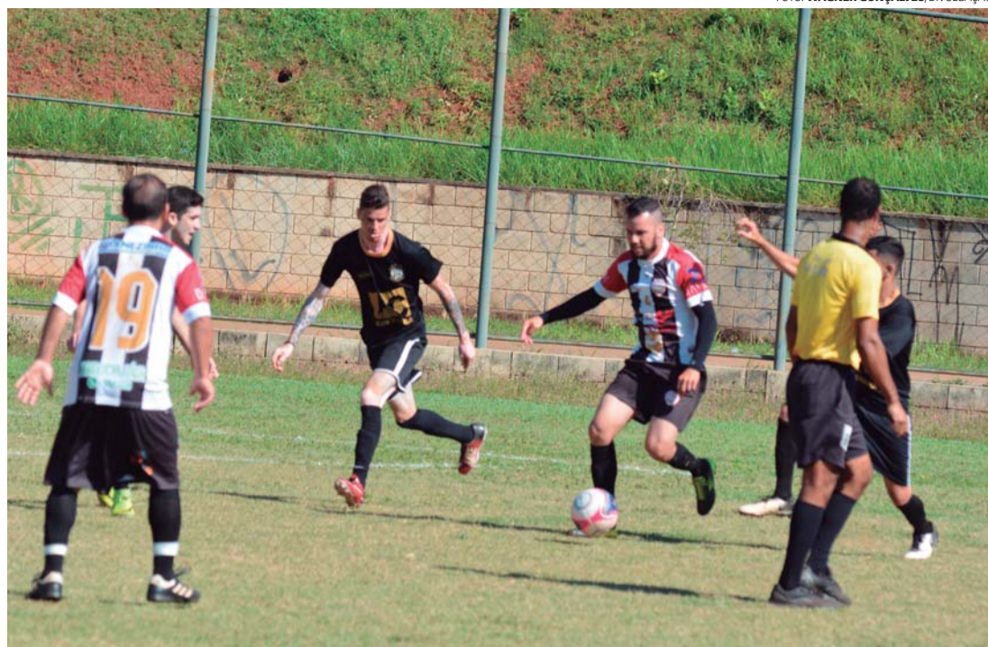
CLASSIFICADO - Reduto (camisa listrada) avança e decide vaga na semifinal contra o Unidos do Júlio Ferrari

Os primeiros embates das quartas de final acontecem no domingo (7), na Cecap. Abrindo a rodada, às 8h, o Unidos do Júlio Ferrari (1º G1), que carimbou seu passaporte para a próxima fase vencendo o Atlético Kaju (2º G8) por 4 a 0, enfrenta o Reduto. Na sequ-