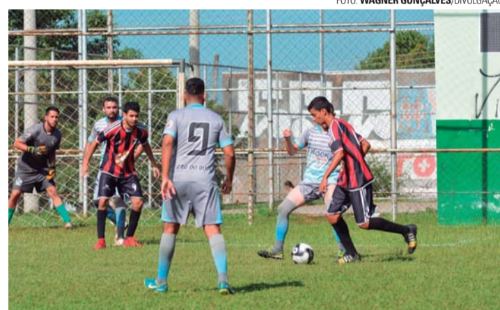
SEGUNDA FASE - Renegados (camisa listrada) estreia contra o Jardim América

As duas primeiras colocações do Grupo C ficaram com Asa Branca e Jardim América, com nove e seis pontos. No Grupo D os classificados foram Renegados e Mercenários, ambos com sete pontos - o Renegados venceu nos critérios de desempate. No Grupo