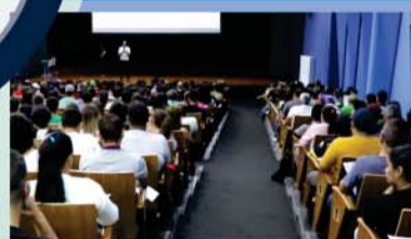
1600 pessoas formadas em Ajudante Geral para ampliação industrial na cidade