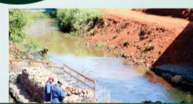
Reconstrução de passarela do Jardim Primavera