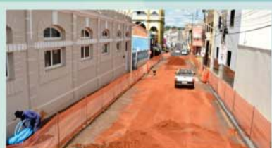
Obras de alargamento das calçadas da Rua 15 de Novembro