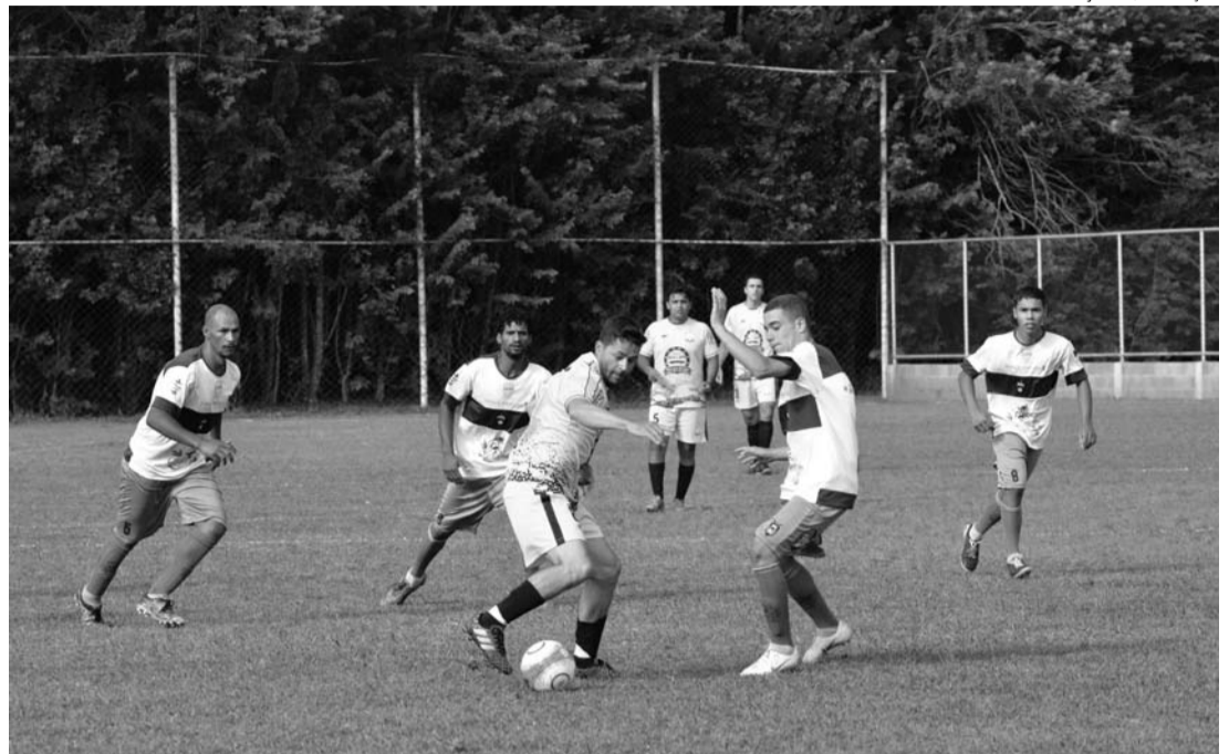
CONFRONTO - Santa Luzia (uniforme claro) decide vaga na semifinal contra o Açaí