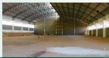
Finalização das obras do ginásio paradesportivo da Adefilp