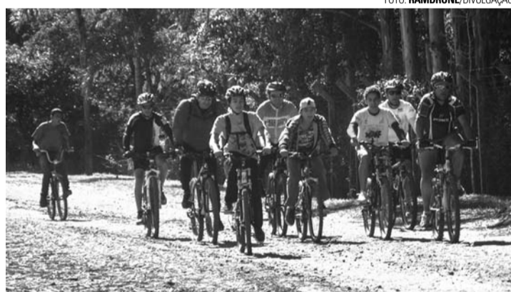
AVENTURA - Desafio Mountain Bike Lençóis Paulista a Pratânia tem percurso de 70 quilômetros

A aventura conta com percurso composto por trilhas de média e alta complexidade por estradas rurais dos dois municípios. O trajeto tem cerca de 70 quilômetros de extensão