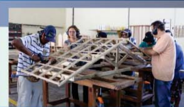
CMFP formou mais de 1500 pessoas no ano passado em áreas como carpintaria e construção

PARCELA ÚNICA vencimento com 10% de desconto 15/04