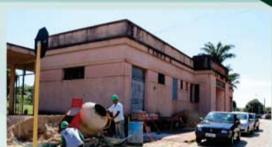
Restauração da Estação Sorocabana para receber o Terminal Rodoviário Interbairros