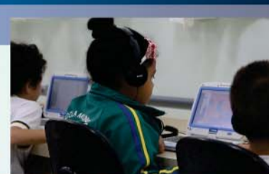
Informática é usada para melhorar conhecimento em matemática na rede pública