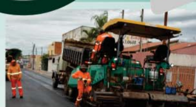
Recape de mais de 70 vias com investimento de mais de R$ 3 milhões