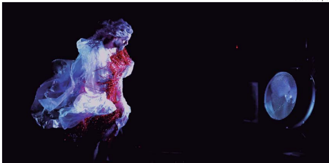
TENTATIVAS CONTRA O VENTO - Espetáculo une estruturas corporais com o uso de materiais plásticos

"Tentativas contra o vento" é um solo em dança do ator e