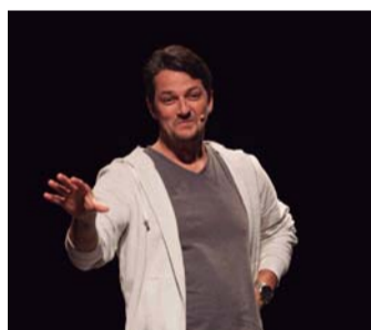
NO PALCO - Marcelo Serrado chega a Lençóis com a peça "Atormentado"

Conhecido em nível nacional pelos marcantes papéis que representou na TV, cinema e teatro, Marcelo Serrado protagoniza o espetáculo "Atormentado", no qual discorre sobre relacionamentos, política e internet de uma maneira muito bem-humorada. Em cena, o ator também aborda, com uma visão divertida e crítica, o momento atual do país, reservando espaço