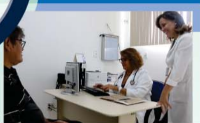
ESFs realizaram mais de 184 mil consultas em 2018