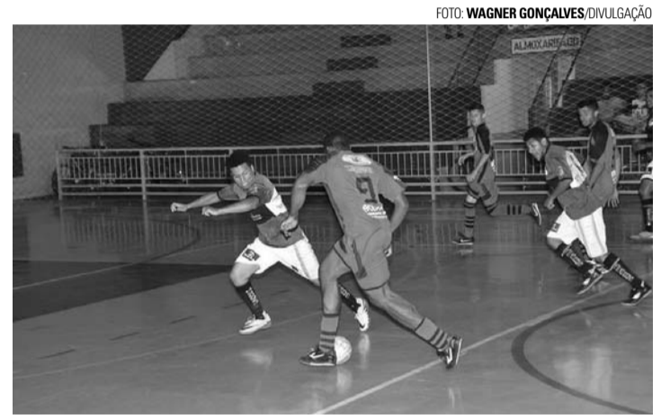
RETA FINAL - Campeões da Copa Lençóis de Futsal serão conhecidos no dia 17

De acordo com a tabela divulgada pela Secretaria de Es-