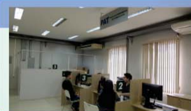
PAT realizou quase 7 mil encaminhamentos de currículos ou candidatos para entrevistas