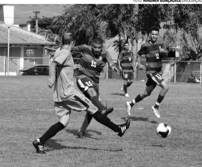
EM CAMPO - Borebi (camisa listrada) estreia na segunda fase contra o Real Madruga

Final da competição está prevista para o dia 18 de maio