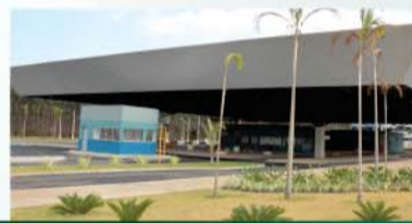
Investimento de R$ 1,5 milhão para entrega de novo Terminal Rodoviário