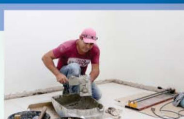
Reforma e pintura de 10 unidades de saúde, um benefício para usuários e servidores