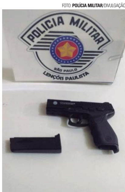
FOGO - Pistola apreendida por PM