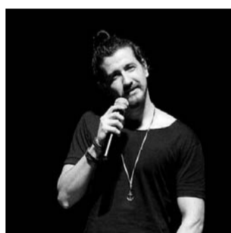
HUMOR – Teatro Municipal recebe show de stand up com humorista Afonso Padilha

Indicado para maiores de 14 anos, o espetáculo tem duração de 1h10 minutos. Os ingressos custam R$ 30 (estudante) e R$ 60 (inteira) e R$ 45 (antecipado no lote promocional). Eles podem ser adquiridos pelo site www.vargasingressos.com.br ou nos pontos de venda: Rádio Ventura FM e Casa da Cultura Prof.ª Maria Bove Coneglian. Outras informações podem ser obtidas pelo telefone (14) 3263-