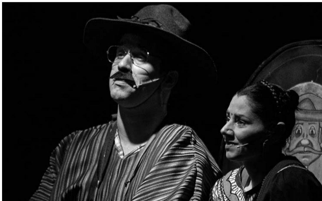
CIA DE COPAS – Grupo teatral se apresenta no Teatro Municipal com a peça “Pequena Magdalena”

Inspirada na vida da pintora mexicana Frida Kahlo (1907-1954), a peça “Pequena Magdalena”, retrata temas como superação, diferenças, amizade, igualdade de gênero e sobre a cultura mexicana e sua forma peculiar de encarar a morte. Uma história que traz a infância de Frida, a pequena Magdalena, para contar aos pequenos uma história sobre aceitação, superação e respeito às diferenças, além de temas que, hoje, cada vez mais, estão ligados à figura da artista, como igualdade de gênero e empoderamento feminino. Criada pela Cia de Copas