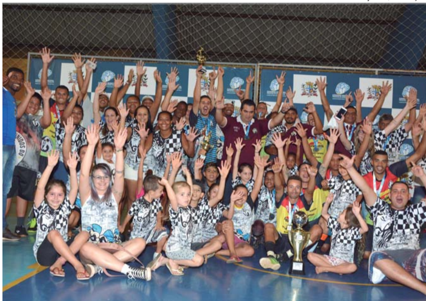
CELEBRAÇÃO - Atletas e familiares da equipe Unidos do Júlio Ferrari celebram o título