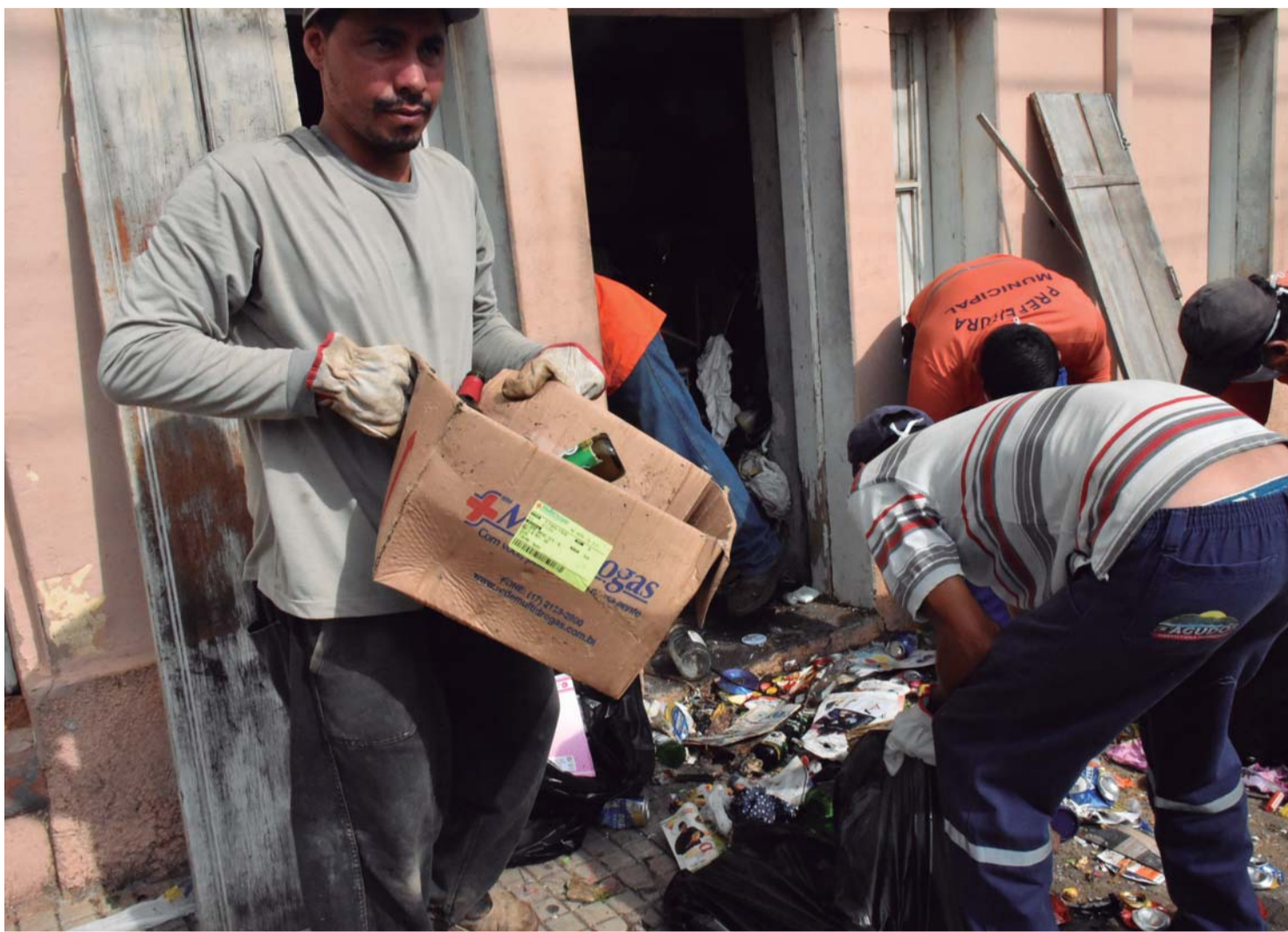
COMBATE - Em estado de epidemia, Agudos segue tentando eliminar os criadouros de dengue

Até o momento foram confirmados 13 casos, quatro contraídos no município