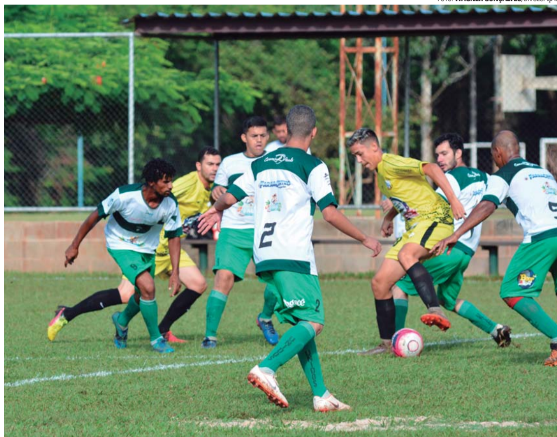
FOME DE GOL - Santa Luzia (uniforme amarelo) foi um dos destaques da rodada, com goleada de 7 a 0 sobre o Unidos da Vila

Por conta do Carnaval, os próximos jogos serão disputados apenas no domingo (10). No Vagulão, às 8h, pelo Grupo 5, jogam Açaí e Alfredo Guedes. Às 10h, pelo Grupo 6, se enfrentam Asa Branca e Esperantina. Na Cecap, às 8h, pelo Grupo 7, entram em campo Grêmio Cecap e Reduto. Às 10h, pelo Grupo 8, duelam União Paulista e Esportivo União. No Jardim Ubirama, às 8h, pelo Grupo 1, jogam Capital e Unidos. Às 10h, pelo Grupo 2, medem forças Guarani e Atlético Lençóis.