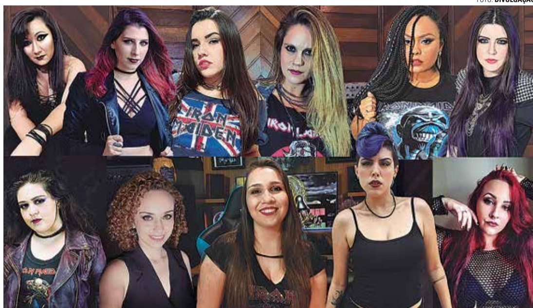
ACES HIGH - Tributo à banda Iron Maiden contou com a participação de 11 vocalistas

Cada 1 mil visualizações recebidas pelo vídeo até este domingo (20) serão converti-