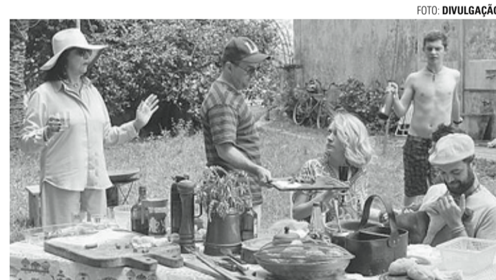
DOMINGO - Filme que retrata dia da posse do ex-presidente Lula será exibido pelo Pontos MIS

Após sessão do longa, tem debate no Youtube, que pode ser vista hoje e amanhã