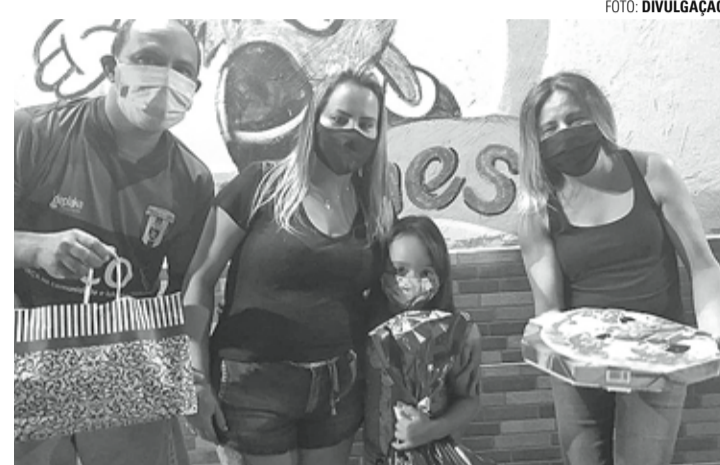
PROJETO - Concurso feito com patrocínio da Frigol distribuiu diversos prêmios aos participantes

Iniciativa contou com patrocínio da Frigol; 47 crianças participaram