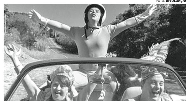
CINEMA EM CASA - Museu da Imagem e do Som exhibe filme "Colegas" neste sábado

Após sessão, a partir das 18h, tem bate-papo ao vivo com especialistas