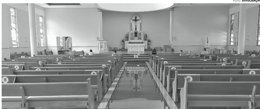
COM SEGURANÇA - Com lugares marcados e agendamento, paróquia pode receber até 100 fiéis por missa; na foto Igreja São Pedro e São Paulo

As missas do Santuário acontecem às segundas, terças, quintas e sextas-feiras, às 19h30, quartas, às 15h, aos sábados, às 15h e 19h30, e aos domingos, às 9h30, 17h e 19h30. Na Paróquia São Pedro e São Paulo as celebrações são às terças e quintas-feiras, às 19h30, aos sábados às 18h, e aos domingos, às 7h30, 9h30 e 19h. Nas noites de sábado as missas têm transmissão pela internet.