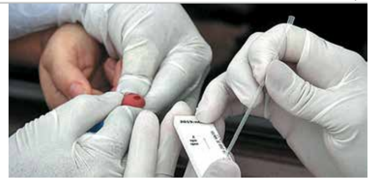
QUEDA NA TRANSMISSÃO - Pela primeira vez, Censo Covid indica redução de contágio entre pacientes assintomáticos

Entre as 49 pessoas que testaram positivo, mas já estavam recuperadas, a maior incidência ocorreu entre 55 e 59 anos e 25 e 29 anos, com sete e seis casos, respectivamente. Segundo a Secretaria de Saúde, 37 pessoas passaram