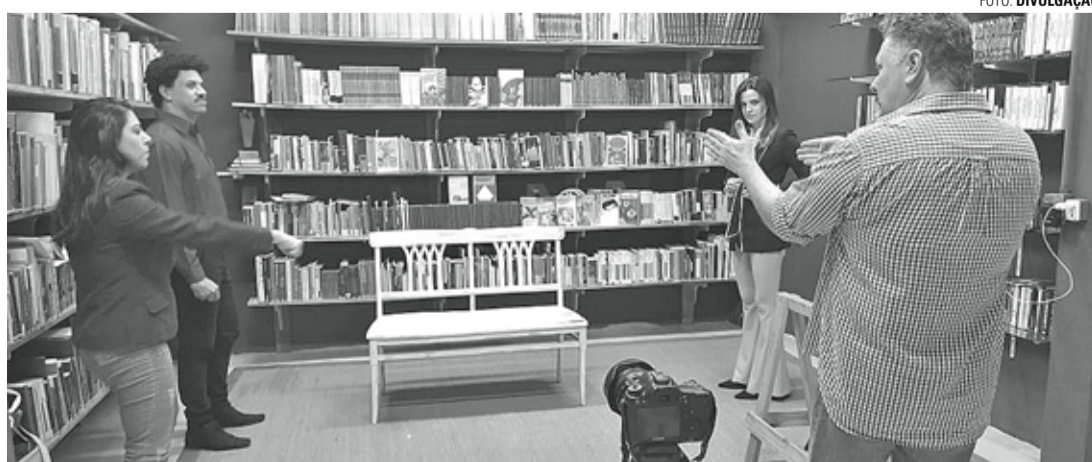
ATOS & CENAS - Cia Teatral busca apoio para nova edição do projeto "Porquê ler escritos e escritores lençoenses"

Na primeira série, que se encerrou nessa quinta-feira (27), o grupo conseguiu patrocínio de