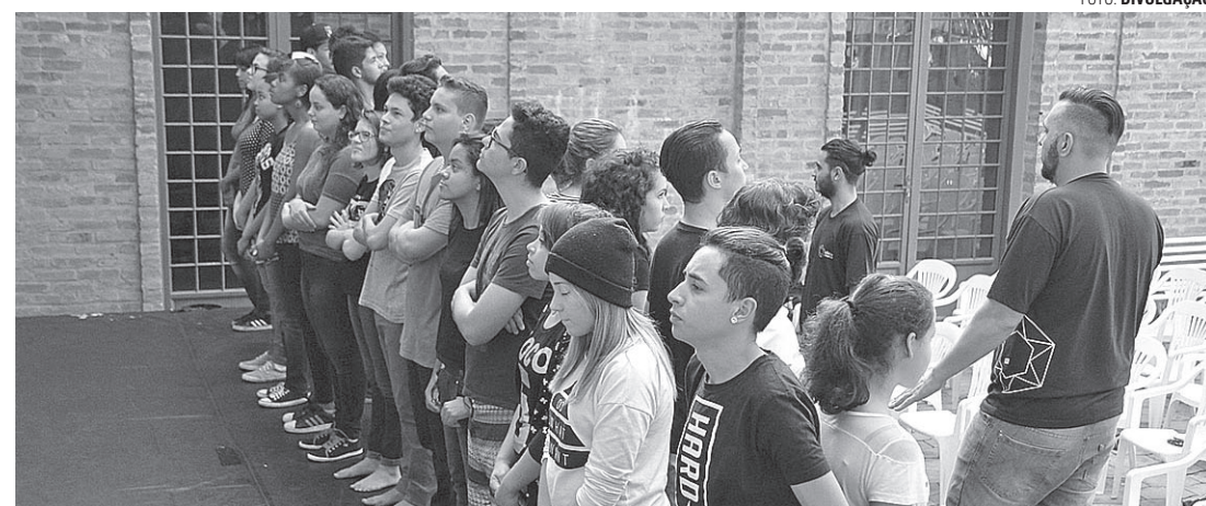
DISTANCIAMENTO - Encontros presenciais estão previstos apenas para o ano que vem

As atividades foram iniciadas na última terça-feira (14), pela internet, o que permite a participação de todos os inscritos e não apenas dos 60 selecionados, como ocorria nas atividades presenciais. O cronograma virtual deve seguir até janeiro de 2021, mas os encontros presenciais podem ser retomados antes, caso haja liberação pelas autoridades sanitárias.