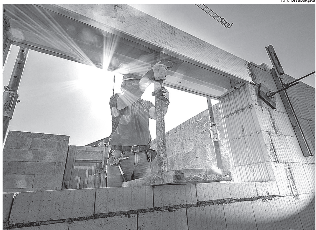
EM ALTA - Construção civil segue em bom momento e contribui para a manutenção do emprego em Lençóis

Apenas em maio foram gerados 230 novos postos de trabalho em Lençóis Paulista (845