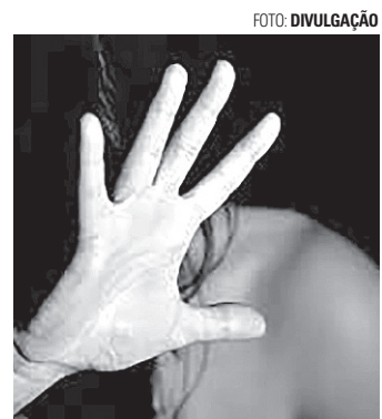
FLAGRANTE - Homem agride ex-companheira e faz ameaça de morte contra a mesma

O socorro foi acionado e as vítimas foram encaminhadas à UPA (Unidade de Pronto Atendimento). A Polícia Militar realizou diligências a fim de encontrar o autor das agressões, que não teve a identidade informada. Momentos depois, o homem teria se dirigido à unidade de saúde ameaçando de morte sua ex-companheira, mas novamente fugiu antes da