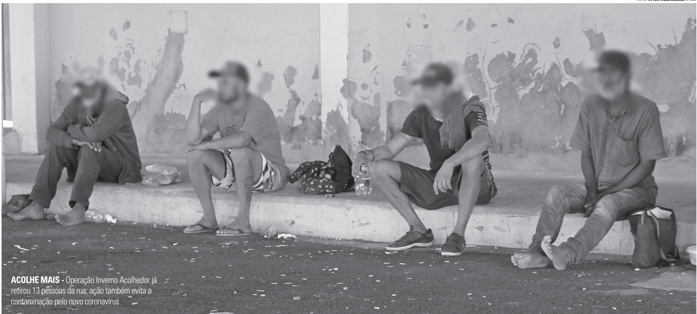
ACOLHE MAIS - Operação Inverno Acolhedor já retirou 13 pessoas da rua; ação também evita a contaminação pelo novo coronavírus