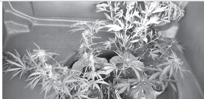
MACONHA - Apreensão de mudas foi feita em meio ao canavial