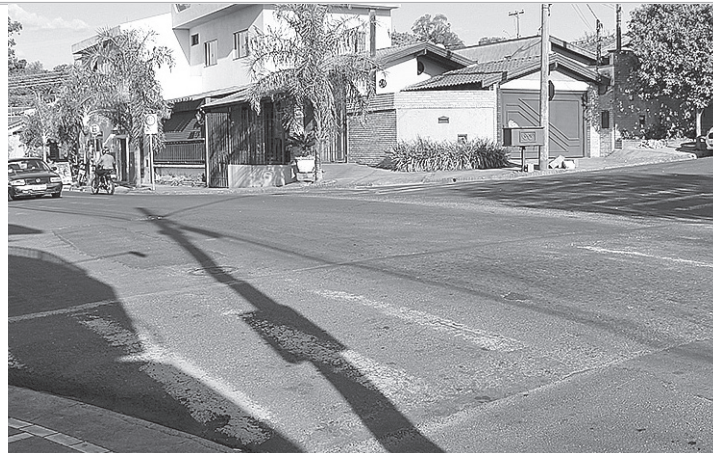
ACIDENTE - Atropelamento foi registrado na Rua Guaianazes

De acordo com informações registradas pela 5ª Cia da Polícia Militar, o acidente ocorreu por volta das 15h20. O condutor da motocicleta, uma Honda/Biz, que estava no local dos fatos quando a equipe policial chegou, revelou que o atropelamento aconteceu após ele passar por um quebra-molas que não estava devidamente sinalizado. Também alegou que