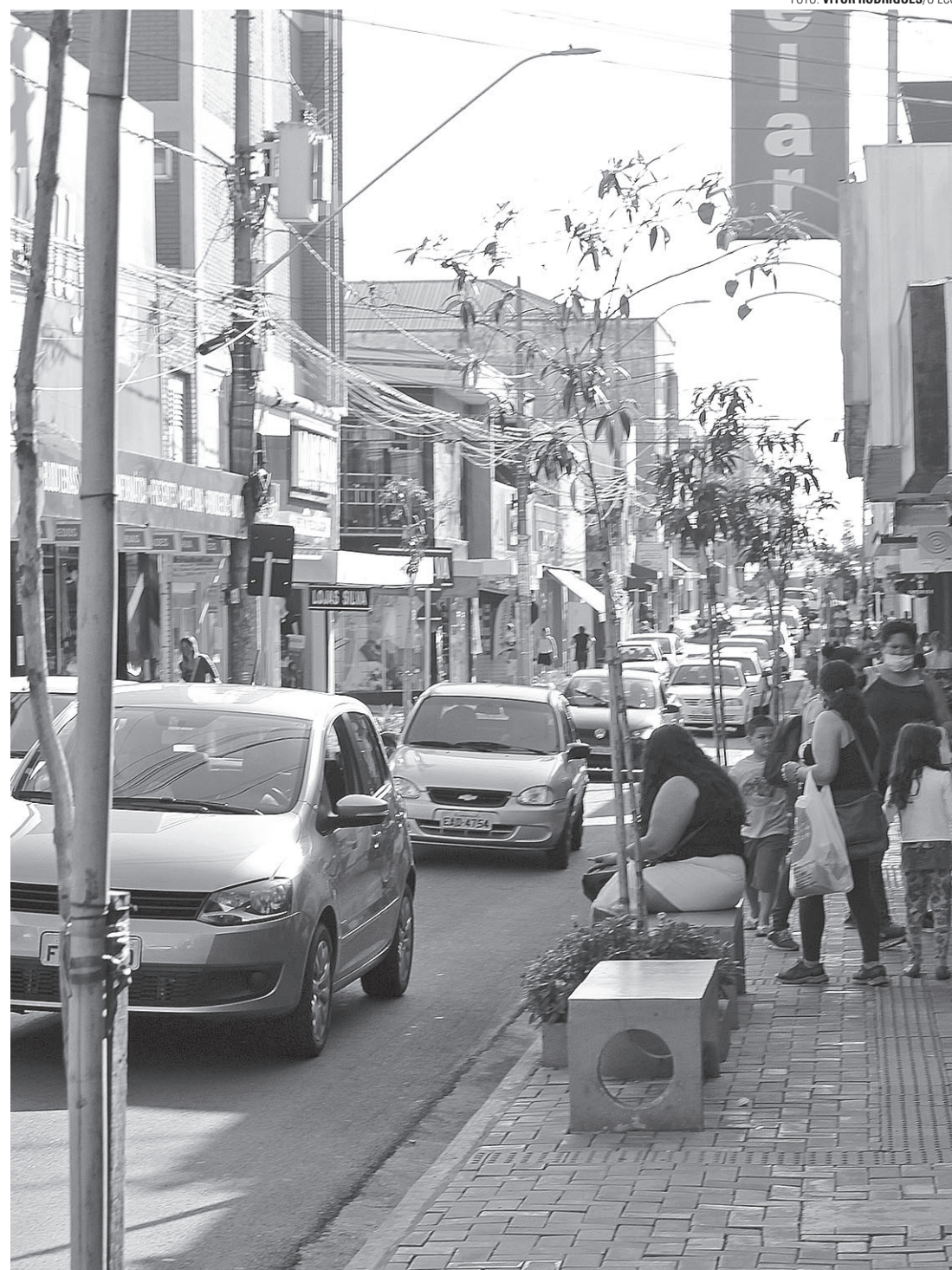
OTIMISMO - Lençóis Paulista espera avançar para Fase Amarela do Plano São Paulo

Em Macatuba o cenário é o mesmo. Na Fase Laranja, os comerciantes têm mais liberdade para trabalhar, voltam a atender presencialmente o público, mesmo que por tempo reduzido (os estabelecimentos podem funcionar até seis horas diárias, desde que fechem durante três dias da semana), o que representa um grande avanço. "Se todos continuarem colaborando, a tendência é que nós evoluamos mais uma fase daqui uma semana. Mas é bom deixar claro que todas as medidas de prevenção e o distanciamento entre as pessoas devem ser respeitados. Vamos caminhar à normalidade para que a economia possa aquecer novamente", garante o prefeito