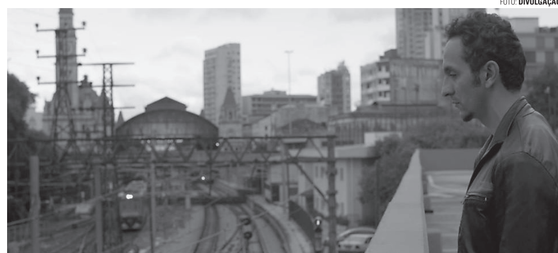
OBRA - Filme dirigido por Gregório Graziosi vai ao ar a partir das 16h

Dirigido por Gregório Graziosi, "Obra" revela a solidão em São Paulo. No filme, o arquiteto João Carlos, às vésperas