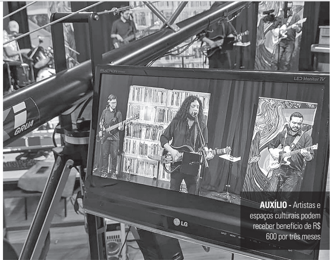
AUXÍLIO - Artistas e espaços culturais podem receber benefício de R$ 600 por três meses

A Lei de Emergência Cultural Aldir Blanc, que levou este nome em homenagem ao compositor e escritor brasileiro que morreu em maio, vítima do novo coronavírus, estabelece um conjunto de ações para ga-