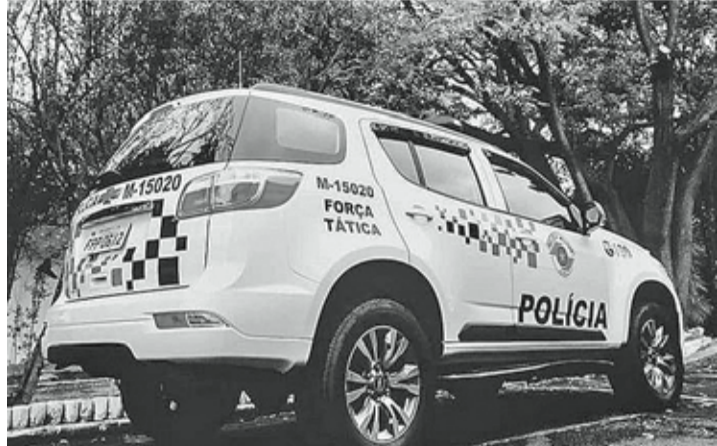
PATRULHAMENTO - Equipe completa da 5ª Cia da Polícia Militar está diariamente nas ruas para coibir eventuais crimes

As estatísticas revelam redução, principalmente, nos crimes de furto e roubo. Entre janeiro e junho desse ano foram registrados 346 furtos, o que representa redução de 16% em relação ao mesmo período de 2019, quando foram registrados 414 casos. Coinci-