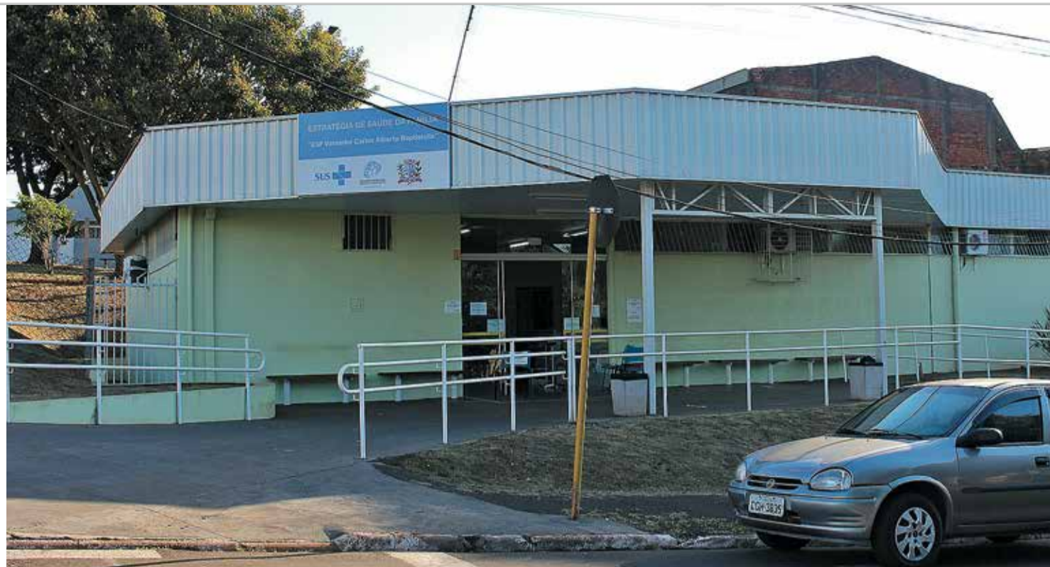
CENTRAL DE TESTAGEM - Secretaria de Saúde deve concentrar testagem de assintomáticos na ESF da Vila Maria Cristina

Nesta etapa do Censo Covid foram realizados testes em pessoas de todas as faixas etárias, desde recém-nascidos a idosos, sendo que 14% dos que compareceram tinham mais de 65 anos. Dos 189 casos positivos,