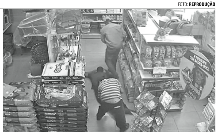
FLAGRANTE - Câmeras de segurança registraram toda a ação dos bandidos

Segundo informações obtidas pela reportagem do Jornal O ECO junto à 5ª Cia da Polícia Militar, o roubo aconteceu por volta das 10h, quando dois indivíduos armados com revólver e sem capuz entraram na loja e anunciaram o assalto. Um funcionário foi deitado no chão e