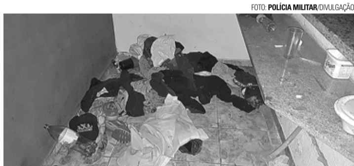
FISCALIZAÇÃO - Local da ação tem sido ocupado por moradores de rua e usuários de drogas de Lençóis Paulista

Ação foi desencadeada a fim de coibir a prática de crimes em local ocupado por moradores de rua e usuários de drogas