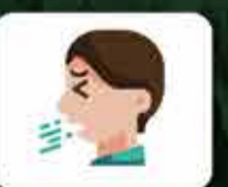
Gotículas de saliva