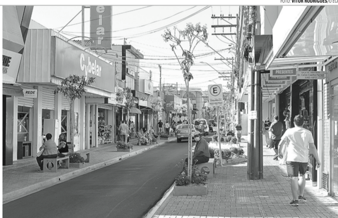
MAIOR RIGIDEZ - Com região rebaixada para Fase 2, mais restrições foram impostas às atividades não essenciais

Vale lembrar que o Plano São Paulo é dividido em cinco fases: Fase 1 (Vermelha) - somente atividades essenciais; Fase 2 (Laranja) - abertura com restrições; Fase 3 (Amarela) - ampliação das atividades; Fase 4 (Verde) - diminuição das restrições; e Fase 5 (Azul) - funcionamento total. As normas do estado autorizam prefeitos de cidades a conduzir e fiscalizar a flexibilização de setores segundo as características dos cenários locais. Os pré-requisitos para a retomada são