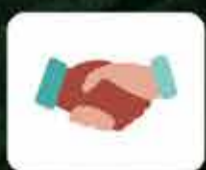
Contato físico (aperto de mãos, abraços, beijos)