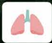
Dificuldade para Respirar