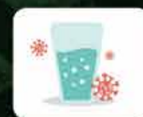
Contatos com superfícies contaminadas