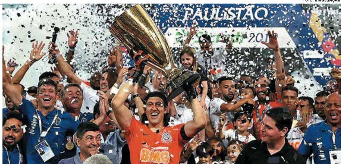
TIMÃO - Atual campeão é o Corinthians, que na final de 2019 derrotou o São Paulo por 2 a 1 no placar agregado

De acordo com o regulamento, na semifinal os dois times com as melhores campanhas na classificação geral pegam os dois com as piores campanhas (1º x 4º; 2º x 3º). Os vencedores se enfrentam em jogos de ida e volta na grande decisão, que vale prêmio de R$ 5 milhões para o campeão. O atual detentor da taça é o Corinthians, que na final do ano passado superou o São Paulo