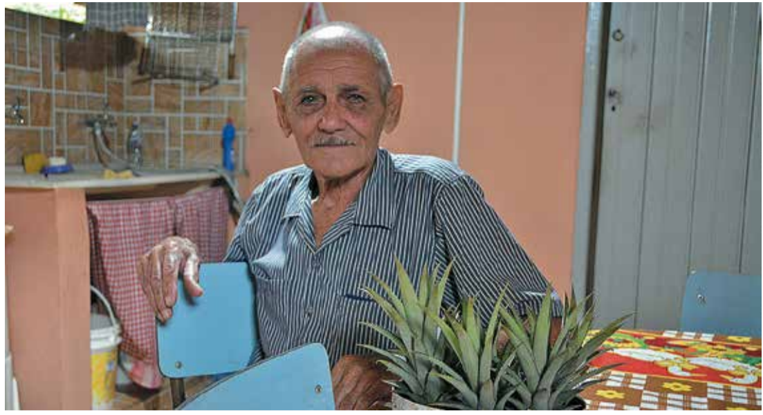
RITUAL - Há quatro décadas, idoso planta seus abacaxis depois do Natal para fazer a colheita no ano seguinte

• LENÇÓIS PAULISTA, SÁBADO, 4 DE JANEIRO DE 2020 • ANO 82 • EDIÇÃO Nº 7.832 •