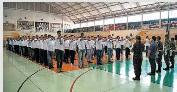
JURAMENTO - Em Lençóis Paulista, cerimônia para a entrega dos Certificados de Dispensa de Incorporação acontece no Csec

O alistamento também pode ser feito diretamente nas Juntas de Serviço Militar dos respectivos municípios a partir da segunda-feira (6). Neste caso, é necessário comparecer aos locais portando RG, CPF, comprovante de escolaridade, comprovante de residência em nome do requerente, da mãe ou do pai. Em Lençóis Pau-