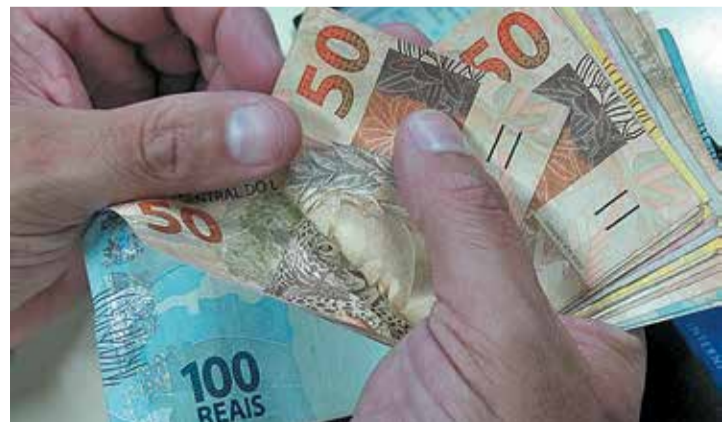
MÍNIMO - Mesmo ultrapassando pela primeira vez a barreira dos R$ 1 mil, salário ainda está bem abaixo do considerado ideal pelo Dieese

O reajuste do salário mínimo foi de 4,1%, que corresponde ao acumulado da inflação de 2019, de acordo com o Índice Nacional do Preços ao Consumidor (INPC), apurado pelo Instituto Brasileiro de Geografia