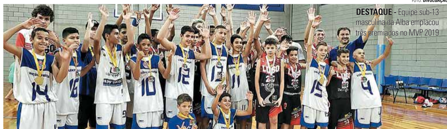
DESTAQUE - Equipe sub-13 masculina da Alba emplacou três premiados no MVP 2019

A LBC (Liga de Basquete do Centro-Oeste Paulista) divulgou no último dia 24 de dezembro, véspera de Natal, a lista do MVP 2019, com os atletas e técnicos que mais se destacaram na temporada passada. Lençóis Paulista marcou presença com sete premiados, sendo cinco no masculino e dois no feminino.