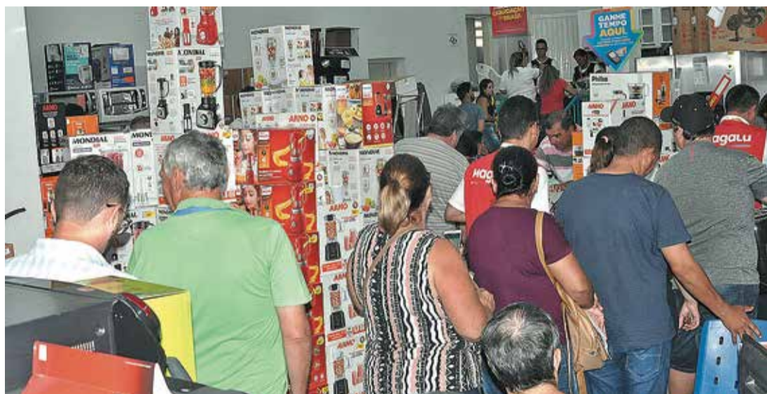
CASA CHEIA - Liquidações atraem consumidores à lojas do Centro de Lençóis Paulista

Os lojistas garantem que os descontos estão valendo a pena. "A loja abriu às 6h. Já é uma promoção que os clientes passam o ano todo esperando. Alguns chegam de madrugada para garantir as compras. São 27 anos de tradição. Os descontos vão até 70% em produtos do mostruário. E para quem não conseguiu vir até a loja, as