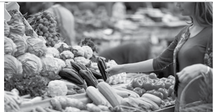
HORA DA FEIRA - Setor de hortifruti foi o único que apresentou redução de preço neste ano

Apesar disso, lista com os principais itens de consumo chega a custar R$ 1.137,37 em Lençóis