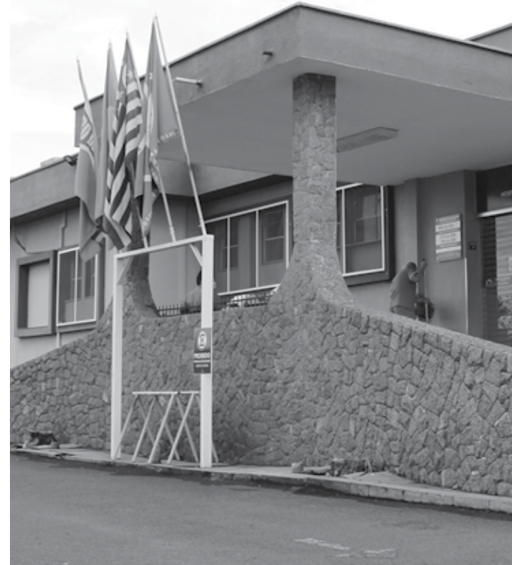
MAIOR FATIA - Hospital Piedade deve receber repasse de quase R$ 3,3 milhões para custeio de serviços em 2022

Os demais contratos foram reajustados em cerca de 10%, com pequenas variações resultantes de arredondamentos. Os maiores repasses beneficiam a Ação da Cidadania Contra a Fome, a Miséria e