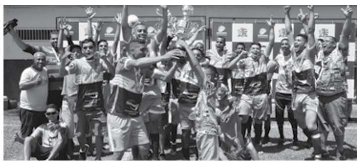
CAMPEÕES - Athleticano Lençoense e União Primavera foram coroados com os títulos da temporada 2021