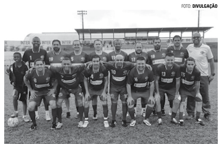
AMISTOSO - Veteranos da Ferroviária de Araraquara (foto) enfrentam time master de Macatuba

Partida entre Master Atlético Clube e veteranos da Ferroviária de Araraquara acontece neste domingo (19)