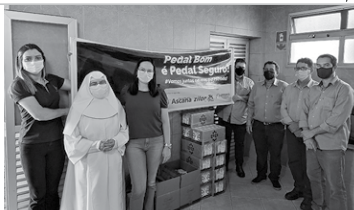
EM BOA HORA - Leite arrecadado em evento foi destinado a cinco entidades de Lençóis, Macatuba e Pederneiras

diantes a doação de um litro de leite longa vida, a organização conseguiu uma grande mobilização dos participantes, que, tomados pelo espírito solidário, contribuíram para a arrecadação de mais de 1 mil litros de leite, cinco vezes mais do que o previsto. O sucesso da campanha beneficiou cinco entidades das cidades da área de atuação da Ascana, que receberam 200 litros de leite cada.