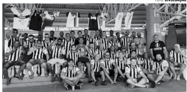
REENCONTRO - Torcida se reuniu para relembrar os velhos tempos do saudoso CAL

Enquanto o desejado retorno triunfal do time alvinegro segue apenas como um sonho distante, os integrantes da Aranha Negra se reúnem anualmente para relembrar os velhos tempos. No ano passado, por conta das restrições impostas pela pandemia do novo coronavírus (Covid-19) não houve confraternização, porém, no último sábado (11), os