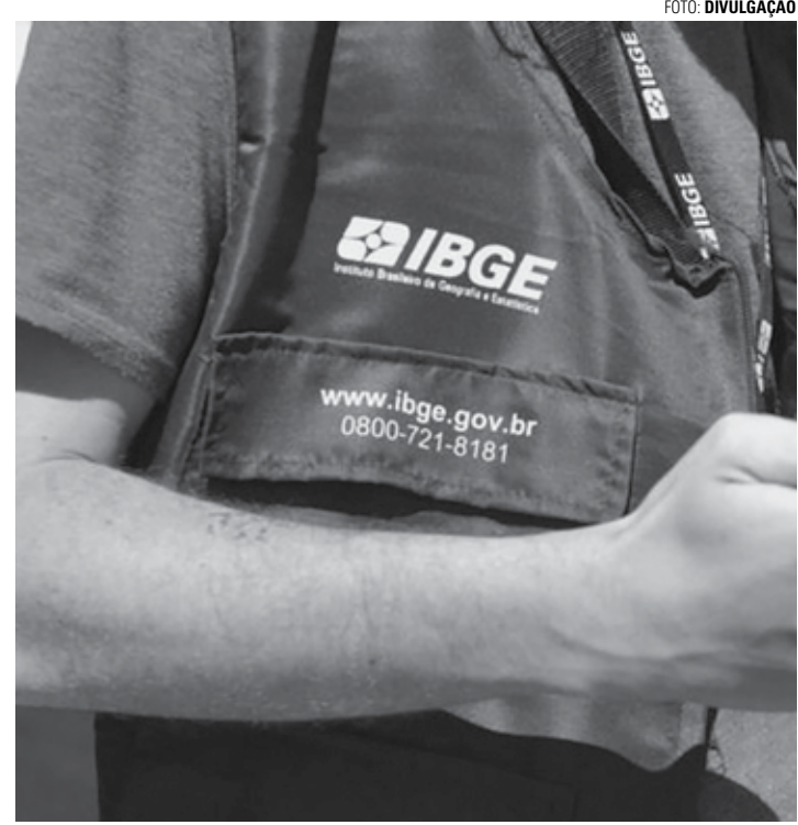
COLETA DE DADOS - Recenseamento do IBGE deve resultar na contratação temporária de mais de 200 mil pessoas

De acordo com os editais, quem atuar como agente cen-