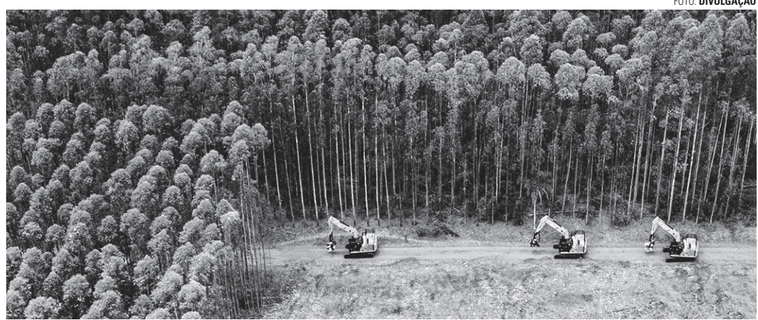
CAPACITAÇÃO - Candidatos selecionados no processo receberão treinamento da empresa

Empresa pretende contratar 450 motoristas de caminhão e operadores de máquinas florestais; evento acontece no Teatro Adélia Lorenzetti