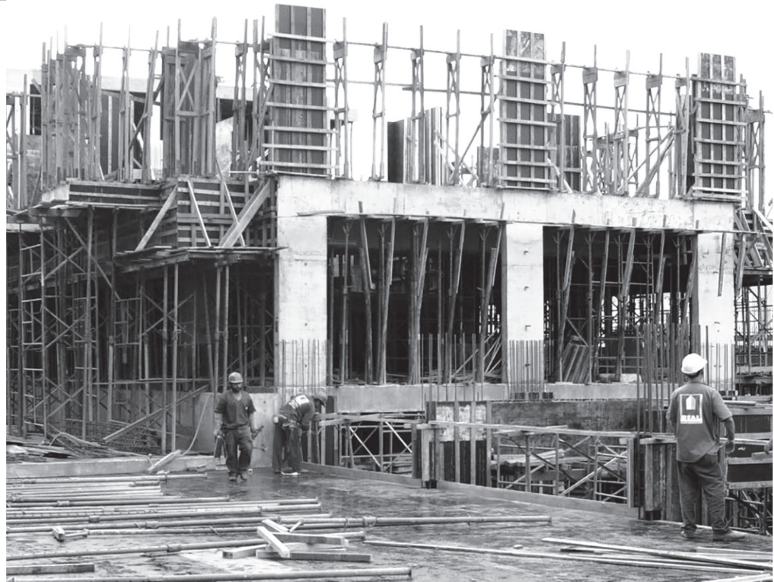
NA BALANÇA - Com indústria em baixa, contratações de setores como a construção civil contribuíram para equilibrar desempenho de junho

Entre as demais áreas, o destaque é a construção, que apresenta saldo positivo de 689 postos de trabalho (3.466 contratações e 2.777 demissões). Em seguida, aparece o setor de serviços, com 582 empregos gerados entre janeiro e junho (2.000 contratações e 1.418 demissões). Completan-