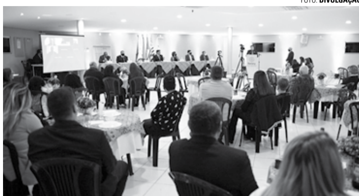
PLANEJAMENTO - Membros do Rotary Club de Lençóis Paulista se reúnem toda quarta-feira para discutir atividades