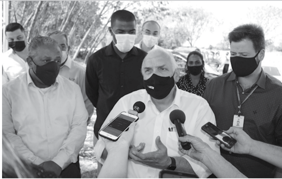
VISITA TÉCNICA - Comitativa da Secretaria de Logística e Transporte esteve em Lençóis Paulista na quinta-feira (19)

“Estamos trabalhando em um programa importantíssimo de recuperação de vicinais e rodovias paulistas criado pelo governador João Doria, com o orçamento organizado pelo vice-governador Rodrigo Garcia