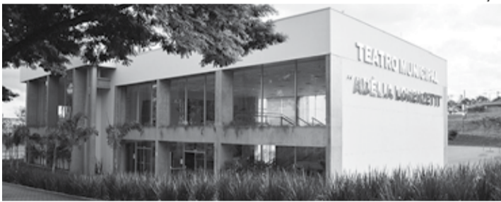
CIDADANIA - Drive-thru Solidário promovido pelo Abutre's Moto Clube e União dos Motociclistas LP acontece ao lado do Teatro Municipal

Evento arrecada alimentos, leite e agasalhos para o Fundo Social