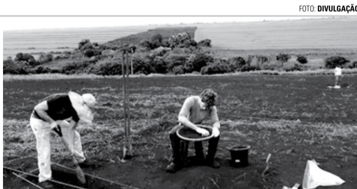
RIO DO ENGENHO - Escavações encontraram cerca de 1,6 mil artefatos no sítio arqueológico

na Chagas dos Anjos, responsável pelo PGPA, de acordo com as características das peças, é possível afirmar que a população que se estabeleceu na encosta era horticultora-ceramista vivia da agricultura e coleta de raízes, frutos e mel, e também produzia objetos cerâmicos e ferramentas em pedra.