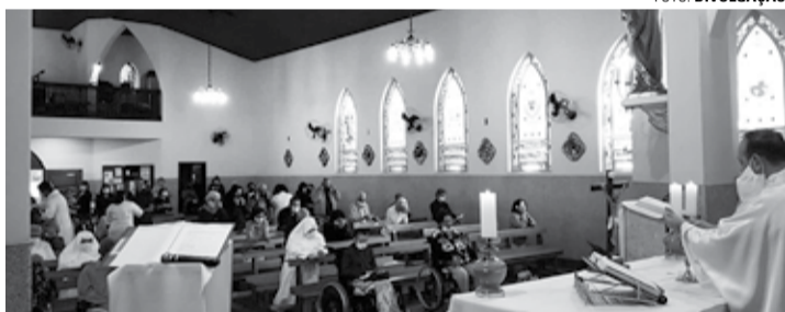
FÉ E DEVOÇÃO - parte religiosa começou na terça-feira (17) com início da celebração da novena em louvor à santa

Missa solene marca dia dedicado à padroeira dos velhinhos do Brasil