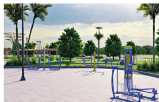
Academia ao ar livre