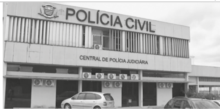
ATO INFRAACIONAL - Adolescente foi conduzido pela PM à CPJ de Bauru

Durante revista pessoal, em uma pochete que estava em sua cintura, a polícia encontrou sete porções de maconha,