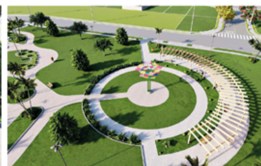
Pista de caminhada com gazebo

TODO SISTEMA DE LAZER JÁ ESTÁ PRONTO PARA USUFRUIR NO VILA DA MATA I