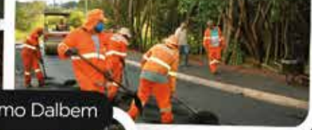
Rua Richieri Jácomo Dalbem