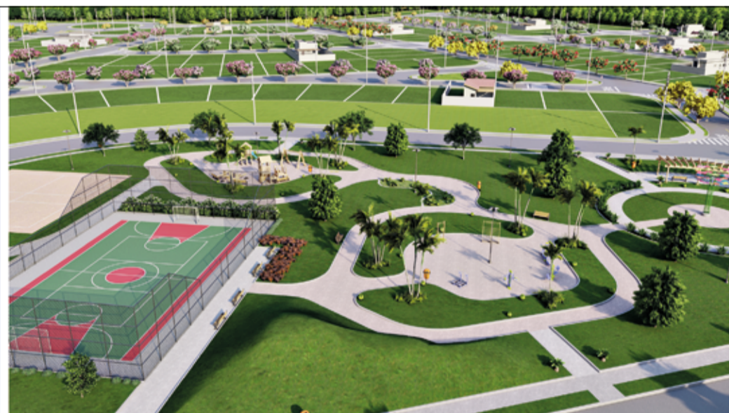
Praça com pista de caminhada, playground, quadras e academia ao ar livre

Excelente localização, fácil acesso e muito lazer para toda família.