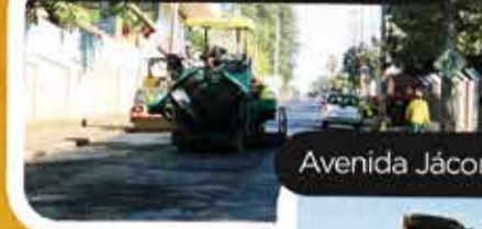
Avenida Jácomo Augusto Paccola