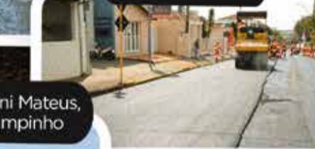
Acesso da Rodovia Osni Mateus, entrada do bairro Campinho