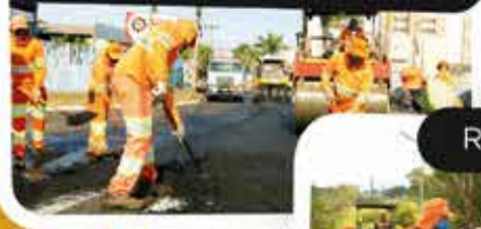
Rua José Veloso