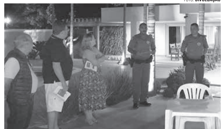
REUNIÃO - Moradores do São Judas Tadeu se reuniram na última segunda-feira 21 para ouvirem sobre o programa

Capitão Torres reforça que uma das intenções do grupo é criar uma boa relação entre os moradores do bairro. “Hoje em dia, a rotina é corrida e muitos vizinhos nem se conhecem. O Programa Vizinhança Solidária é uma forma de aproximar as pessoas, trocando informações que beneficiam todo o bairro no aspecto da segurança pública. A intenção era implementar o projeto em todos os bairros, mas estamos fazendo isso aos poucos, apenas quando alguém do bairro demonstra interesse e entra em contato com a Polícia Militar”, finaliza. ■