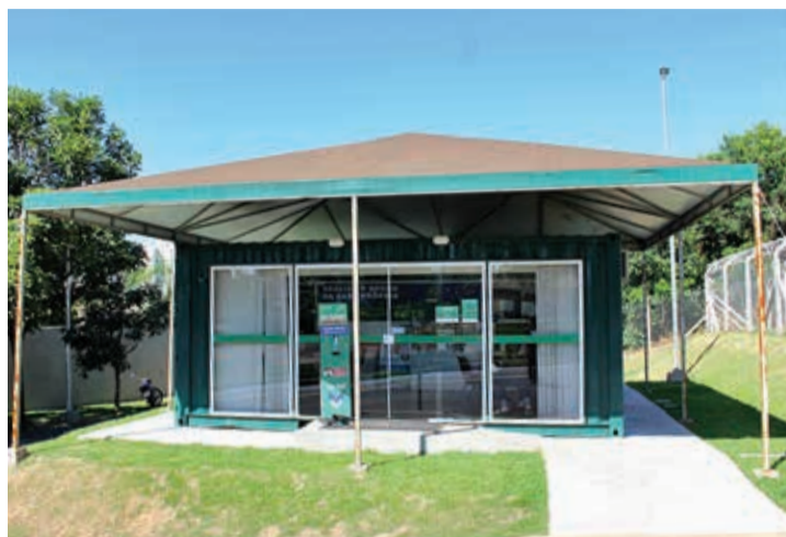
COMERCIALIZAÇÃO - Estande de vendas está localizado na Rua Rio Grande do Sul, 470, no Jardim Cruzeiro

"Projetamos as casas com uma planta excelente, com ótima disposição no terreno para que o cliente tenha facilidade para ampliar de acordo com suas necessidades, se assim desejar. Além disso,