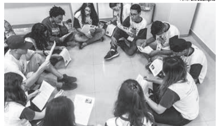
PROTAGONISMO - Em 20 anos de existência, Projeto Formação de Líderes já formou cerca de 500 jovens lençoenses

Feira de Profissões ouve jovens que fazem parte da história Projeto Formação de Líderes e ganharam o mundo com seu trabalho