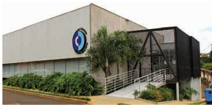
SEDE - Rede do Câncer inaugurou nova sede em 2019; local foi planejado para atender os usuários

A coordenadora já trabalha na instituição há 15 anos. No