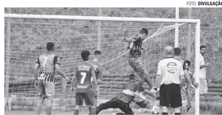
OLHO NO LANCE - No detalhe, registro de um dos gols dos Unidos da Vila sobre o Atlético Caju

No Estádio Municipal Zefeirino Ribeiro Sobrinho (Alfredo Guedes), o União Primavera se classificou sem dificuldade, apli-