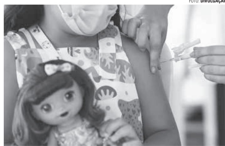
FORÇA-TAREFA - Equipes da Secretaria de Saúde visitam cinco escolas na semana que vem

De acordo com a assessoria de imprensa da Prefeitura Municipal, os pais estão sendo comunicados com antecedência da ação pelas próprias unidades escolares. Para que a criança possa receber a vacina, é importante levar os documentos de identificação, como o Cartão Cidadão, RG, CPF, além da car-