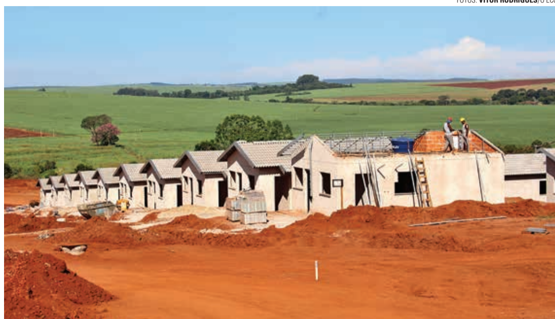
RITMO ACELERADO - Construção das casas do primeiro módulo do Jardim Yvone está em fase de conclusão

43,44 m 2 de área construída, com dois dormitórios, sala, cozinha, banheiro e área de serviço coberta. Os interessados podem conferir a casa decorada ao lado do estande de vendas localizado na Rua Rio Grande do Sul, 470, no Jardim Cruzeiro, em frente à Praça da Bíblia.