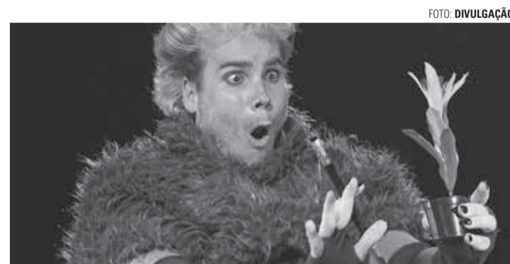
LÚDICO - Peça conta a trajetória de um ratinho à procura de seu pai, que acaba se revelando um artista

Espectáculo gratuito está marcado para a próxima quinta-feira (31)