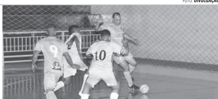
SÉRIE PRATA - Time da ALF derrotou o Rubens Futsal (meias brancas) por 5 a 2 na abertura da segunda fase

Na quarta-feira (23), no único jogo da Série Prata, Guarani e Atletas do Ferrari mantiveram o equilíbrio em quadra e abriram a noite com um empate de 4 a 4 em confronto válido pelo Grupo