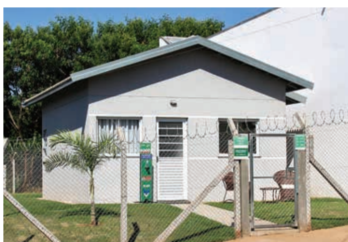
QUALIDADE - Interessados podem conhecer os detalhes do imóvel na casa-modelo construída ao lado do estande de vendas

contamos com mão de obra extremamente qualificada e utilizamos materiais de primeira qualidade para garantir o melhor aos moradores", destaca Diogo Zopone, diretor da Zopone Engenharia.