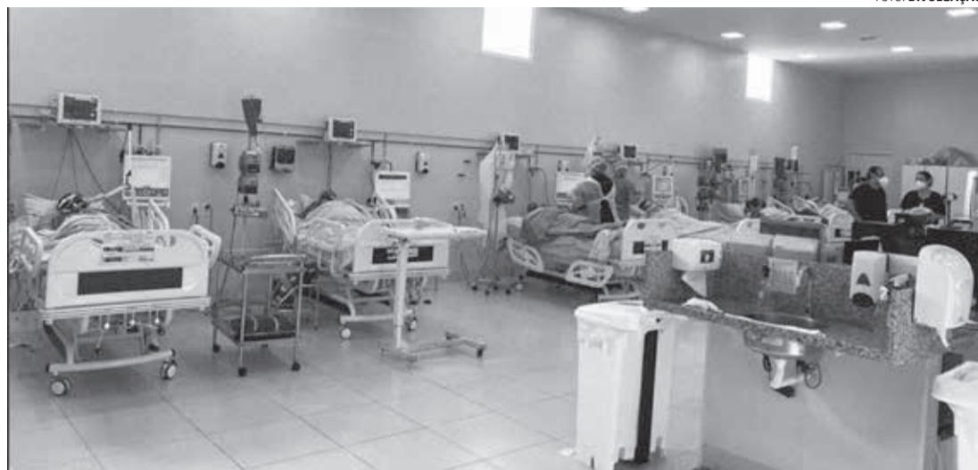
MOMENTO CRÍTICO - Cidade enfrentou seu pior momento entre março e abril do ano passado, com UTI Covid do Hospital Piedade (foto) completamente lotada e com escassez de medicamentos

"Por mais que a classe política diga que as pessoas podem retirar suas máscaras, ainda temos casos positivos, temos novas cepas em circulação. O fim da pandemia não está decretado. Talvez, logo consigamos