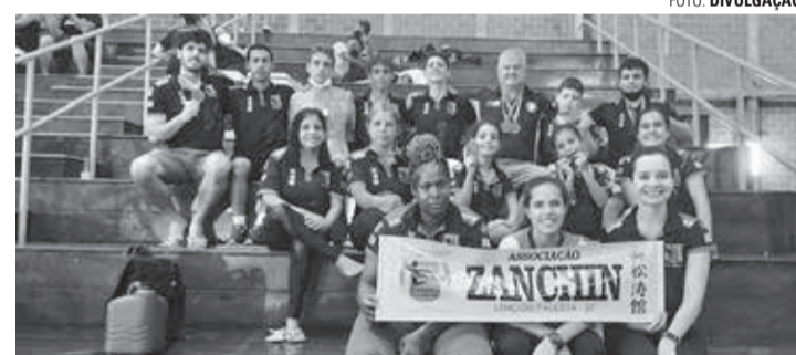
ÓTIMO DESEMPENHO - Nove atletas já têm vaga garantida na final do Campeonato Paulista de Karatê

Lençoenses viajam para Franca para participar de mais uma seletiva neste sábado