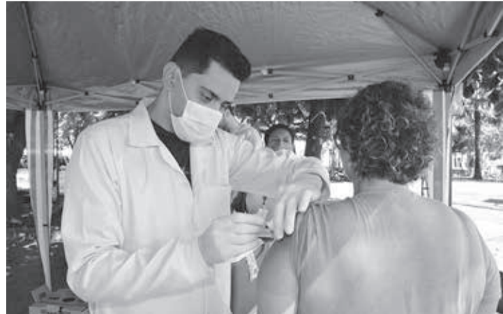
CAMPANHA - Primeira etapa da vacinação é voltada aos idosos com mais de 80 anos de idade

Ainda de acordo com a pasta, a idosos que estão dentro desta faixa etária podem atualizar a vacina contra a Covid-19 juntamente com a vacina contra a influenza. A partir do dia 4 de abril, próxima segunda-feira, a vacina também estará disponível para as pessoas com idade a partir de 60 anos, além dos profissionais que atuam na área da saúde. De acordo com o calendário, a campanha terá outras três etapas.