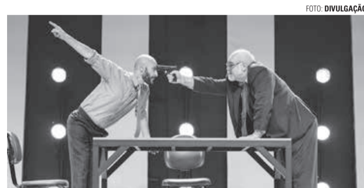
GRATUITO - Disponibilidade de ingressos para a peça pode ser consultada no Teatro Municipal

Peça 'O Beijo no Asfalto' é inspirada em livro homônimo do autor