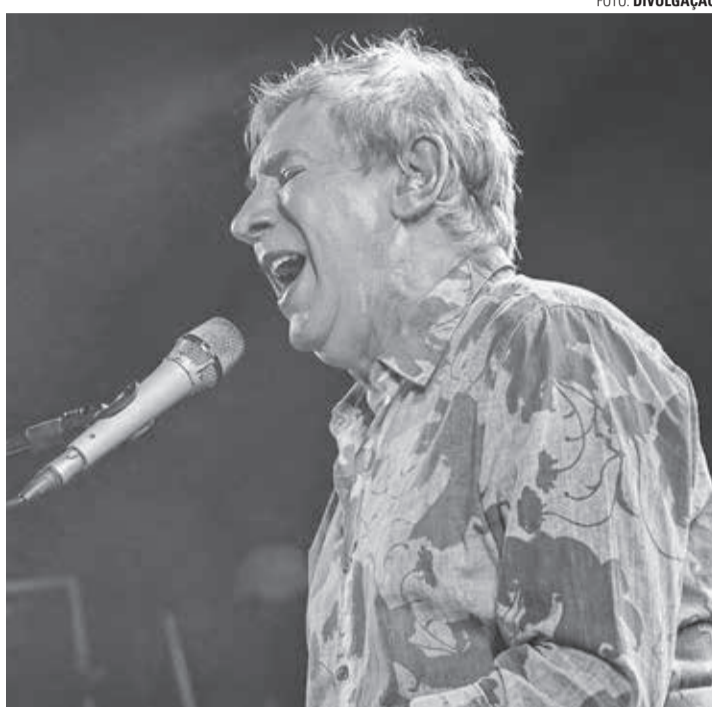
MUITA MÚSICA - Flávio Venturini anima público lençoense com grandes sucessos de sua carreira

A apresentação, denominada 'Girassol', tem duração prevista de 80 minutos e classificação indicativa livre. Os ingressos podem ser retirados a partir das 12h da próxima sexta-feira (1) na Casa da Cultura Prof. Maria Bove Coneglian (Rua Sete de Setembro, 934, Centro). ■