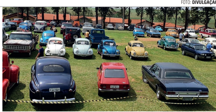
TRADIÇÃO - Evento que integra o calendário de aniversário da cidade

O encontro, que conta com o apoio do Club Antigos de Macatuba, deve receber pessoas de toda a região. A organização preparou diversas atrações, como mercado de pulgas, barracas de peças para colecionadores, artesanatos, praça de alimentação, exposição de mini Fuscas e, claro,