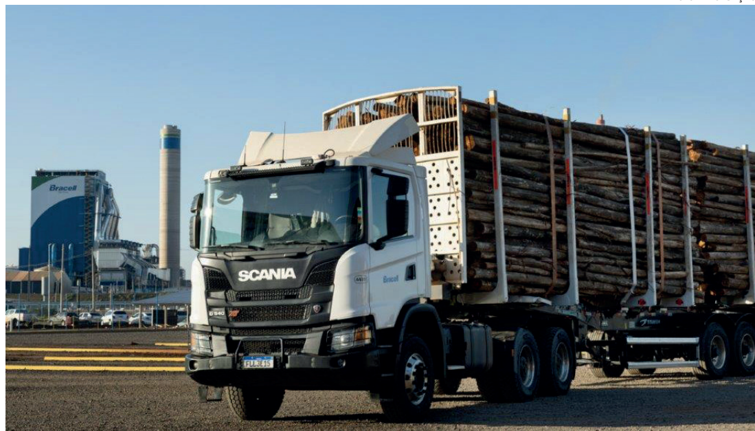
OPORTUNIDADE - Vagas são para atuação na região de Lençóis Paulista; cadastro pode ser on-line ou presencial