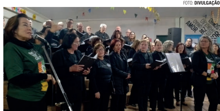
ESTREIA - Primeira parada do projeto foi na cidade de Macatuba, no dia 19

Na terça-feira, na escola Idalina, as atividades começam a partir das 15h40, com a oficina 'Canto Coral', exclusiva para alunos da escola. Às 19h, com participação aberta ao público, tem a palestra 'Os benefícios do canto coral para o desenvol-