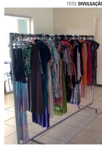
ENTREGA - Interessados podem retirar peças da campanha no Centro de Convivência Mario Rosa

A distribuição é aberta a toda a população, mas o foco da ação são as famílias que realmente precisam de auxílio. Além do período da Campanha do Agasalho, o órgão também recebe doações durante todo o ano para distribuir de acordo com a demanda.