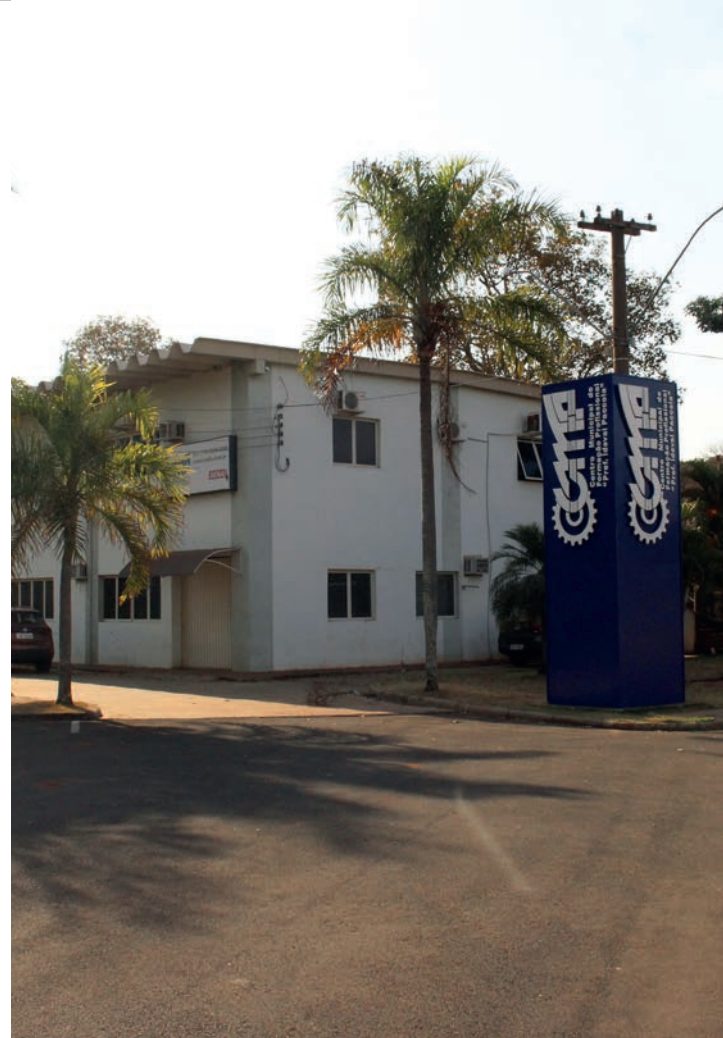
ESTRUTURA - Polo da Beleza vai funcionar ao lado do Centro Municipal de Formação Profissional; construção está inicialmente orçada em R$ 797,1 mil

A licitação da obra estava prevista para abril, mas não recebeu propostas. Um novo certame ocorreu em 14 de junho teve três empresas participantes: Corcrl Revestimentos Industriais, DCA de Souza e Construelen Construtora Len-