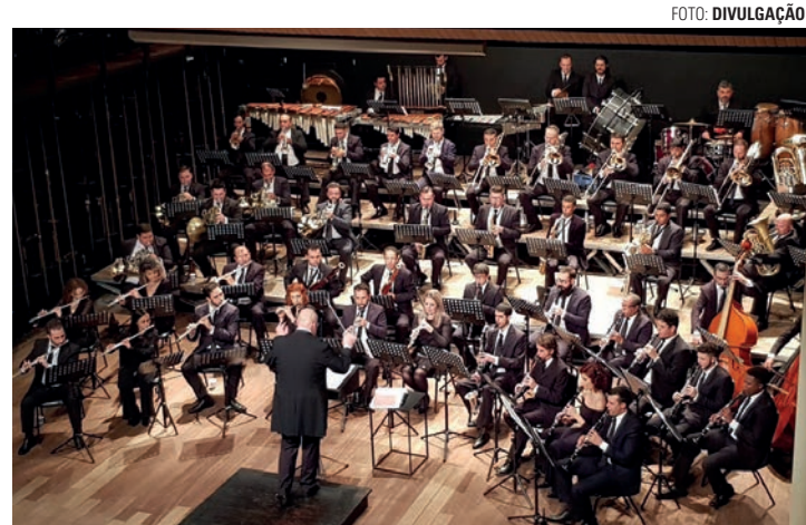
ENCONTRO - Evento deve reunir vários maestros e músicos internacionais

"A realização da 1ª Conferência em nossa cidade é o reconhecimento pelo trabalho desenvolvido na área cultural. É um momento único para todos os músicos e artistas. Lençóis Paulista vai receber os melhores maestros, músicos e especialistas em música de todo o mundo.