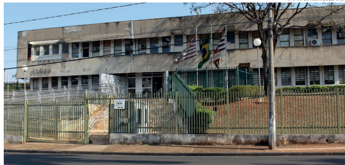
JULGAMENTO NO FÓRUM - Indivíduo foi condenado pelo Tribunal do Júri na terça-feira (27) a 16 anos de prisão

Na noite do crime, os dois indivíduos saíram em uma motocicleta vermelha, modelo