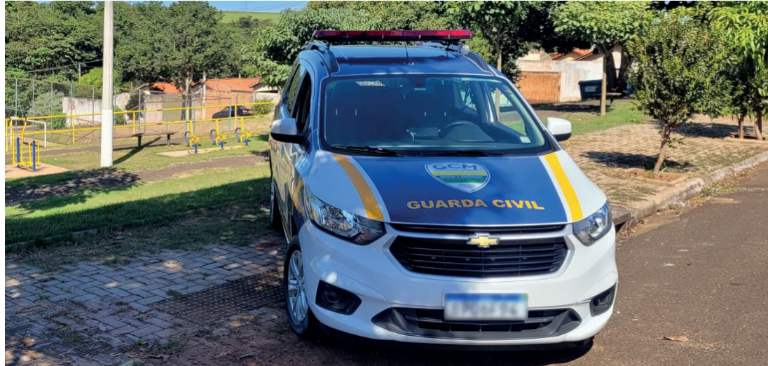
REFORÇO NA SEGURANÇA - Guarda Civil Municipal terá 10 novos guardas a partir desta segunda-feira (3)

A GCM poderia estar operando desde 2021, mas uma Ação Civil Pública movida pelo Ministério Público contra