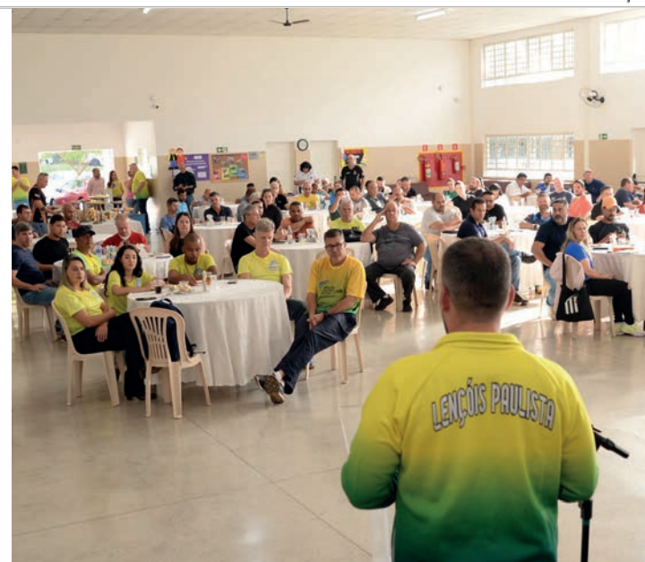
PONTAPÉ INICIAL - Congresso Técnico realizado na quarta-feira (28) reuniu representantes de 48 cidades no Centro de Convivência do Idoso

A competição deve contar com 23 praças esportivas para receber as modalidades, além de dezenas de prédios públicos,