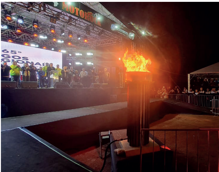
FESTA - Cerimônia reuniu representantes de todas as delegações inscritas; 48 municípios participam em pelo menos uma modalidade