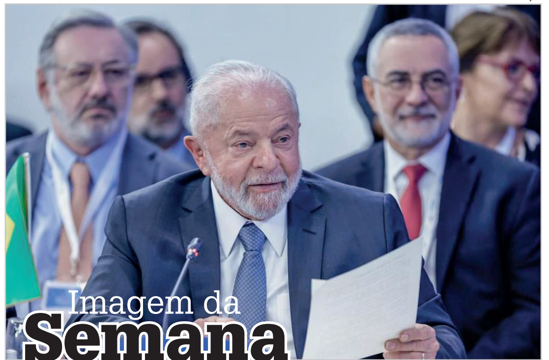
Imagem da Semana

É triste e preocupante ver que mal saímos daquela que acabou se tornando a maior crise sanitária já vista na história recente da humanidade e já nos deparamos com outro preocupante problema de saúde pública. Seguiremos falhando enquanto sociedade ou passaremos a fazer a nossa parte, que é o mínimo do mínimo?