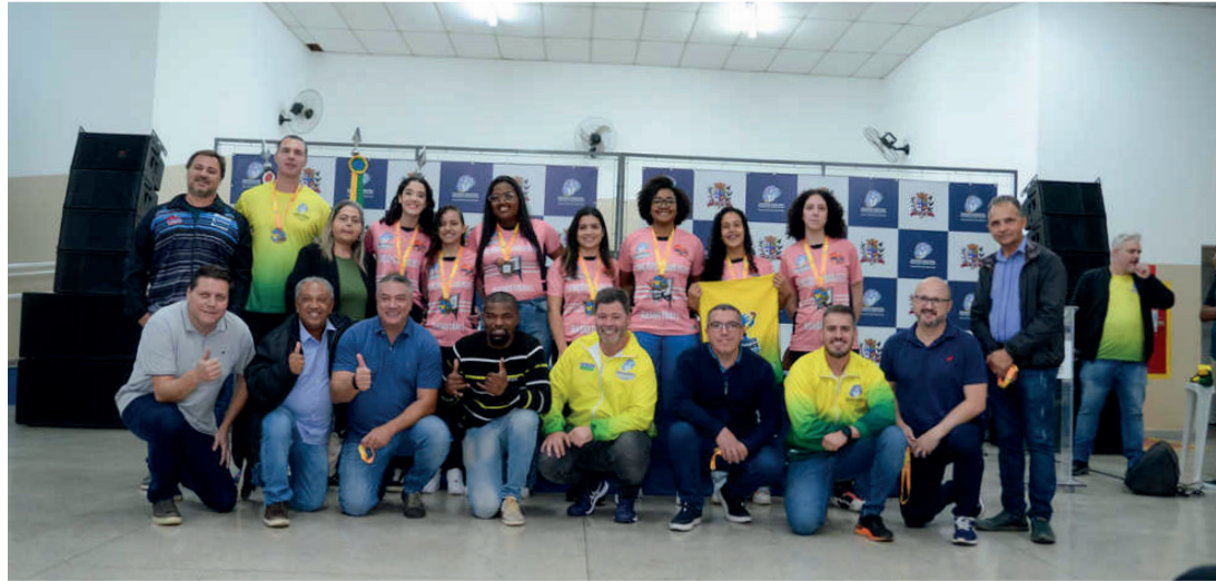
EM CASA - Delegação lençoense participa de 20 modalidades nesta edição dos Jogos Regionais; na foto, evento realizado na noite dessa quinta-feira (13) para homenagear atletas locais que jogarão em nome do município