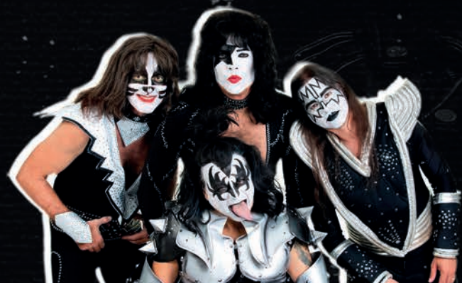
Kiss Killers 15/07