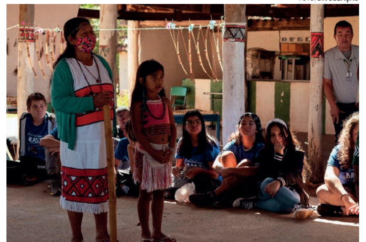
IMERSÃO - Jovens também terão uma vivência indígena na Aldeia Tereguá, em Avaí; projeto exalta a importância dos povos originários

Durante o acampamento, que está acontecendo na escola Maria Zelia Camargo Prandini, em Lençóis Paulista, os alunos estão participando de oficinas de audiovisual que nortearão a produção de curtas-metragens, além de vivências com estudantes da África. Também haverá uma vivência indígena na Aldeia