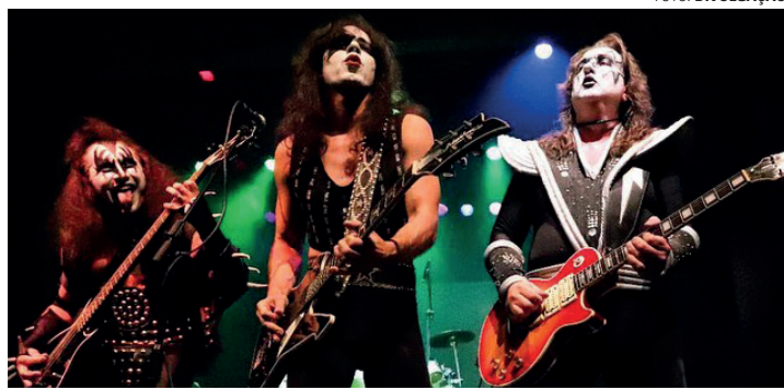
DIAS DE ROCK - Banda Killers Kiss Cover encerra a programação deste sábado (15) no palco do 4º Motorock; ao todo, 19 bandas se apresentam

Ao longo do festival, que tem se tornado um dos principais do estado, também se apresentam