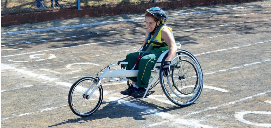
EM AÇÃO - Na foto, atleta da Adefilp competindo em Lençóis Paulista nos Jogos Regionais disputados em 2017

Referência no esporte adaptado, a Adefilp sempre foi responsável por grande parte das medalhas conquistadas