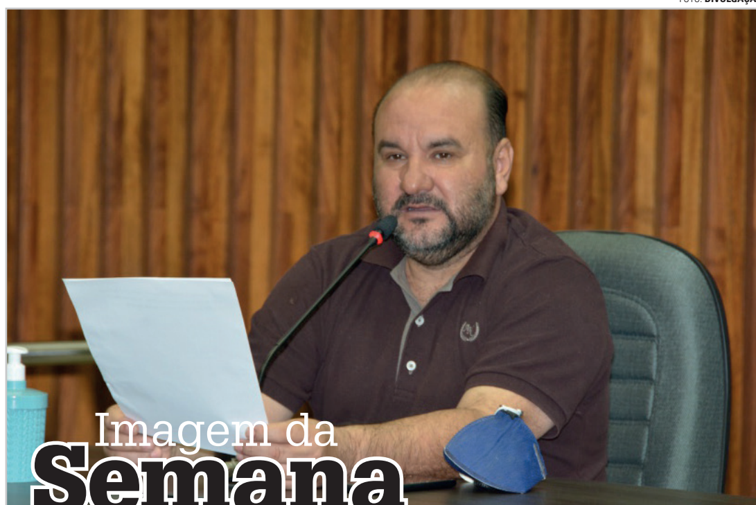
Imagem da Semana

O Melhores do Ano surgiu com o propósito de reconhecer o empenho e a dedicação daqueles que tanto contribuem para o desenvolvimento econômico e social de Lençóis Paulista. Pessoas físicas e jurídicas que nos servem de exemplo a cada dia; figuras inspiradoras que, em meio às adversidades que surgem pelo caminho, nos motivam a seguir em busca de nossos objetivos.