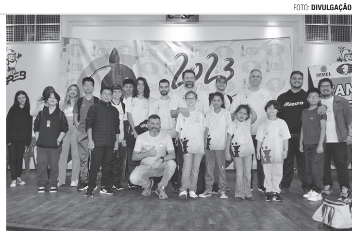
COMPETIÇÃO - Equipe local participou da 11ª etapa com 21 competidores

Outros três competidores lençoenses garantiram boas colocações na etapa bauruense. Estela Souza da Conceição ficou