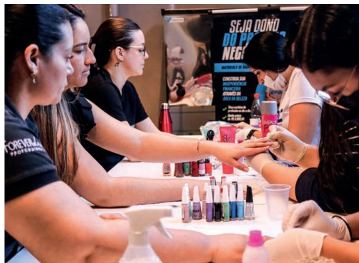
SUCESSO - EFAC Eventos conta com diversos serviços de beleza para abrilhantar todo tipo de evento, desde confraternizações a encontros corporativos

Durante o evento, cerca de 70 funcionários da Forever Liss puderam vivenciar uma rica experiência com cinco serviços disponibilizados: massoterapia, maquiagem, manicure, cabeleireiro e barbeiro. Para proporcionar esse dia de beleza, uma equipe de 38 pessoas, entre professores,