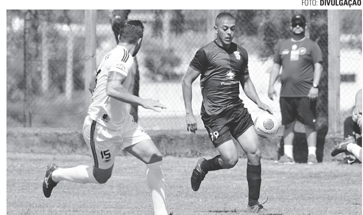
GOLEADA - O time do Atlético Primavera (na foto, utilizando o uniforme escuro), superou a equipe do Grêmio da Vila com uma vitória de 8 a 0

Outros quatro jogos movimentam a Série B na rodada. No Estádio Municipal João Roberto Vagula (Vagulão), às 8h, se enfrentam São Cristóvão e Atlético Caju. Na sequência, às 10h, medem forças Raça Carolina e Monte Azul. No