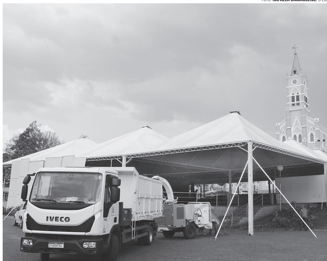
PREPARATIVOS - Estrutura já está sendo montada para receber Festa da Padroeira em frente ao Santuário