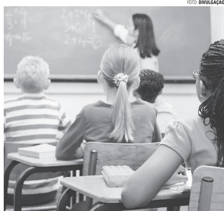
SELEÇÃO - Provas dos dois concursos públicos serão realizadas no dia 8 de outubro; edital com as informações está disponível no Diário Oficial

Para aqueles que não desejam participar do novo con-