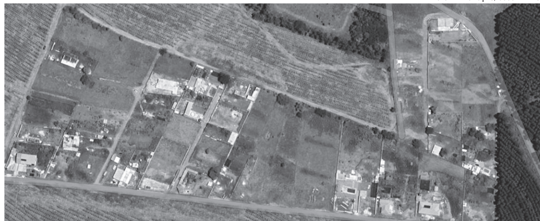
IRREGULARES - Lotes desmembrados sem registro estão espalhados por diversas áreas diferentes do município

Podem aderir à Reurb os beneficiários, diretamente ou por meio de cooperativas habitacionais, associações de moradores,