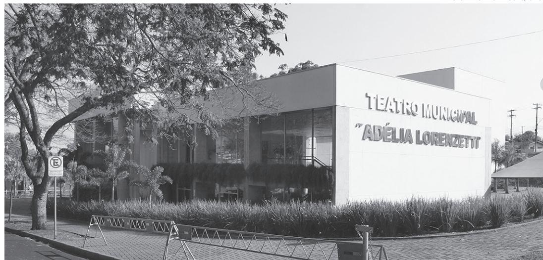
NA PASSARELA - Concurso de Miss e Mister Melhor Idade acontece no Teatro Municipal Adélia Lorenzetti

Vale destacar que, para se inscrever, é necessário ter 60 anos ou mais até a data do con-