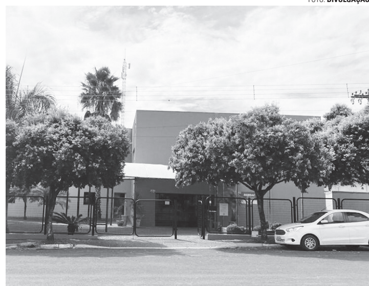
NEGOCIAÇÃO - Os interessados em aderir ao Refis devem se dirigir ao Paço Municipal de Borebi e procurar o Setor de Arrecadação e Tributos

Desconto para pagamento à vista é de 100%