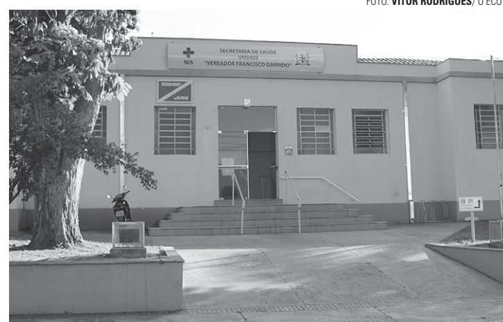
ANÁLISE - Saúde estuda os valores recebidos antes de fazer pagamentos

Para o pagamento dos retroativos (maio, junho, julho e agosto), além de outras cinco parcelas, incluindo o 13º salário, o Ministério da Saúde, por meio do FNS