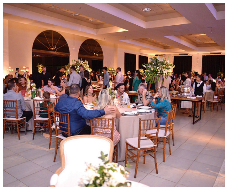
IMPECÁVEL - Convidados foram recepcionados em uma incrível festa para celebrar a entrega da infraestrutura do empreendimento Villacittà 2

Mais de 500 convidados compareceram ao Clube Marimbondo na noite da sexta-feira (6)