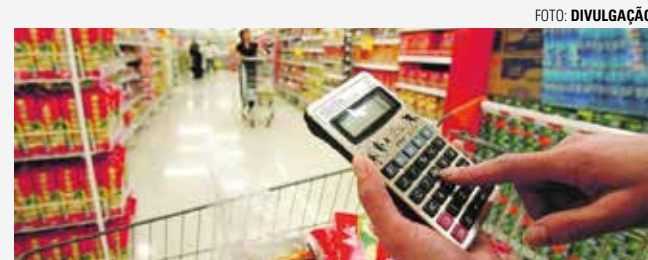
ALTERNATIVA - Para consumidores, melhor opção é optar por marcas mais baratas ao invés de visitar vários supermercados

Para gastar menos sem deixar de comprar todos os itens programados para as ceias de Natal e Ano Novo, uma alternativa é pesquisar os melhores preços e visitar diferentes supermercados da cidade. No entanto, a correria de final de ano e a falta de tempo devido às obrigações corriqueiras acabam tornando essa medida inviável para muitos consumidores. A principal opção das pessoas entrevistadas tem sido escolher as marcas mais baratas encontradas em um mesmo supermercado.