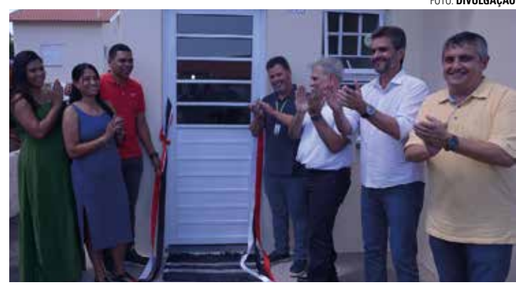
CHAVE NA MÃO - Famílias contempladas receberam as chaves na quinta

-feira, a CDHU concluiu a entrega de 131 unidades - as primeiras 49 foram liberadas para os mutuários no mês de setembro. De acordo com informações obtidas pela reportagem de O