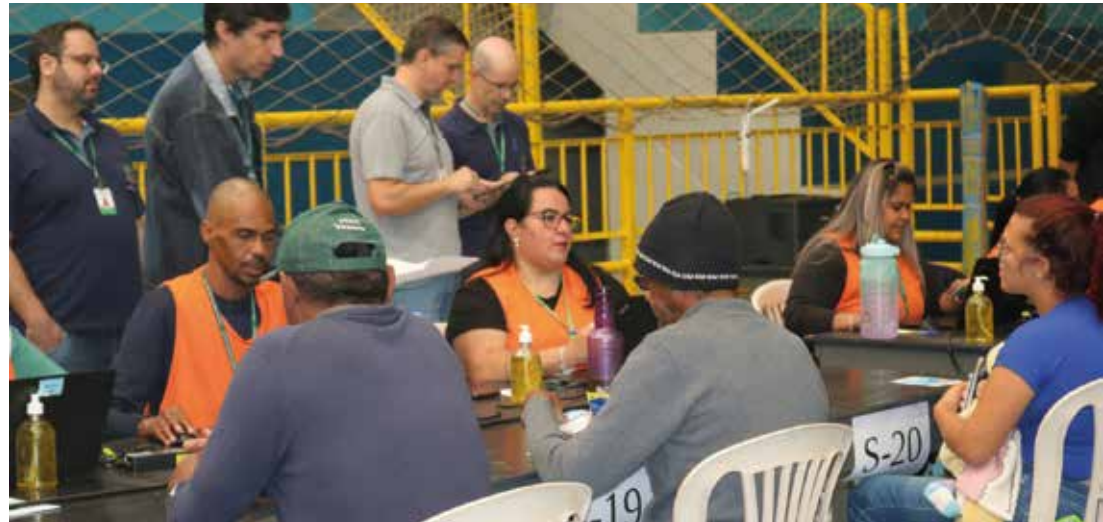
ESPERANÇA - Cerca de 2 mil famílias inscritas no programa estão aptas a concorrer ao sorteio das casas

"Neste momento, não temos como estabelecer um prazo, pois existem muitas demandas em re-