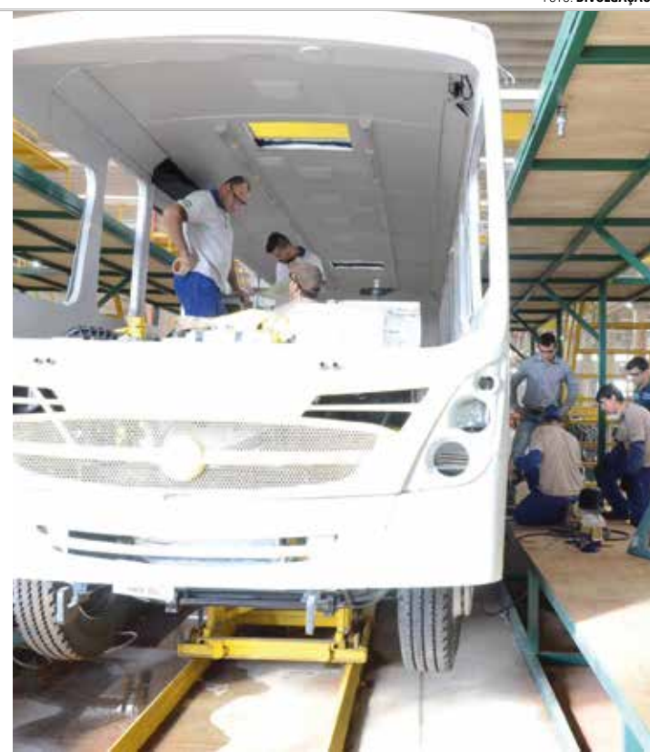
OPORTUNIDADE - Ação promovida pela empresa Caio Induscar acontece no prédio do Sebrae Aqui de Areiópolis, no Centro da cidade

O candidato deve ter Ensino Médio completo, ser maior de 18 anos e possuir carta de reserva ou certificado de dispensa do Serviço Militar, no caso dos homens. Também é desejável possuir cursos técnicos e/ou