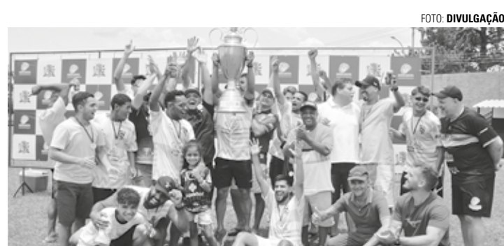
FESTA EM CAMPO - Monte Azul (uniforme claro) levou a melhor sobre time da Ponte Preta na final disputada na manhã do último domingo (10)

Com início contundente, time venceu representação da Ponte Preta por 3 a 2