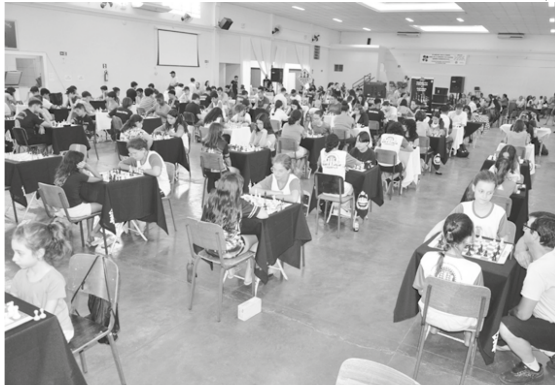
FINAL DE TEMPORADA - Mais de 100 enxadrists participaram da etapa final realizada no último sábado (9)

A competição, que contou pontos para os ratings oficiais da CBX (Confederação Brasileira de Xadrez) e da FIDE (Federação Internacional de Xadrez), contemplou cinco categorias divididas por idade, com chaves masculinas e femininas (Sub-8, Sub-10, Sub-12, Sub-14 e Sub-18), além de duas categorias especiais, Abs-