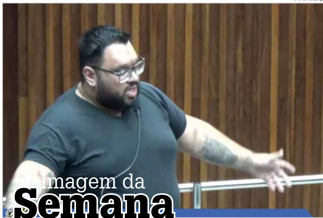
Imagem da Semana

Lendo o livro de Timothée Parrique, não se considera exagero a sua afirmação de que a economia se tornou uma arma de destruição em massa.