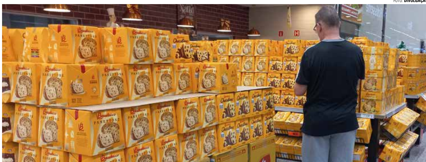
BARATO X CARO - Preços de produtos comuns nas ceias de Natal apresentam grandes variações entre os estabelecimentos de Lençóis Paulista

O quilo do frango inteiro, sempre incluído como opção mais em conta em grande parte das ceias de Natal, varia de R$ 7,79 a R$ 12,49 (60,33%). Na seção de bebidas, os vinhos tinto e branco da marca Palmeiras tiveram a mesma diferença no levantamento realizado. Ambos podem ser encontrados de R$ 13,99 a R$ 21,85 (56,19%). O abacaxi inteiro está sendo vendido de R$ 7,99 a R$ 11,99 (50,06%). Outra grande variação foi vista no quilo do damasco, encontrado entre R$ 79,99 a R$ 119,20 (49,01%).