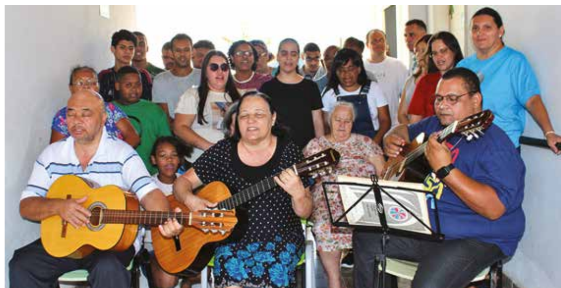
VIDA ILUMINADA - Projeto oferece aulas de informática, música, locomoção com bengala, artes e leitura em braille para pessoas cegas ou com baixa visão de Lençóis Paulista e Macatuba

“O programa Vida Iluminada vai além de ensinar habilidades. Ele ilumina vidas, proporcio-