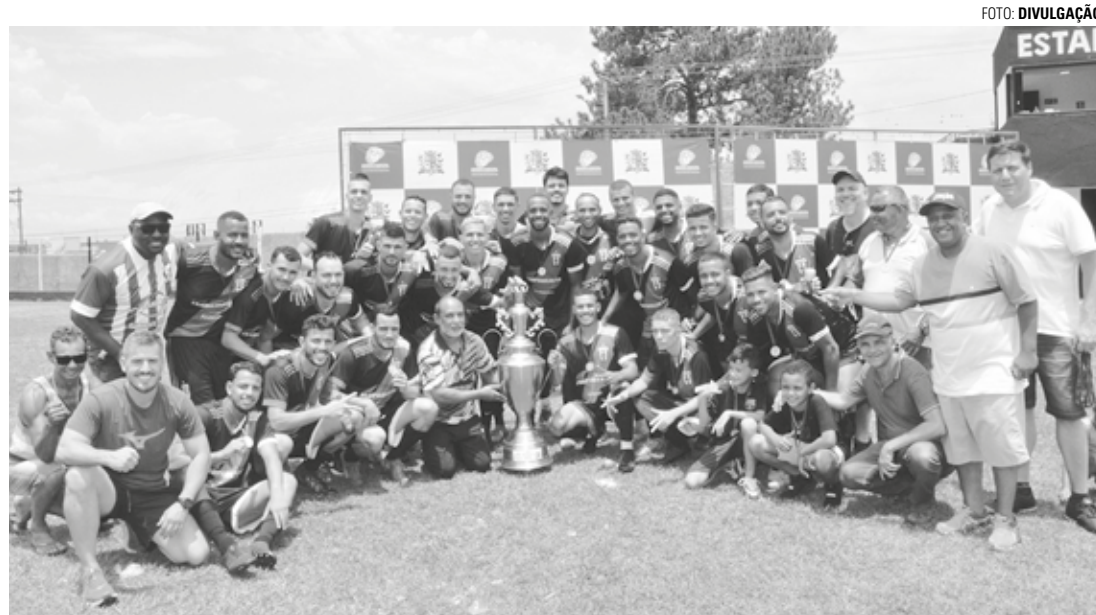
REPETECO - Atlético Primavera (uniforme escuro) levantou taça da Copa Regional pelo segundo ano consecutivo

Depois de eliminar o Grêmio Cecap com uma convincente vitória de 4 a 2 na semifinal disputada no último dia 3, o time lençoense chegou com a moral renovada para a decisão, mas encontrou um Expressinho